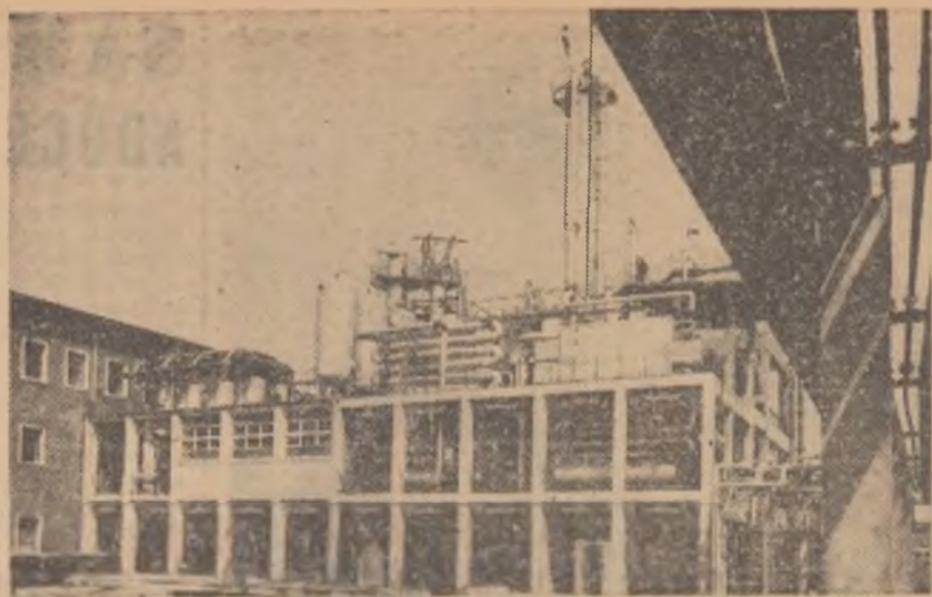
Vedere parțială a uzinei de fibre sintetice din Săvinești, regiunea Bacău.

Cu prilejul sărbătoresc al celei de-a 16-a aniversări a eliberării României de sub jugul fascist, clasa muncitoare, țărănimea muncitoare și intelectualitatea, făcînd bilanțul strălucitelor lor realizări în grandioasa operă de construcție pașnică, își demonstrează hotărîrea fermă de a nu-și precupeți eforturile pentru a da viață marelui program de perspectivă elaborat de partid, pentru continua propășire a patriei noastre scumpe, aducînd astfel o contribuție de seamă la victoria sistemului mondial socialist în întrecerea pașnică cu capitalismul, la triumful cauzei păcii.