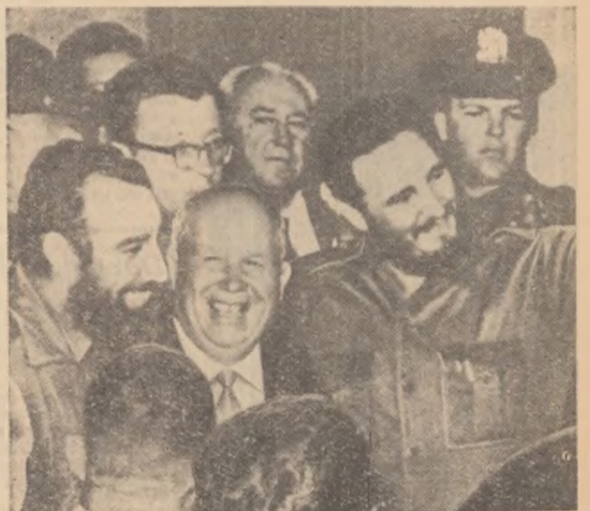
Aspect de la întrevăderea dintre N.S. Hrușciov și Fidel Castro

— Am considerat ca o datorie a mea să fac o vizită acestui erou, care a ridicat steagul luptei poporului cuban pentru libertatea și independența sa, al luptei celor săraci împotriva celor bogăți și a asigura victoria poporului muncitor, a declarat N. S. Hrușciov. Oamenii sovietici salută cu căldură această victorie și urează poporului cuban și conducătorului lui, Fidel Castro, cele mai mari succese.