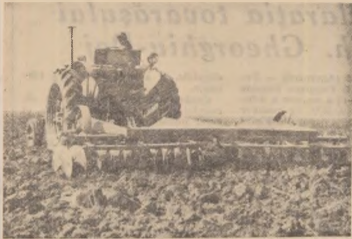
Pe pămînturile gospodăriei colective din comuna Gingiova, discuitul se efectuează imediat după arăturile adînci