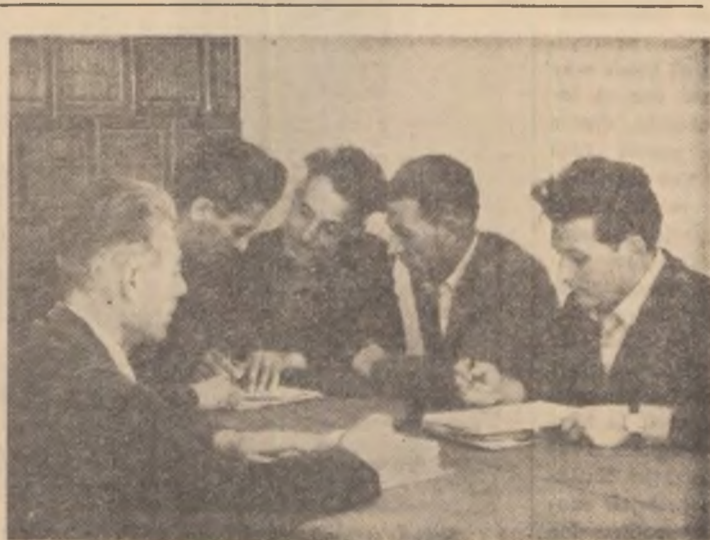
Colectivul de conferențieri din comuna Segarcea, întocmind planul de muncă pentru sprijinirea campaniei agricole de toamnă

responsabilul gazetei de stradă din comuna Gingiova, raionul Gura Jiului