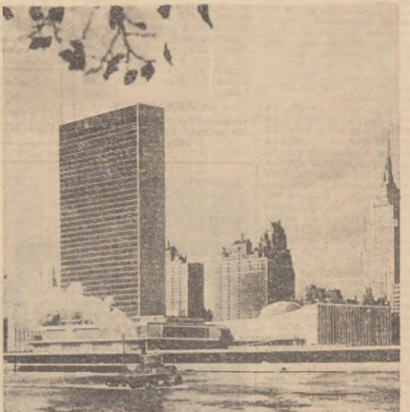
Sediul Organizației Națiunilor Unite, unde se desfășoară lucrările celei de-a 15-a sesiuni a Adunării Generale a O.N.U.

Pe orbite — se salută! Doar e cerul plin de drumuri În vârtejuri avîntate Și cu mîna mai că-atingem Chiar planete-ndepartate. Zile mari și uimitoare Să urcăm din treaptă-n treaptă; Printre nouri luna mîndră Pasul omului — așteaptă! Nu ni-e teamă de-nălțare, Căci departe-n constelații, Zări destule de-nflorire Au prin veacuri, generații! Pe pămînt — doar fericire; Înrățiri și mari întreceri Zilnic, omule al Terrei, Pentru slava ta să seceri! ...Eu trimit fără adresă Un cuvînt planetei toate: Cucerească bucuria, Drumul tău — umanitate!