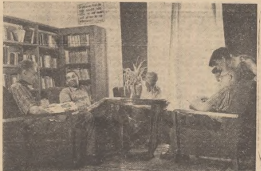
ARTICOLUL 78 — Cetățenii Republicii Populare Române au dreptul la odihnă. În fotografie: oameni ai muncii la odihnă în stațiunea balneoclimatică Găvoara