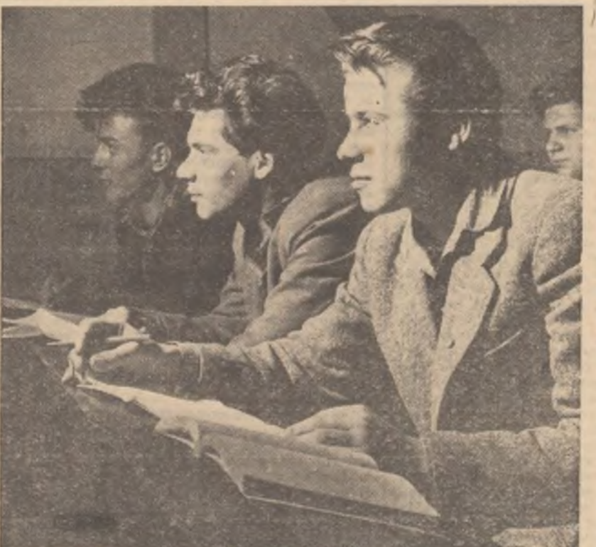
ARTICOLUL 80 — Cetățenii Republicii Populare Române au dreptul la învățătură. În fotografie: un grup de elevi, muncitori la Uzinele „Timpuri Noi” din Capitală