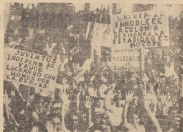
Aspect de la mitingul din San Juan, capitala statului Porto Rico, în cadrul căruia mii de cetățeni au protestat împotriva controlului exercitat asupra țării de capitaliștii nord-americani.

Printr-o declarație dată publicității, reprezentanții diferitelor partide politice din țările africane, care fac parte din Liga africană din Cairo, condamnă manevrele S.U.A. care violează suveranitatea tinerei Republici Congo. Totodată ei au adresat tuturor conducătorilor țărilor antiimperialiste și anticolonialiste care participă la lucrările celei de-a 15-a sesiuni a Adunării Generale a O.N.U., precum și conducătorilor de state care nu participă la lucrările acestei sesiuni, apelul de a acorda un ajutor ferm și necondiționat guvernului Republicii Congo în frunte cu Lumumba.