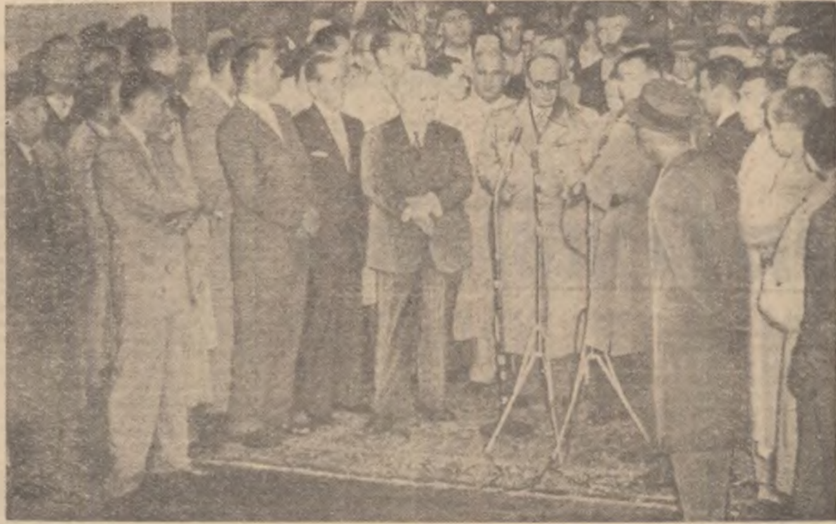
Sosirea la New York. Tovarășul Gh. Gheorghiu-Dej rostindu-și declarația; alături (în stînga) — tovarășul N. S. Hrușcirov