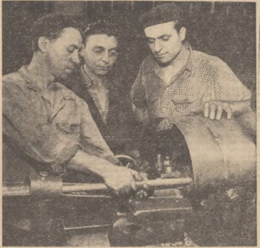
ARTICOLUL 77 — Cetățenilor Republicii Populare Române le este asigurat dreptul la muncă, adică dreptul de a căpăta o muncă garantată și plătită potrivit cu cantitatea și calitatea ei. În fotografie: membrii unei brigăzi fruntașă de la Uzinele Republicale din Capitală

Să stăm de veghe. Să păstrăm cu abnegație și devotament marile cuceriri și realizări dobândite pe drumul luminos al socialismului. În ele este garanția vieții fericite pe care o construiește poporul muncitor în frunte cu eroica noastră clasă muncitoare.