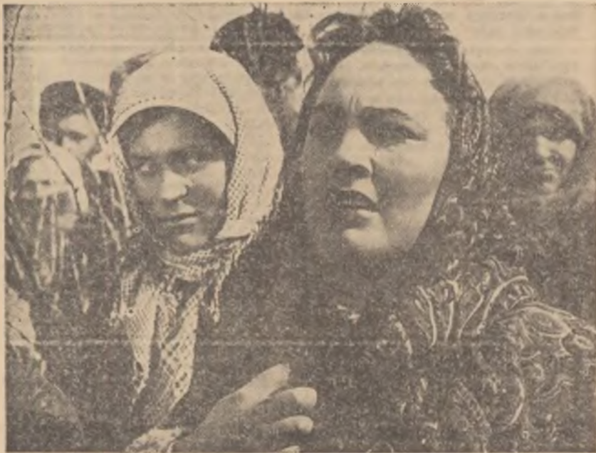
În zilele Festivalului filmului sovietic va fi prezentat pe ecranele bucu-reștene și filmul „Pământ desțelenit” (seria I-a și a II-a). În fotografia noastră, actrița sovietică Liudmila Hitiava în rolul Lușkăi din filmul „Pământ desțelenit”.