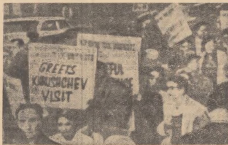
NEW YORK. În fața clădirii Reprezentanței sovietice la O.N.U. o demonstrație a oamenilor muncii din New York în apărarea păcii. Pe pîncarte se poate citi „Sindicaliștii din New York salută vizita lui Hrușciiov”.

Insistînd asupra necesității discutării problemei dezarmării generale și complete la ședința plenară a Adunării Generale a O.N.U. cu participarea șefilor de guverne, și nu în Comitetul Politic, așa cum a recomandat Comitetul general. N. S. Hrușciiov a subliniat în încheierea cuvîntării sale că „popoarele din lumea întreagă așteaptă ca Organizația Națiunilor Unite să deschidă, în sfîrșit, calea spre rezolvarea unei probleme atît de urgente și vitale, cum este dezarmarea generală și completă”.