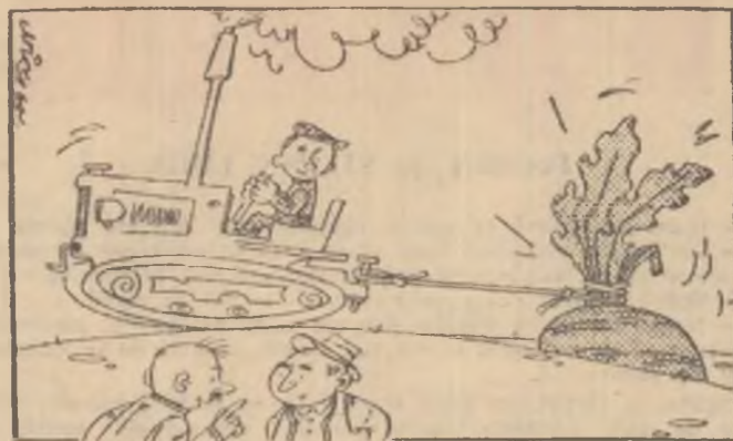
— Sîntem obișnuși să aplicăm metode noi !!

Lucrînd după regulile agrotehnicilor, coactiviștii din comuna Peștera, regiunea Constanța, au realizat o producție de 60.000 kg. sfeclă de zahăr la hectar.