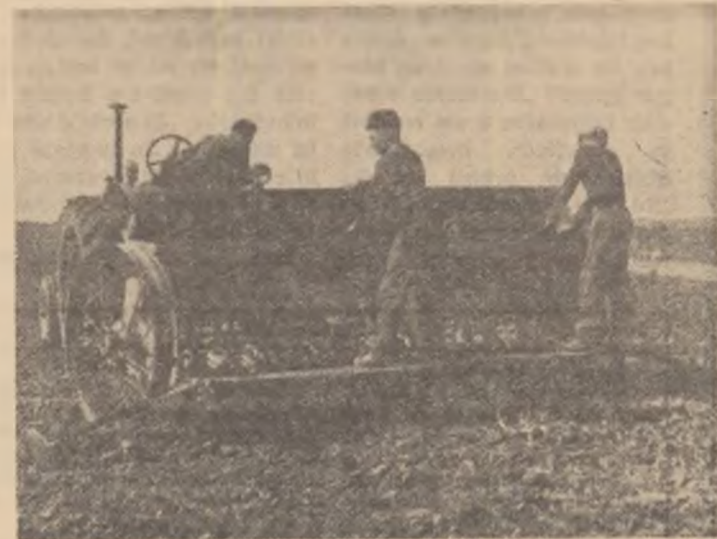
În aceste zile, pe ogoarele regiunii Craiova se însămînțează de zor. Printre gospodăriile colective frunțase la însămînțări se numără și cea din comuna Gîngiova, raionul Gura Jiului. Organizîndu-și bine munca, coactiviștii din Gîngiova au însămînțat pînă în aceste zile mari suprafețe de teren

În vie se recoltează strugurii, lucrare deosebit de însemnată. După recoltare se desfac viștele de pe araci sau de pe simnele spalierului, se fac tăieturile pentru a ușura îngropatul. O dată ou aceste lucrări se recoltează coardele altoi de la butucii de soiuri bune. Coardele recoltate se fasonează, se leagă în pachete și se