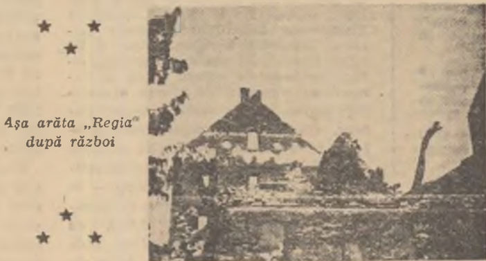
Așa arăta „Regia” după război

conștientă și puternică, capabilă să lupte cu succes pentru obținerea unor revendicări nu numai sociale economice, ci și politice.