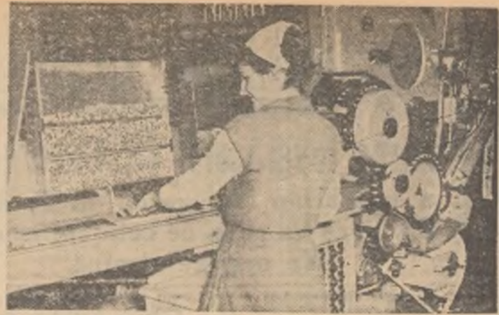
Una din mașinile automate de fabricat țigări.

Alți ani și alte suferințe. Femeile continuau să muncească pînă la istovire în ateliere umede, în frig și întuneric. Continuau, ca și mai înainte, să nască lingă mașini. Una din acestea a