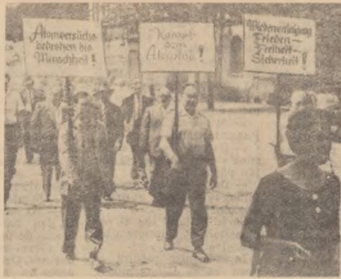
Aspect de la puternica demonstrație a populației din orașul vest-german Dortmund împotriva înarmării atomice a R. F. Germane

„Acesta este omul care conduce una din țările sudice din blocul comunist. Nu am putut să nu mă gîndesc că a fost o greșală că nu l-am permis să călătorească puțin prin S.U.A. și să vadă cît de sincer do-rește pacea și poporul american”, încheie Drew Pearson.