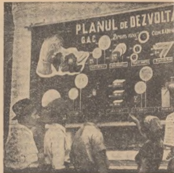
Intovărășiți din raionul Titu, în vizită la colecționarul Negru, în fața panoului care oglindește perspectiva gospodăriei în următorii doi

Cules din comuna Isaccea, raionul Tulcea de la RAFAEL ISIDOR de AUREL MUNTEANU