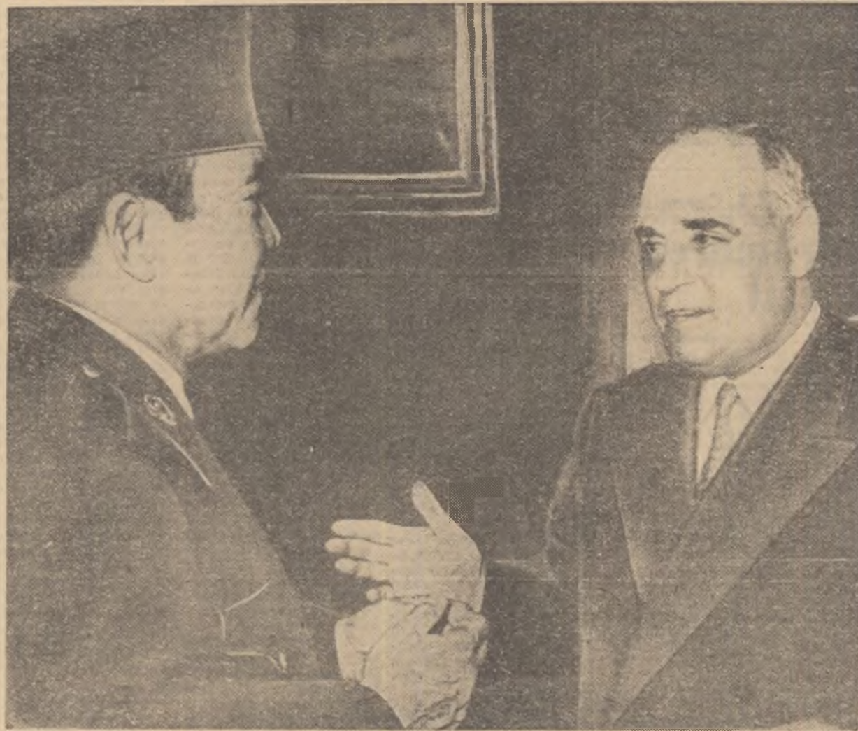
Convorbire între tovarășul Gh. Gheorghiu-Dej și președintele Indoneziei, Sukarno, la recepția oferită la 5 octombrie la New York de tovarășul N. S. Hrușciov.