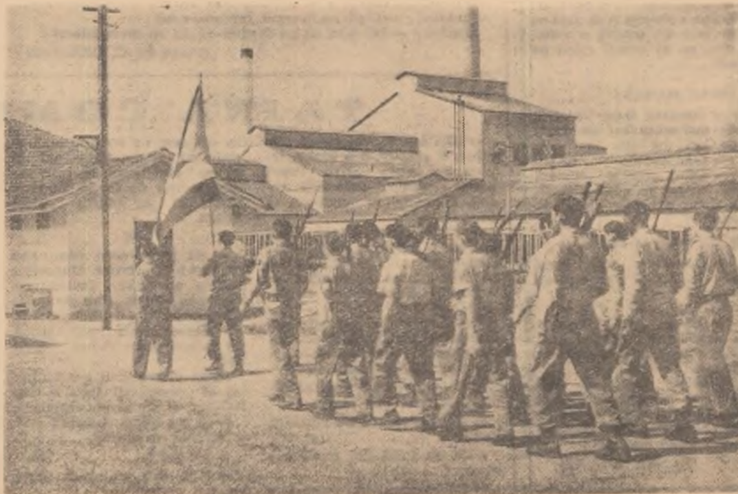
Milițieni cubani iau în primire Fabrica de zahăr Soledia din provincia Las Villas (Cuba), aflată pînă de curînd sub controlul S.U.A.