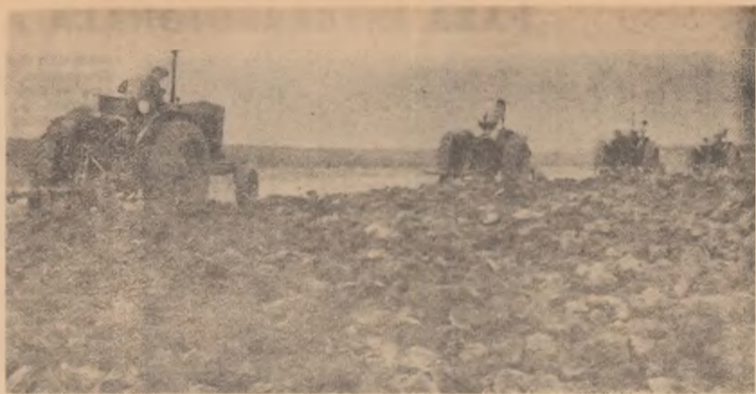
Pînă la data de 10 noiembrie a.c., colectivității din comuna Vădeni, regiunea Galați, cu ajutorul S.M.T. „1 Mai” din Brăila, au ogorit peste 400 ha. pămînt din cele 720 ha. planificate.