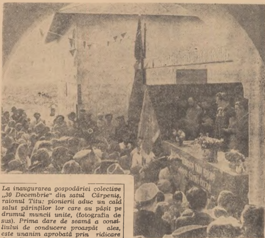
La inaugurarea gospodăriei colective „30 Decembrie” din satul Cărpeniș, raionul Titu: pionierii aduc un cald salut părinților lor care au pășit pe drumul muncii unite, (fotografia de sus). Prima dare de seamă a constiinței de conducere proaspăt ales, este unanim aprobată prin ridicare de mîini. (fotografia din mijloc). Hora colectivizatorilor este cea mai veselă din cîte s-au jucat pînă acum la Cărpeniș. (fotografia de jos).

Marea familie colectivă primește la sînul ei noi și numeroși membri. Recent s-a încheiat colectivizarea raionului Oltenița. Între Jiu și Olt, au fost inaugurate într-o singură zi patru gospodării colective: la Brădești, Coțofenii din Dos, Dioști și Balș. Potrivit știrilor sosite din toate colțurile țării, sectorul socialist în agricultură se lărgeste necontenit. Astfel, în răstimpul de la 30 iunie la 31 octombrie a.c., în gospodăriile agricole colective s-au înscris 102.337 familii cu 293.884 hectare teren agricol.