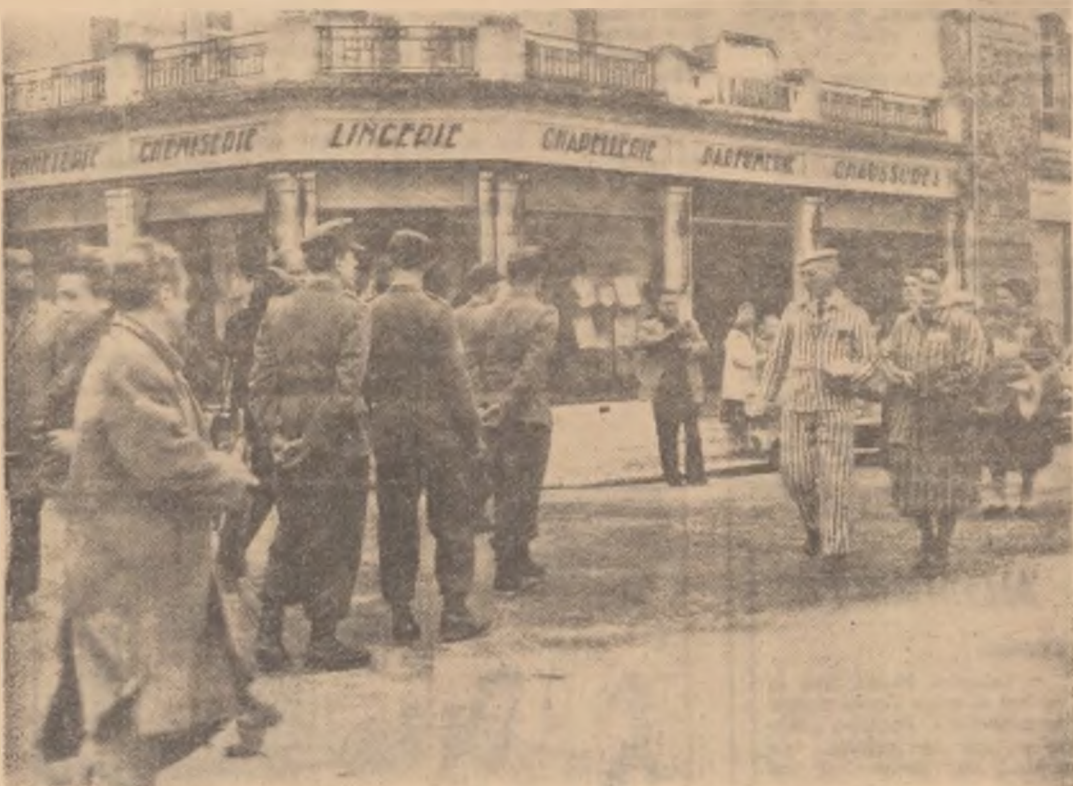
Patrioți francezi, foști comouani, membri ai mișcării de rezistență și foști internați în lagărele naziste, protestează la Mourmelon (Franța), împotriva noii invazii a militaristilor vest-germani în Franța. In fotografie: patrioți francezi, în costumele de deținuți, împart populației orașului, afișe.