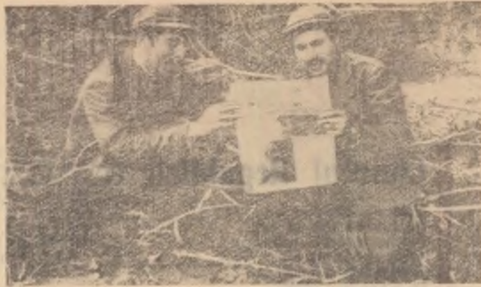
In fotografia de sus:

Poporul nostru, alături de toate popoarele iubitoare de pace, protestează cu energie împotriva samavolnicilor din Congo și cere ca patrioții congolezi să fie puși imediat în libertate.