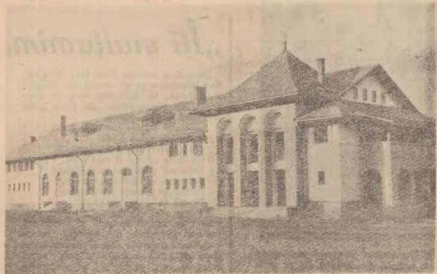
Noul cămin cultural din comuna Breaza, regiunea Ploiești.