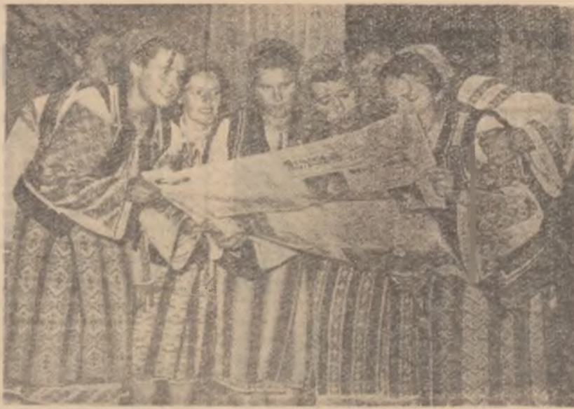
Brigada artistică de agitație a căminului cultural din Hangu, raionul Piatra Neamț, în programele prezentate dă o mare atenție problemelor educației tineretului.