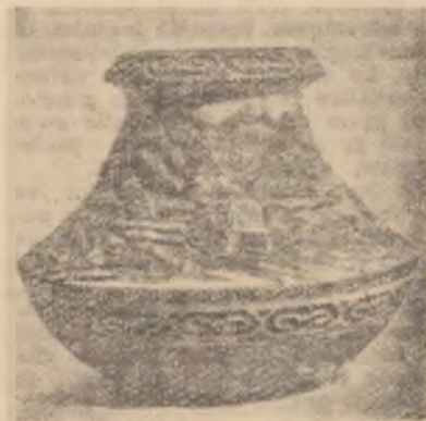
Vas sculptat (pirogravură) de IOAN TZAHMAN din Piatra Neamț (Bacău)