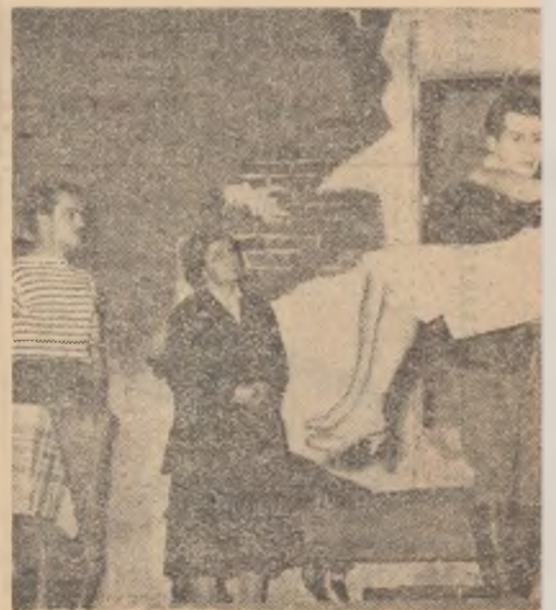
O scenă din actul III. al piesei „Nila” de Salinski

„Sărbă întîlneaz care arti din Făgă nală. Du sa este ca unor de recolt făcut nu înd spe Voila, l felul ace ros schir mațiile n