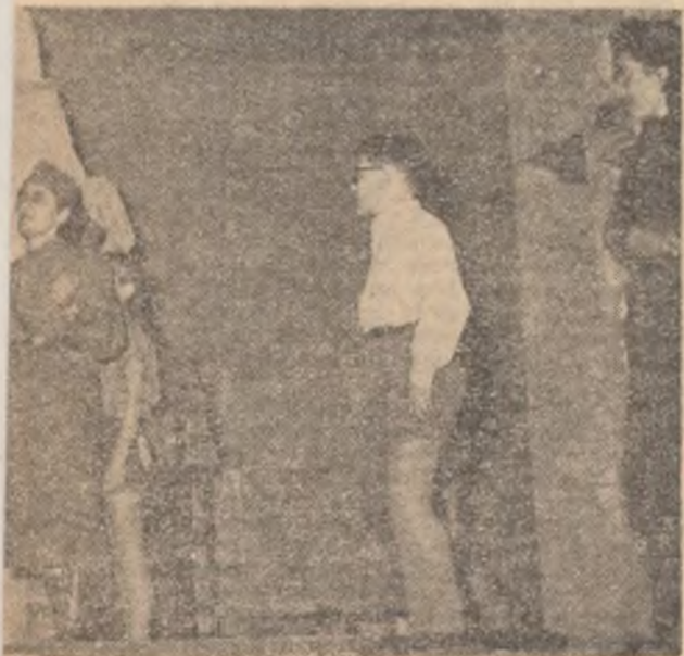
Interpretarea echipei Sindicatului lucrătorilor din învățămînt.