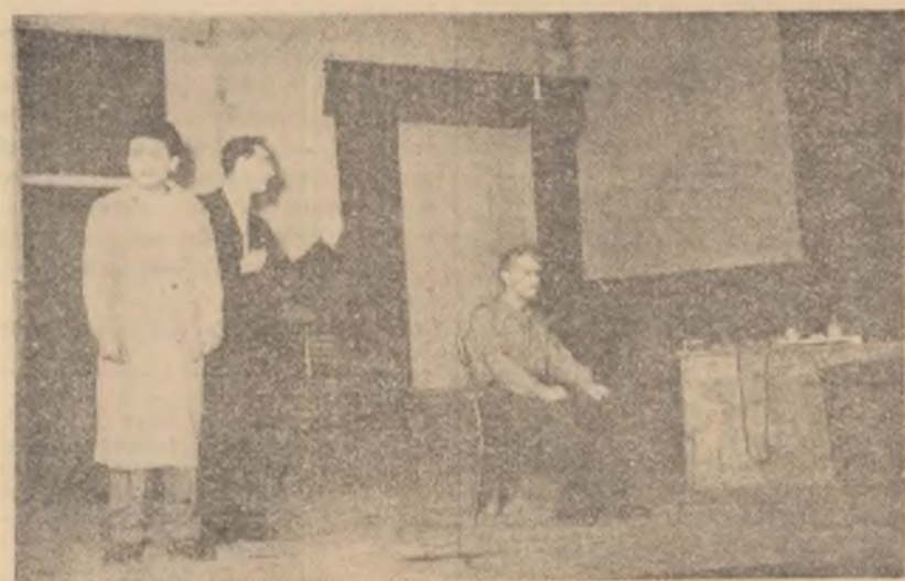
Echipe de teatru a Uzinelor „Wilhelm Pieck” din Brăila, a prezentat piesa „Anii negri” de A. Baranga și N. Moraru

Cei mai buni artiști amatori, reprezentanți demni ai celor 100.000 de entuziaști ai artei teatrale din orașele și satele țării au venit la București pentru a da viață măiestriei lor artistice, pentru a da glas ideilor înaintate ale epocii noastre și sentimentelor de dragoste și recunoștință față de Partidul Muncitoresc Român și guvernul țării.