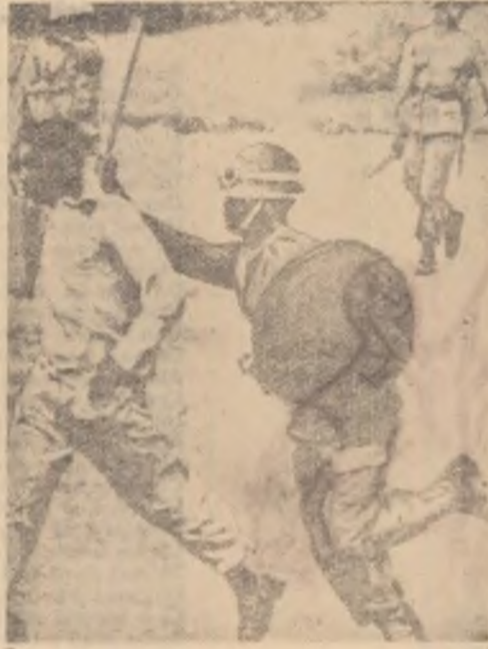
In fotografia de jos:

Soldații ai armatei de eliberare algeriene urmăresc evenimentele, citind ziarul mișcării de eliberare din Algeria.