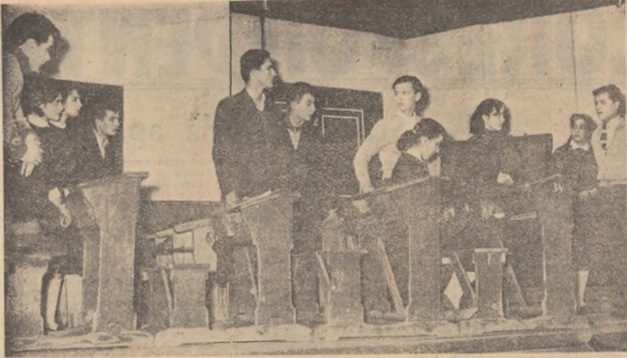
„Nota zero la purtare”, dar nu pentru artiștii casei raionale de cultură din Giurgiu. Dacă nota pentru măiestria artistică va fi pronunțată mai târziu de către juriu, pentru străduința și munca lor, artiștii din orașul de pe malul Dunării merită nota zece.