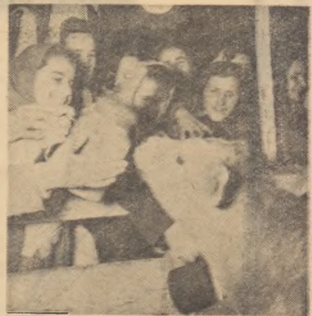
La ferma de vaci a colectivei