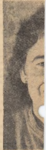
AN , colectivistă în regiunea Banșcripția ele pentru Mar