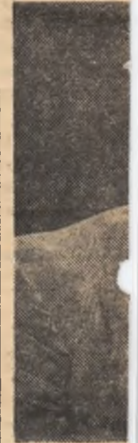
TU , președintele al statului gălniceanu, didat în orș 57 Medgidia

mama lîngea cî față, pe lăsase v avea înc — A Zamfir aici.