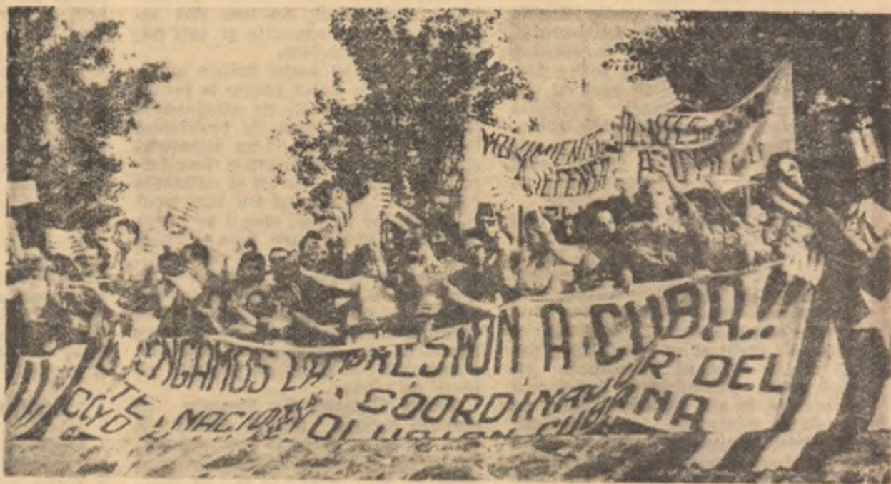
Demonstrație la Montevideo (Uruguay) în sprijinul revoluției cubane.

Poporul congolez nu va putea fi ingenușiat în lupta sa pentru libertate și independență. „Va veni ziua cînd — așa cum arăta Patrice Lumumba în ultima sa scrisoare — istoria își va spune cuvîntul. Dar aceasta nu va fi istoria predată la Bruxelles, Paris, Washington și O.N.U. Aceasta va fi istoria predată în țările care s-au eliberat de sub jugul colonialismului și al marionetelor lor”.