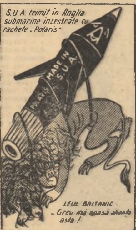
(Desen de V. VASILIU)