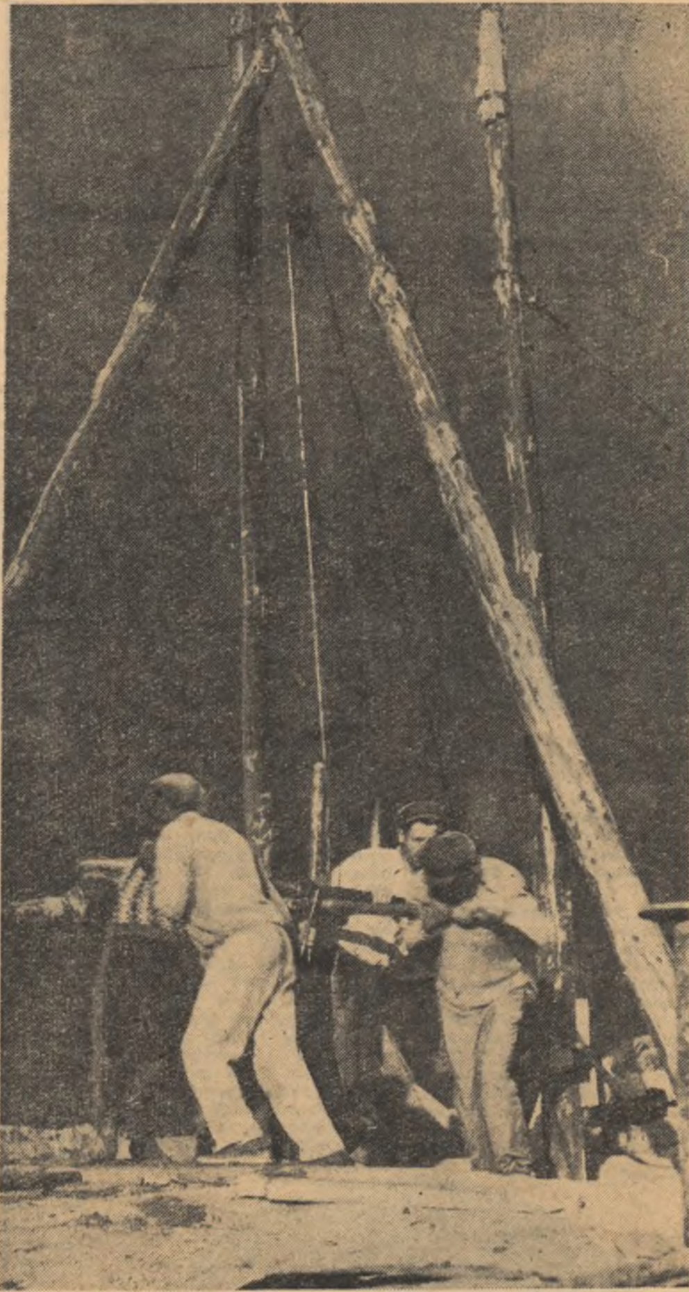
Pentru irigarea grădinii de zarzavat, colectivității din Dragoș Vodă, raionul Călărași, au forat puțuri de mare adîncime cu bazine din care apa va fi dirijată pe canalele de irigație. În fotografie: Aspect de la forarea primului puț.