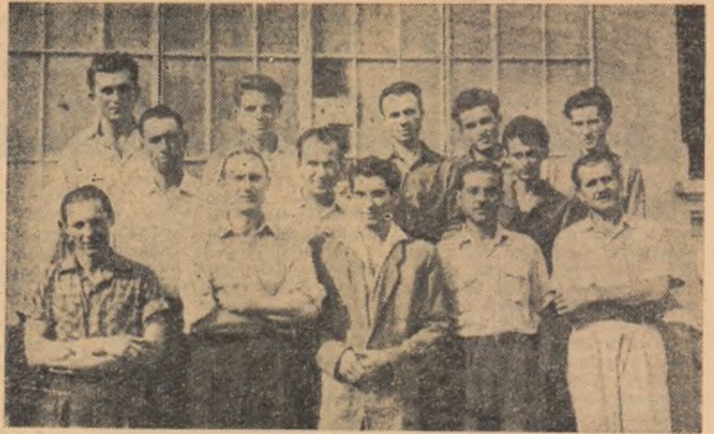
Membrii brigăzii „30 Decembrie” zîmbesc mulțumiți. Au și de ce. Pe trimestrul II au cîștigat întrecerea de cea mai bună brigadă din secția lăcătușerie.

O ultimă semnătură însoțită de parafă recepționerului și oamenii aliați de față la finalizarea documentului de însoțire al mașinii își zîmbesc mulțumiți, felicitîndu-se reciproc din ochi. Au mai trecut un examen. Al cîtelea pe ziua de azi? Combina din fața lor — opera întregului colectiv din uzină — a căpătat liberă trecere. O vom întîlni curînd, ca și pe suratele ei, plutind parcă pe talazurile nesfîrșite de grîne ale colectivităților din Bărăgan, din mînoasa Oltenie sau însoțita Moldovă. Poartă cu ea o tăbliță cu patru inițiale: U.M.A.S.-Uzinele de mașini agricole „Semănătoarea”. U.M.A.S. reprezintă cartea de vizită, pe care o semnează apăsînd, cu mîndrie, întreg colectivul acestei întreprinderi frunțase pe ramură.