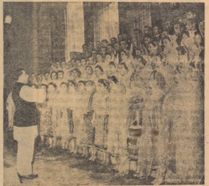
Corul căminului cultural din comuna Brănești, regiunea Ploiești.

coriști. Așa s-a născut la Poiana cursul de inițiere muzicală. N-a fost de loc ușor. Cu vremea, renumiții coriști din Poiana au început să înțeleagă tainele notelor și portativelor, urcînd astfel încă o treaptă în creșterea măiestriei lor artistice.