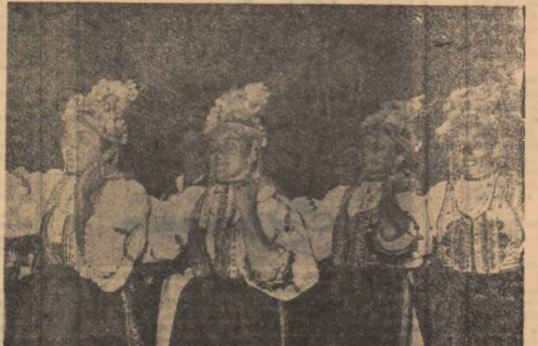
Dansatorii din Ilimbav, regiunea Brașov, au pregătire pentru concurs o suită de jocuri locale. În chipu: aspect din frumosul joc „Partata“.