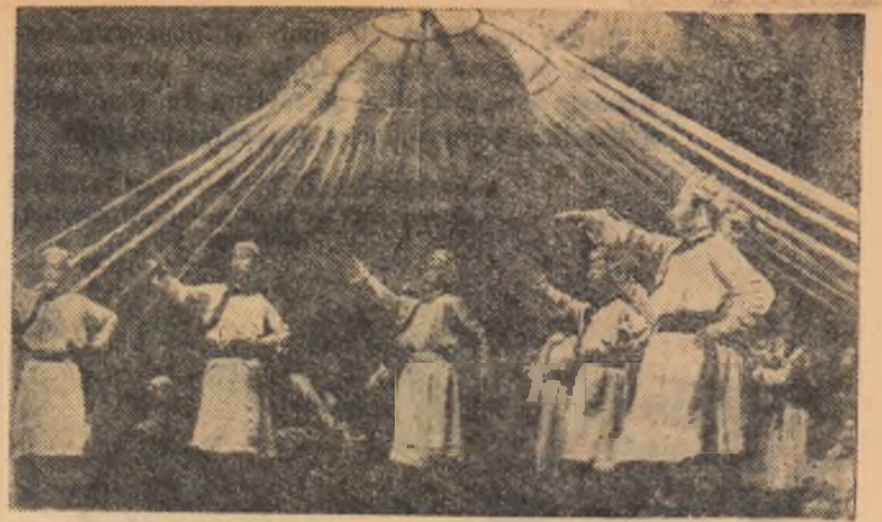
Dans național mongol interpretat de artiștii Teatrului muzical dramatic mongol din Ulan-Bator

Poporul din Coreea de Sud nu se poate aștepta la vreo schimbare în bine a situației în urma înlocuirii guvernului Tian Do Hen prin acela condus de generalul Pak Cijan Hi. Acesta din urmă nu-i cu nimic mai bun ca predecesorul său. Dimpotrivă, după cîte arată agenția France Presse, ar fi chiar mai fanatic și fără îndoială că el se va strădui și mai mult să fie pe placul stăpînilor săi americani.