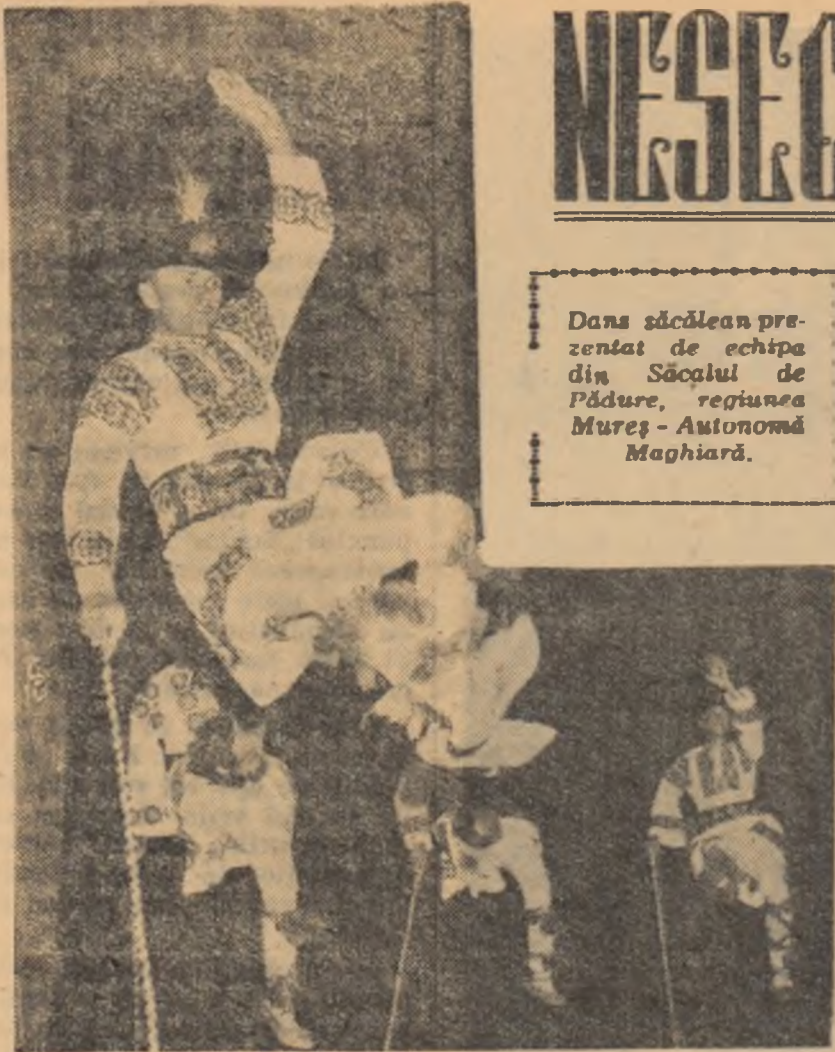
Dans săcălean prezentat de echipa din Săcălu de Pădure, regiunea Mureș - Autonomă Maghiară.