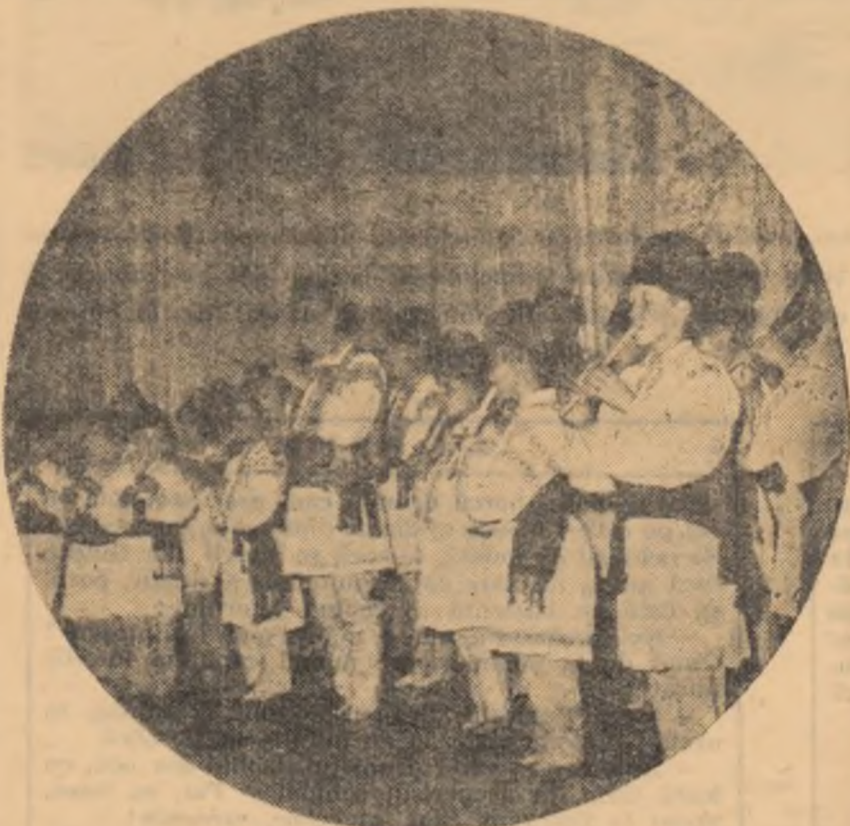
Cunoscuta formație de fluiere și cavale a căminului cultural din Cătina, regiunea Ploiești.