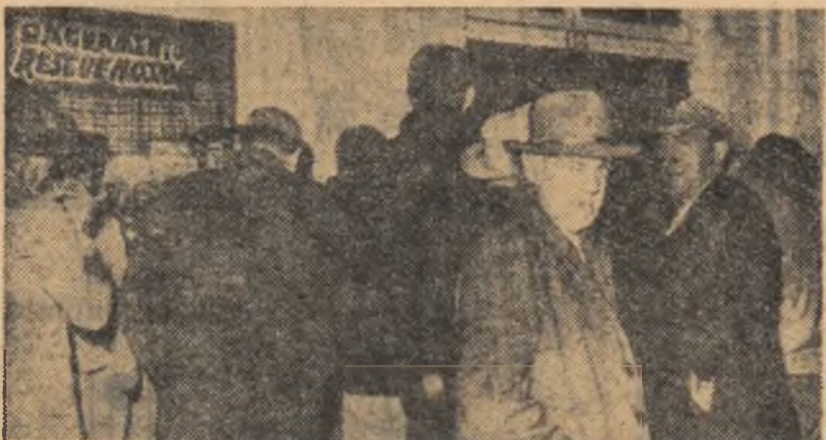
Milioane de muncitori agricoli din S.U.A., trăiesc astăzi în condiții tot atît de grele ca și în timpul marii crize din 1930. În fotografie: muncitori agricoli fără de lucru, gata să primească orice muncă și cu orice plată.