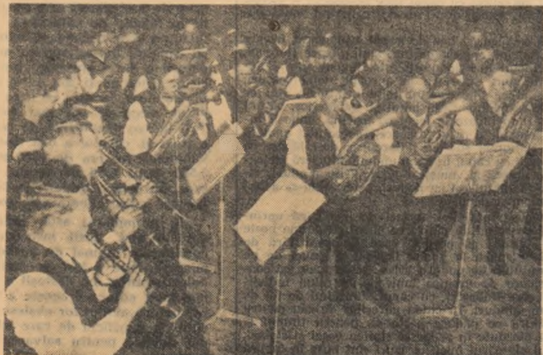
„Mareș pămînt al patriei iubite“ — a fost unul din cîntecele interpretate de fanfara din comuna Apoldul de Sus, regiunea Hunedoara.