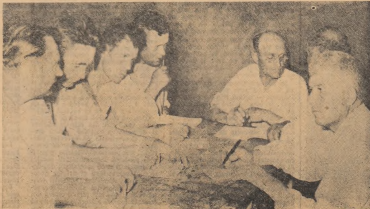
E seară. La sedința gospodăriei se alocuiește planul de lucru pentru a doua zi.

Din datele prezentate reiese că în acest an veniturile realizate din sporirea șeptelului vor marca o creștere cu de peste patru ori față de anul trecut. Mai trebuie adăugat că gospodăria colectivă „Unirea“ va realiza anul acesta aproape un milion de lei din sectorul viticol și alte sute de mii de lei din cultivarea plantelor tehnice și medicinale.