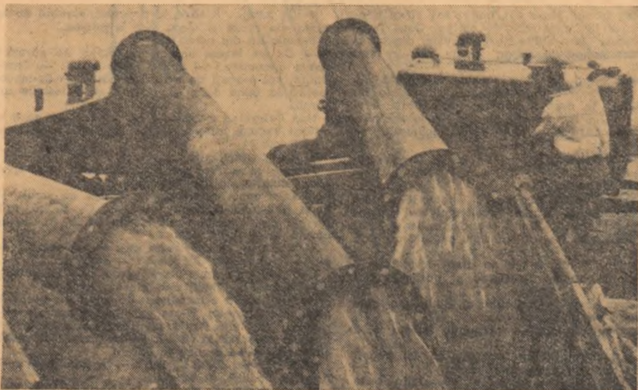
Motopompele în plină acțiune. Pe conductele de 12 țoli apa se îndreaptă în neînterupt șuvoi spre culturile irigate