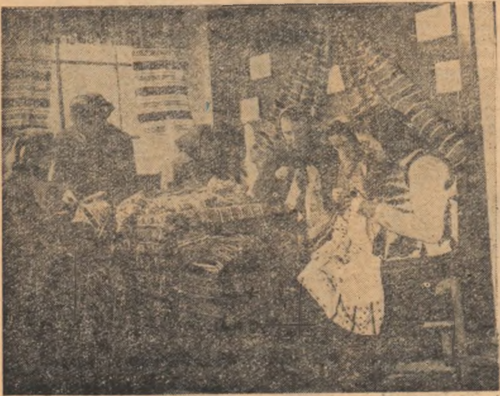
La cooperativa „Arta casnică” din Tismana-Oltenia, se execută țesături cu motive românești, costume naționale și covoare