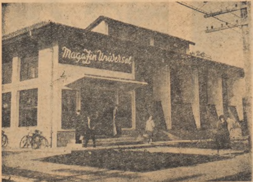
Magazinul universal din comuna Filiaș, regiunea Oltenia, a fost construit prin munca patriotică și contribuția bănească a cetățenilor

tuare, grădinile care egalează arta flori-horticulturului, temcuielile în culori pastel, vesele și odihnitoare, toate acestea încîntă ochiul și vorbesc mai presus de orice despre bunul gust înflorit în grădina bunăstării.