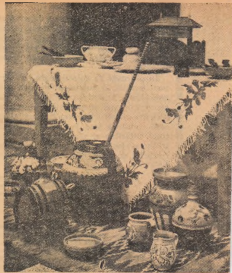
Un colț al expoziției de artă populară de la Palatul din Pitești

Lîngă Cluj, la Bonțida, colectivității români și maghiari, odinioară argați la groși, și-au ridicat un asemenea cartier, că nu știi ce locuință să admiri mai întâi. Ulițele cu tro-