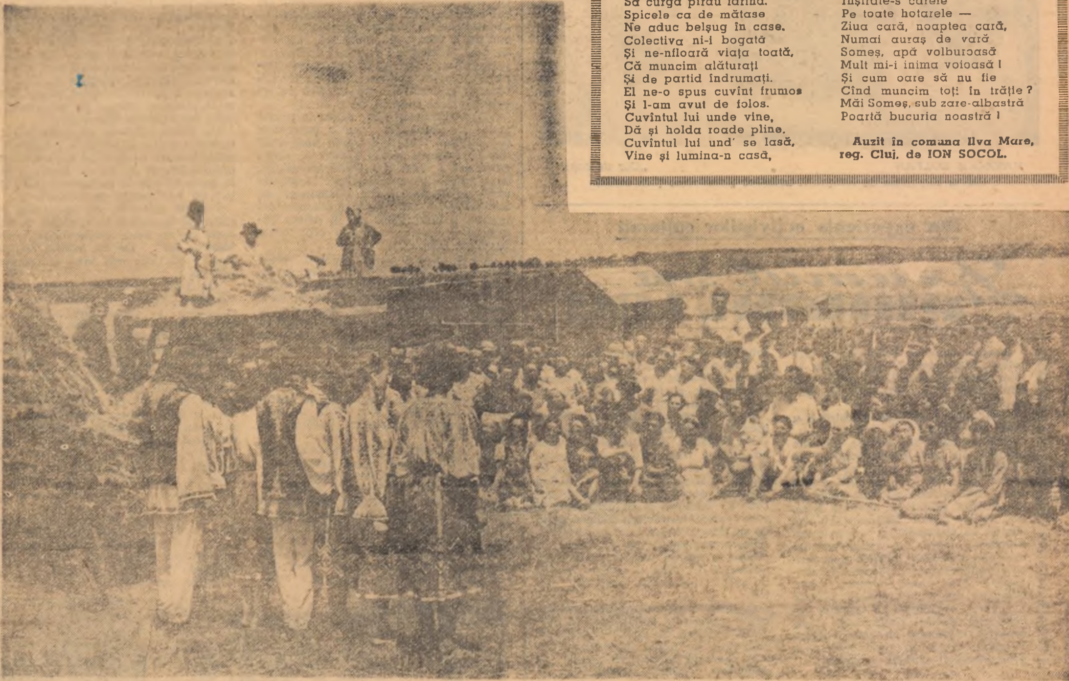
Treierişul e în toi. Stringerea la timp și fără pierderi a recoltei a mobilizat la arde întreaga forță de lucru a satului. Aici și-a mutat în aceste zile scena și căminul cultural din Lehliu, regiunea București. Brigada artistică de agitație a căminului cultural prezintă, în pauze, programe scurte și atrăgătoare, inspirate din munca de treieriş. Iată-o evoluând în fața colectivităților din Lehliu.

Anul 63 • Seria II • Nr. 708 • Miercuri 19 iulie 1961 • 8 pagini — 15 bani