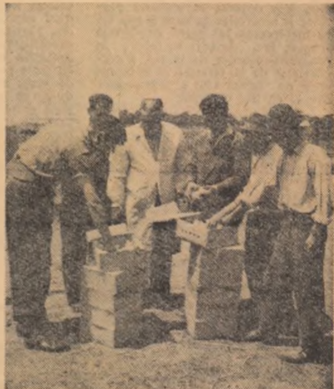
La gospodărie a sosit primul lot de 800 puș comandați la centrul avicol Craiova