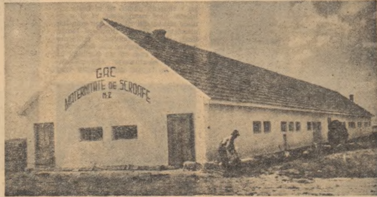
Una din construcțiile zootehnice ale gospodăriei colective din Zăbrani, raionul Lipova.

Alte gospodării, însă, nu au asigurat condițiile necesare începerii și terminării lucrărilor