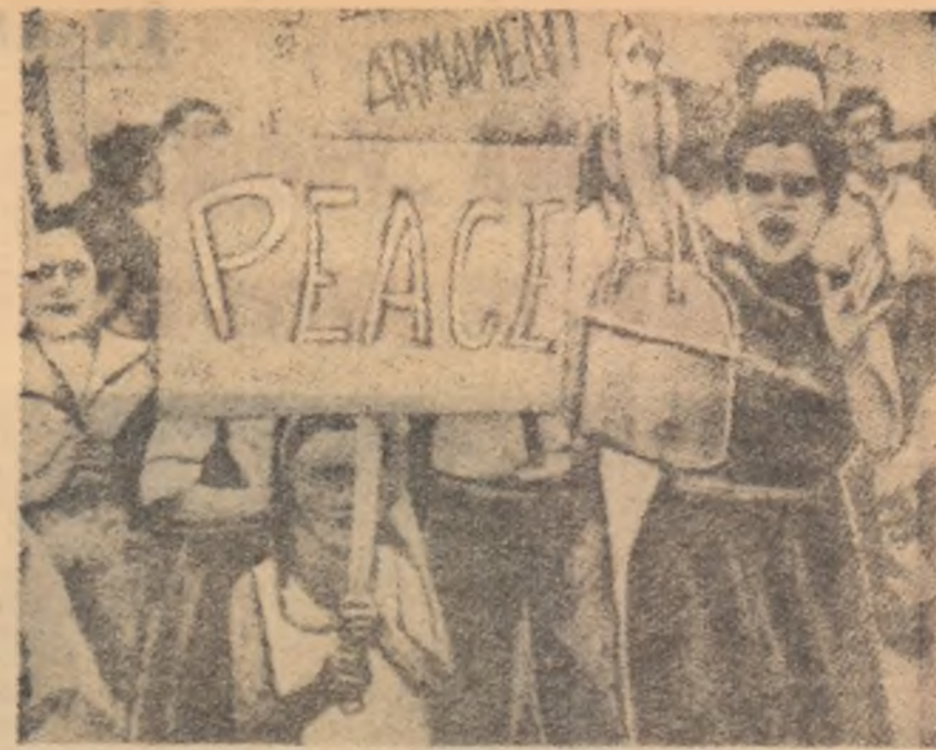
În S.U.A. sînt tot mai frecvente demonstrațiile diferitelor categorii de cetățeni în favoarea dezarmării și păcii. Clișeul nostru redă un aspect de la o asemenea manifestație.

● Reprezentantul grupului țărilor afro-asiatice și reprezentant permanent ad-interim al Guineei la O.N.U., reprezentantul permanent al Tunisiei, reprezentantul permanent al Cehoslovaciei și reprezentantul ad-interim al U.R.S.S. la O.N.U. au vizitat secretariatul O.N.U. și au depus o declarație în care se cere convocarea cit mai grabnică a unei sesiuni extraordinare a Adunării Generale a O.N.U. pentru discutarea situației amenințătoare care s-a creat în Tunisia.