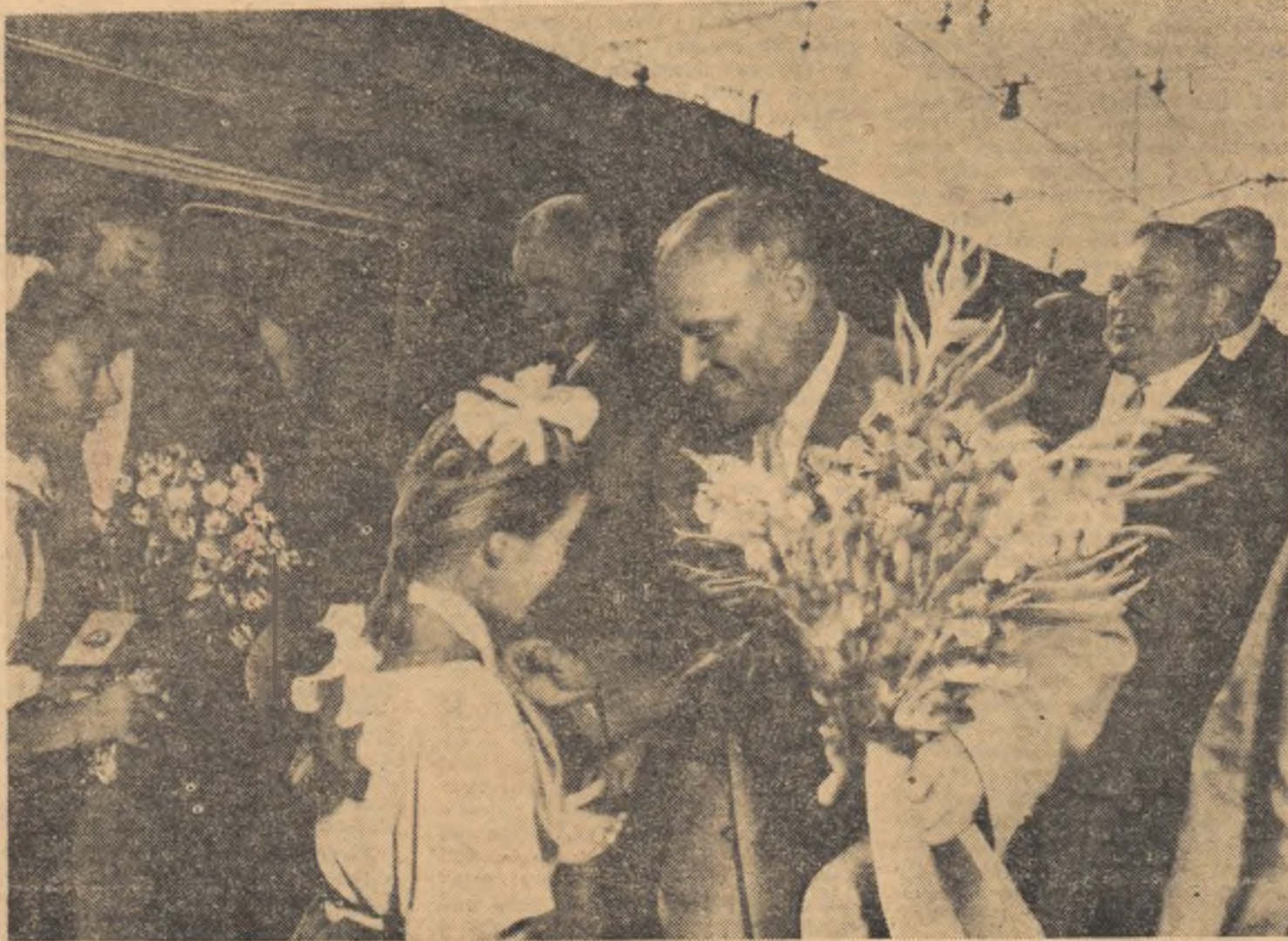
La sosirea în gara din Leningrad

Nava cosmică „VOSTOK - 2“ pilotată de maiorul sovietic Gherman Titov a efectuat cu succes un zbor de unghă durată în jurul Pământului.