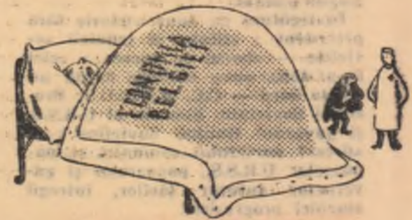
— Dropică? — Nu Piața comună...

Ca urmare a aderării Belgiei la Piața comună, economia ei trece prin mari greutăți.