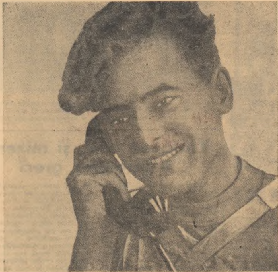
După înapoierea pe pământ, maiorul G. Titov vorbește la telefon cu N. S. Hrușciov.

Pilotul cosmonaut, maiorul Gherman Stepanovici Titov, s-a născut în anul 1935 în satul Verhnee Jilino, raionul Kosiha, ținutul Altai, în familia unui învățător. El este de naționalitate rusă.