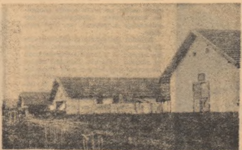
O parte din grajdurile de vite ale g.a.c. din comuna Săveni, raionul Fetești.