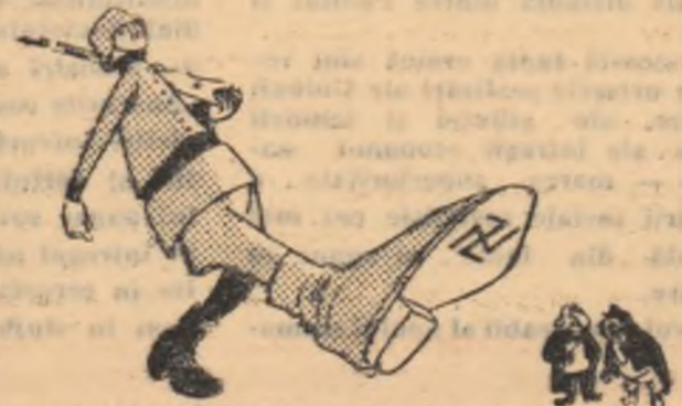
— Prin urmare John, visul lui Hitler tot s-a împlini...

Revanșarii de la Bonn au obținut baze de instrucție pe teritoriul Anghiei.