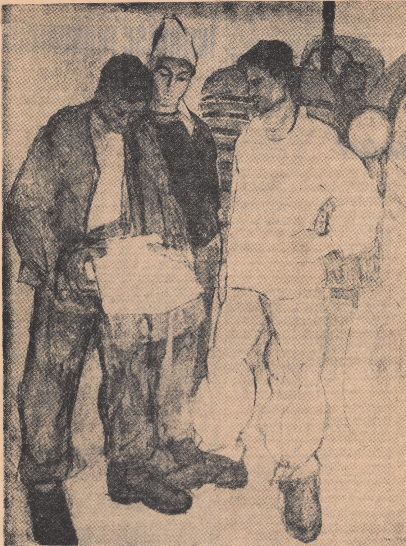
MARIN STATE, elev. — In campania de toamnă. (Pictură în ulei, premiul I. De la a III-a Expoziție republicană de artă plastică a artiștilor amatori)