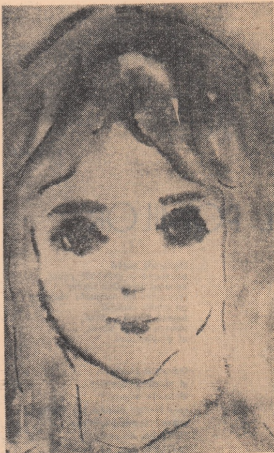
ELENA AFLORI. — Fetiță. (Acuarelă. — De la a III-a Expoziție republicană de artă plastică a artiștilor amatori).

Acest lucru se vedește și în Expoziția republicană de artă plastică a artiștilor amatori. Străduința lor de a înfățișa bogata realitate a zilelor noastre, efortul de a învăța de la marii maeștri ai penelului și daltei este apreciat așa cum se cuvine de numeroșii vizitatori ai expoziției.