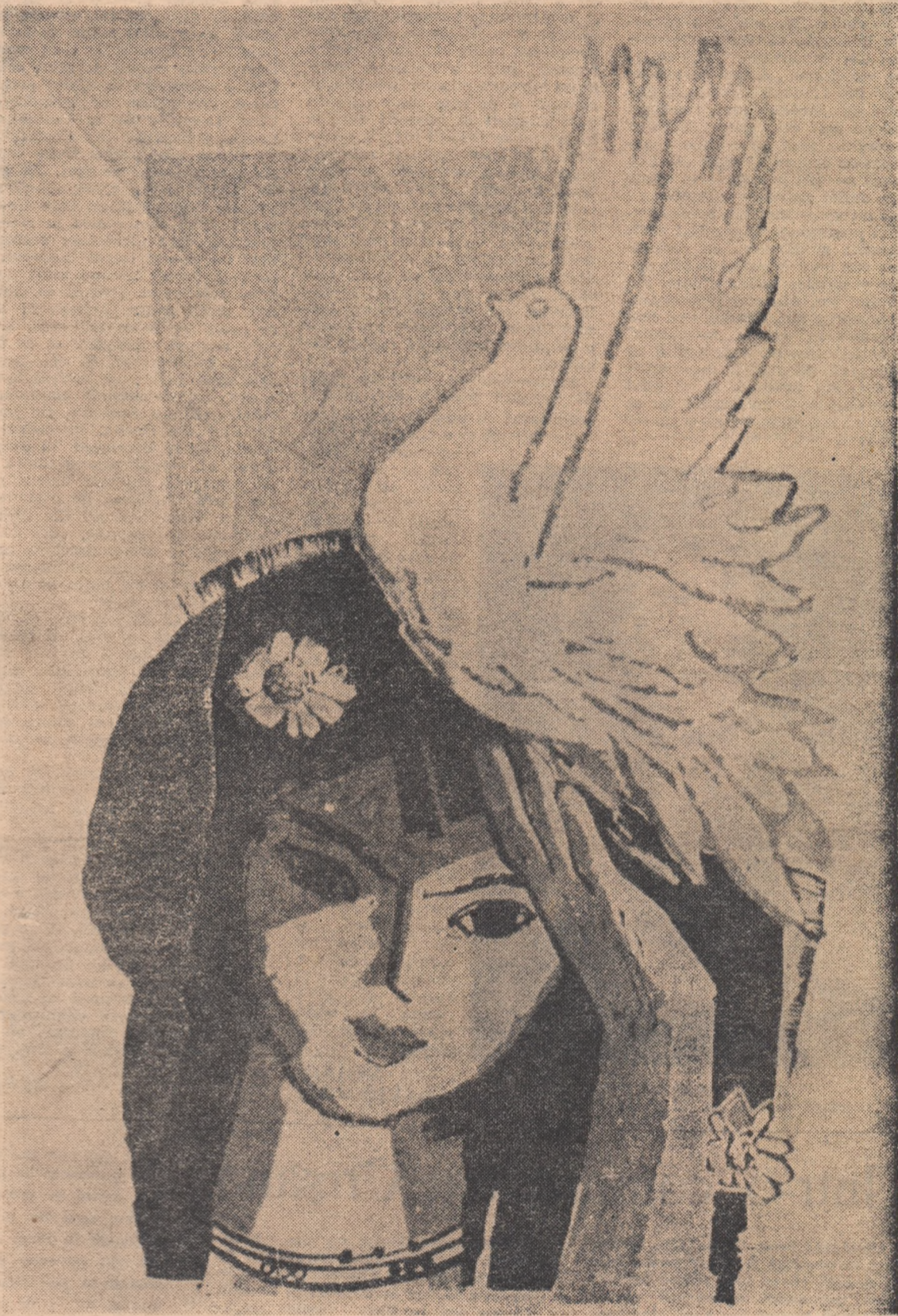
Pace — Roni Noel (Linogravură în culori — De la Expoziția anuală de artă plastică)

Vă urăm La mulți ani iubiți tovarăși și prieteni!