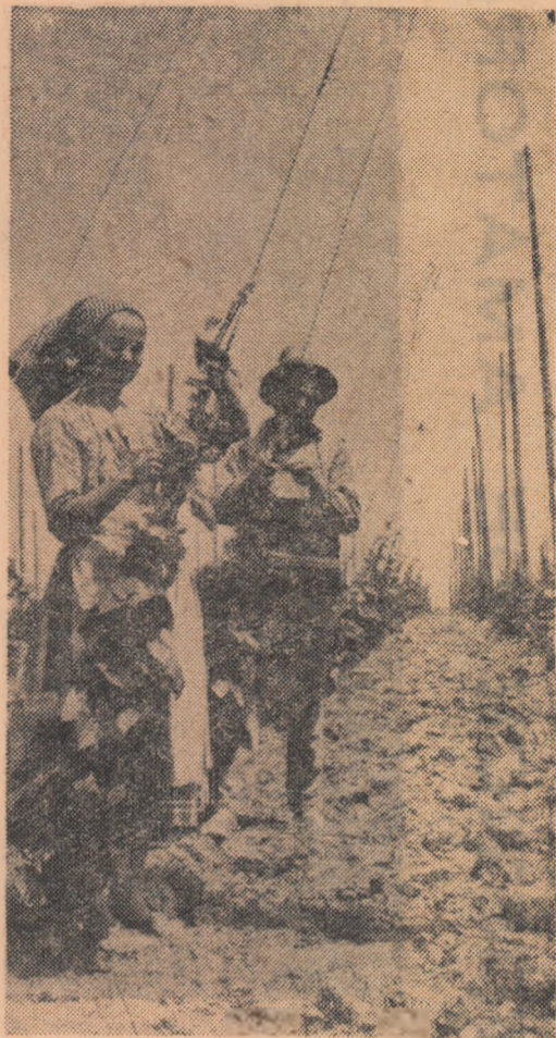
Legarea portaltoilor de viță în piramide la Stațiunea experimentală Argeș.

Consider rubrica de față cît se poate de interesantă și aștept cu curiozitate să-și înscrie aici cît mai mulți părerile.