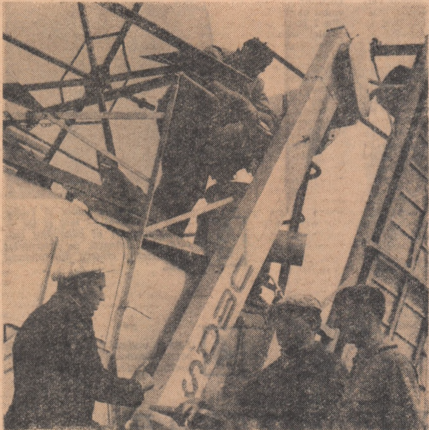
Brigada a 8-a de tractoriști a S.M.T. Arduș, care deservește gospodăria colectivă din Belciug, raionul Satu-Mare, este gata pentru seceriș.