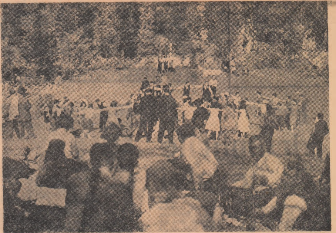
Duminică de odihnă colectivă la Ponoarele, regiunea Oltenia

În această perioadă cînd în fața instituțiilor culturale de la sate stau sarcini multiple, e bine ca ele să beneficieze din plin de o îndrumare permanentă din partea comitetelor raionale de cultură și artă, ca în toate comunele și satele noastre să se desfășoare o bogată activitate culturală, la nivelul cerințelor și posibilităților satului colectivizat.