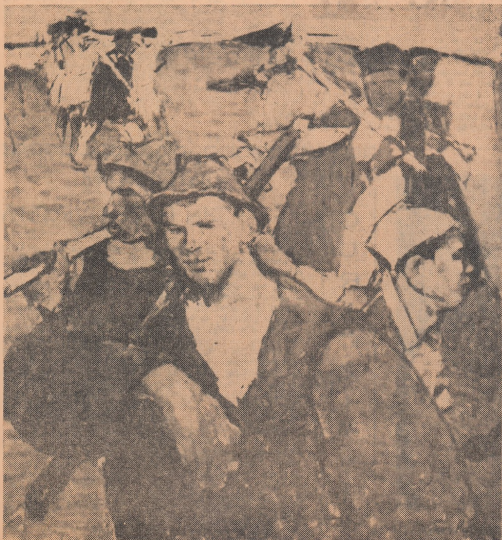
Colectiviști plecînd la lucru (pictură ulei)

Auzit în comuna Tetoiu, regiunea Oltenia, de ION SOCOL.