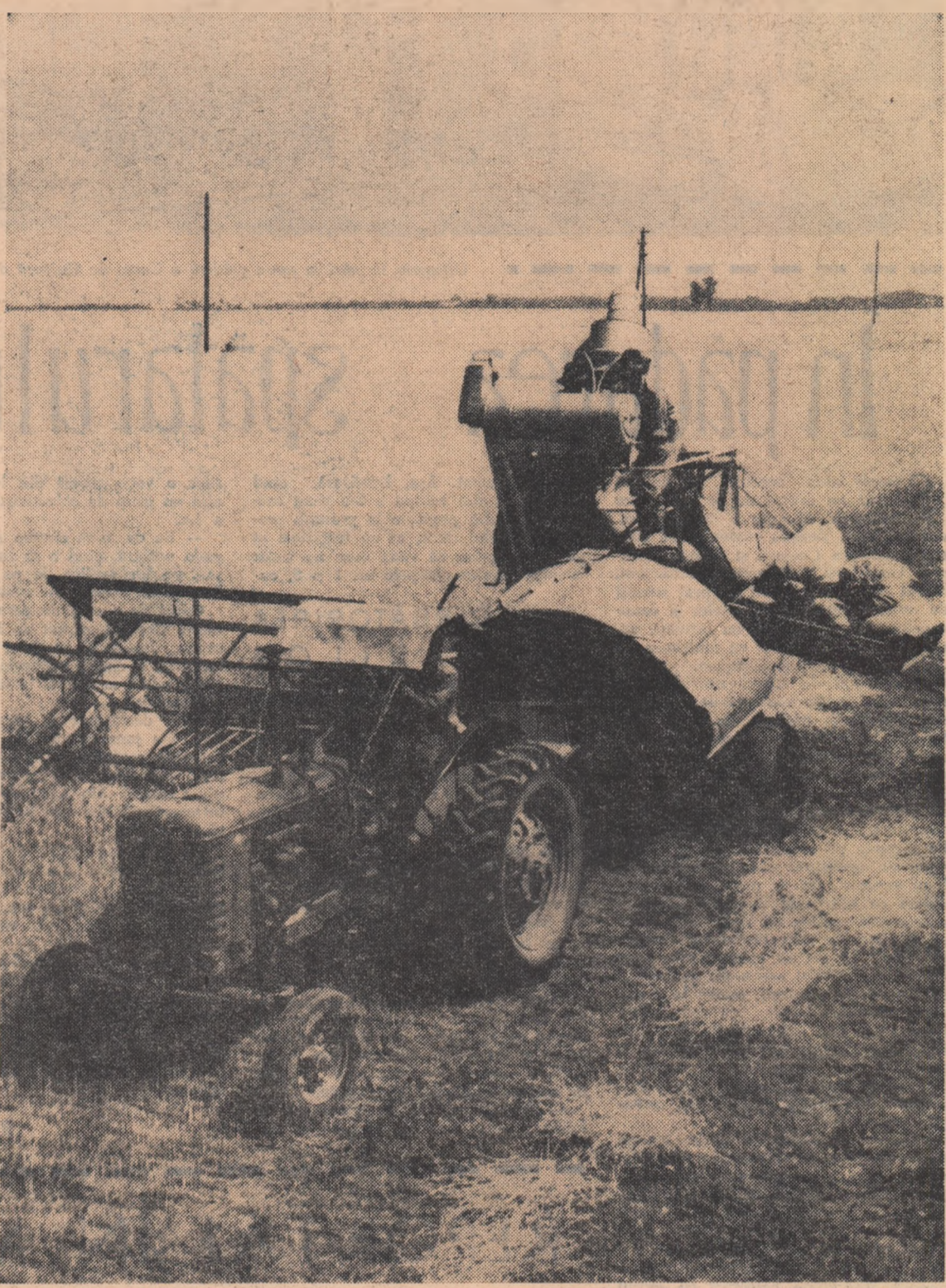
Pe întinsele tarlale cu grâu ale colectivităților din Mihăilești, raionul Drăgănești-Vlașca, au apărut combinele.

Dar viața cultural-artistică a orașelor și satelor în timpul verii poate fi îmbogățită și cu alte manifestări artistice. Pe stadionul din Arad s-a prevăzut organizarea unor spectacole muzical-coreografice de mare amploare. În regiunea Mureș-Autonomă Maghiară se organizează serbări cimpenești, cu participarea oamenilor muncii de la orașe și din diferite sate, cu care prilej se prezintă spectacole ale formațiilor de amatori, jocuri sportive etc. De asemenea, se pot organiza pe loc întreceri ale celor mai buni cântăreți vocali și instrumentiști din rîndul participanților la manifestările respective care, pe lângă caracterul stimulant, oferă și momente plăcute și distractive.