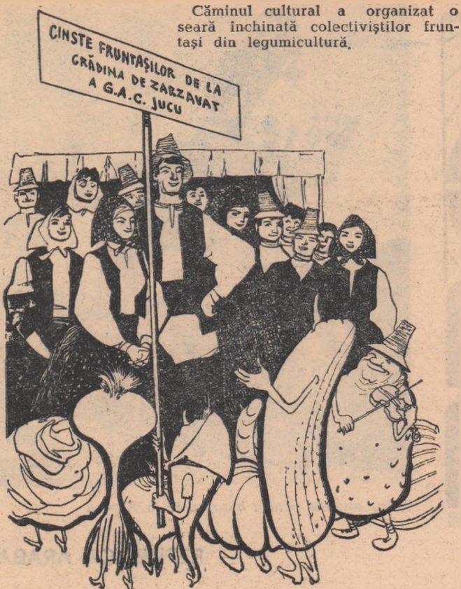
LEGUMELE: — Vă mulțumim pentru îngrijire și bună creștere!