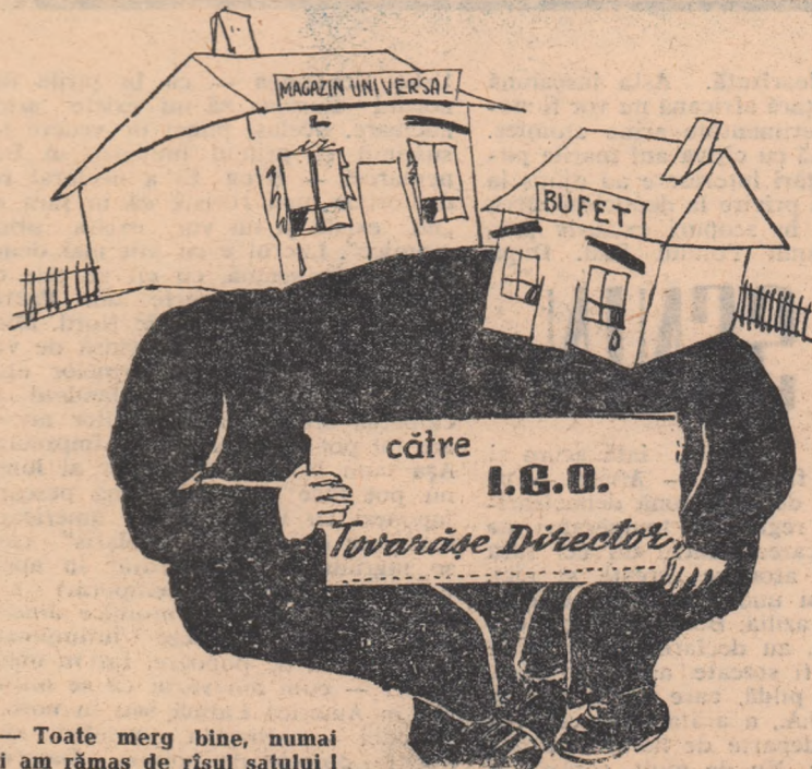
— Toate merg bine, numai noi am rămas de risul satului!

Din neglijența întreprinderii de gospodărie orășenească, magazinul universal are vitrinele deteriorate și fațada nevăruită, iar bufetului îi lipsește o parte din mobilier.