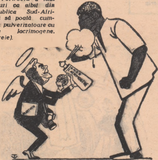
VERWOERD: — E o măsură umanitară, știut fiind că lacrimile... usurează!

Guvernul rasist al lui Verwoerd a luat măsuri ca albi din Republica Sud-Africană să poată cumpăra pulverizatoare cu gaze lacrimogene. (Ziarele).