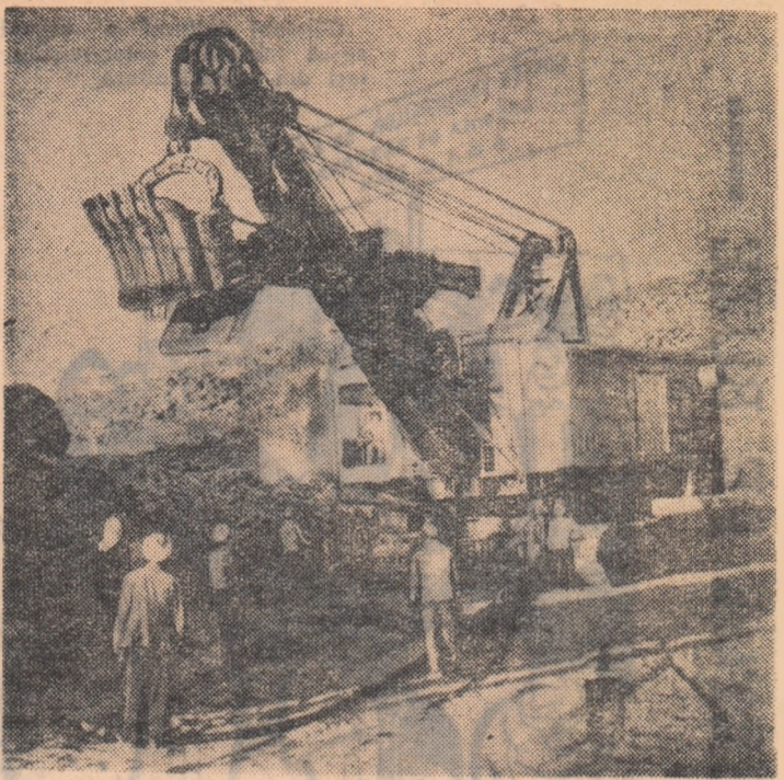
Utilaj sovietic pentru barajul de la Assuan