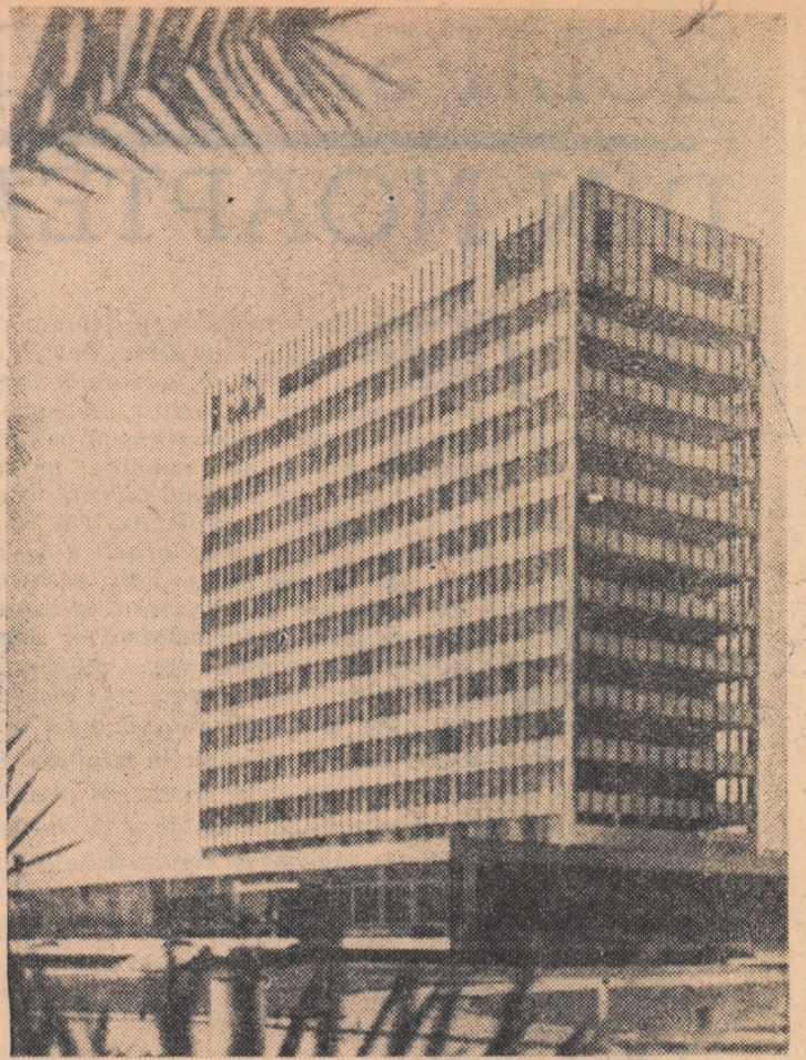
Hotel Perla din Mamaia