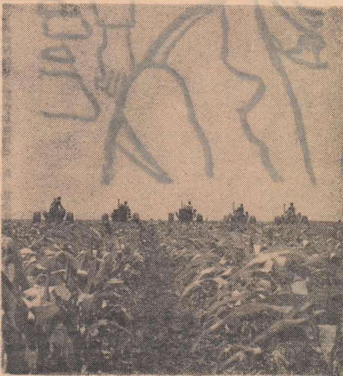
Prașila a treia a culturii de porumb la G.A.S. Belciugatele, raionul Lehliu.

Întrebîndu-l pe președinte dacă pe alocuri se recoltează și manual, am aflat că în această parte a Bărăganului s-au demodat nu numai secera, ci și secerătorile-legători. Reprezentative sînt acum „pășările argintii”, combinele C-1.