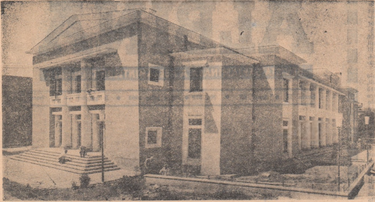
Ultimele finisări la noua clădire a Casei de Cultură din Cimpina.