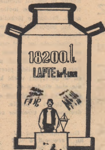
Omul și faptele sale!

După relatările coresp. Vasile Pețean, comuna Jucu, raionul Gherla.