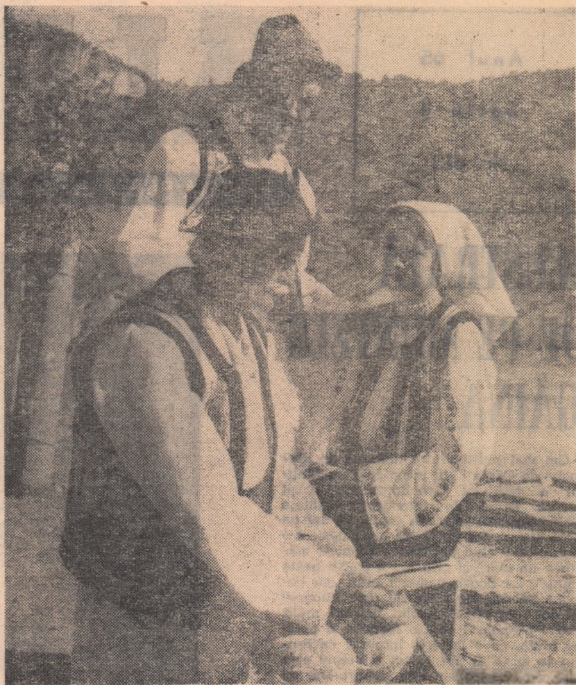
Port național din Bicazul ardeleanesc

În raionul Sf. Gheorghe există toate condițiile pentru ca manifestările cultural-artistice în aer liber să aibă programe mai variate și un conținut mai bogat, să prilejuiască o odihnă plăcută și să contribuie mai din plin la îmbogățirea cunoștințelor cultural-științifice ale oamenilor muncii de la sate.