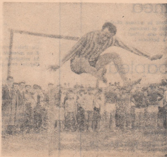
Săritura în înălțime a captat atenția spectatorilor din Stoicănești.

Etapa a VI-a, finală, inter-regiuni, care se va desfășura între 22 și 30 septembrie. Această etapă se va desfășura după următorul program: în regiunea Maramureș se vor întîlni campionii regiunilor Cluj, Crișana Banat și Maramureș; în regiunea Hunedoara își vor disputa înțietatea reprezentanții regiunilor București, Argeș, Oltenia și Hunedoara; în regiunea Ploiești se întîlnesc campionii regiunilor Dobrogea, Galați Brașov și Ploiești, iar în regiunea Iași se vor întîlni cei mai buni sportivi din regiunile Suceava, Bacău, Mureș-Autozomă Maghiară și Iași.