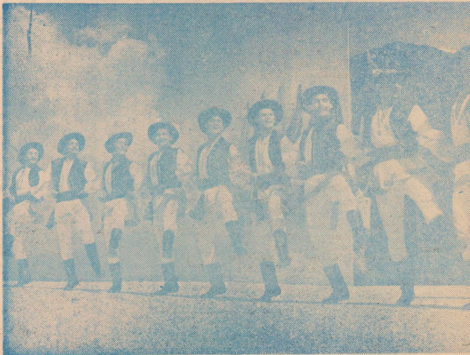
Dansatori din Ansamblul Ciocîrlia, prezentînd o suită de dansuri

Oricît de nesuferită îi era veci- Mitrache o rugă să se uite o clipă sa. Alergă la căruță, luă găleata, f- și se-ntoarse răsufînd greu. Dădu parte și începu să stropească lăzile înapoi spre tonetă. Mai avea vreo z- acolo. S-a oprit în loc, nici el n- Parcă-i lipsea ceva. S-a răsucit, a f- înapoi spre căruță, iarăși vreo do- dacă l-ar fi văzut cineva învîrtîndu- fi crezut cu siguranță, că „a dat în se scutură numaidecît de acest g-