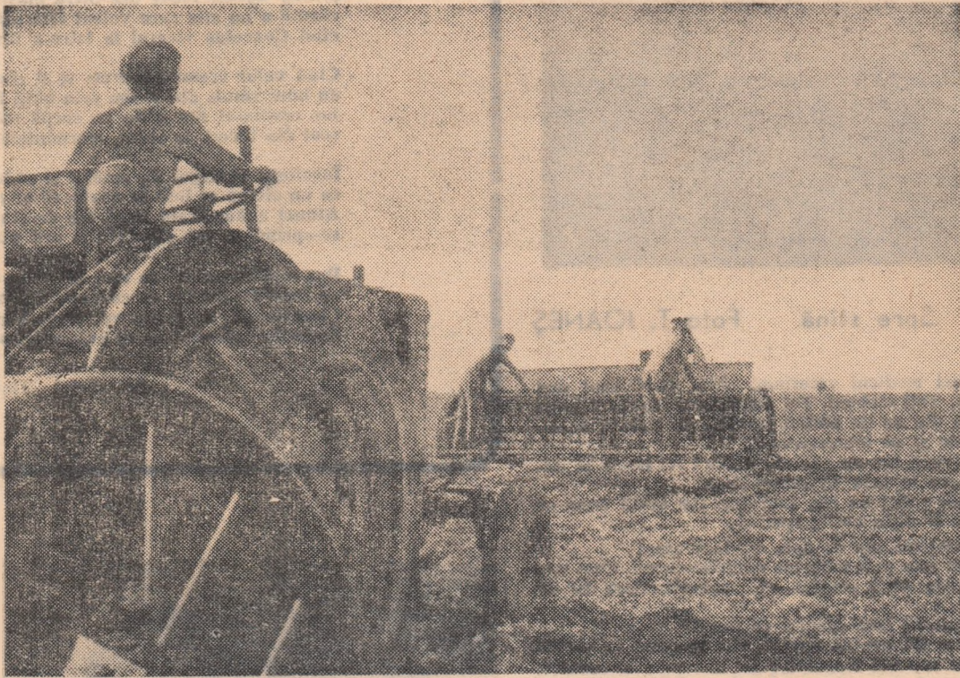
Colectiviștii de la G.A.C. „Progresul” din Făcăeni, raionul Fețești, au început însămînțările de toamnă. Iată un aspect de la însămînțarea secarei.