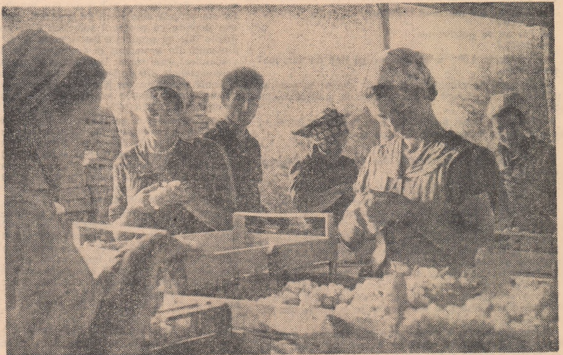
Cizelarea strugurilor de masă la G.A.S. Murtal, regiunea Dobrogea.