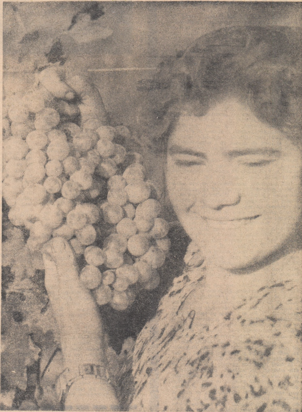
Rod de Toamnă