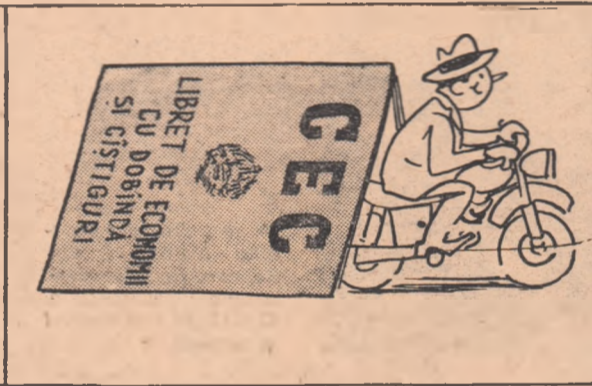
S-a ales și cu o „Jawă”!