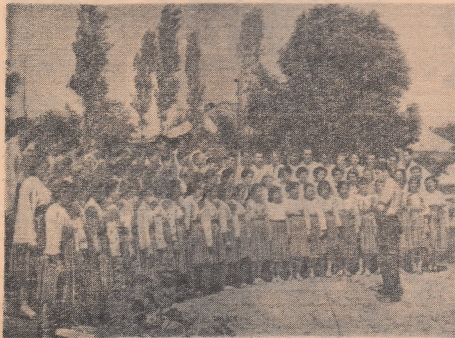
Formația corală a căminului cultural din Dăbuleni, regiunea Oltenia