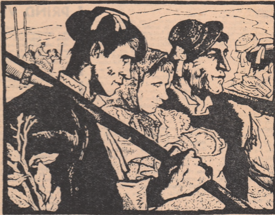
Gheorghe Ivancenco: Viață pașnică (gravură)

Și era o asemenea vioiciune, o astfel de prospețime în felul cum lucra și în tonul cu care răspundea la întrebările celor din jur încît ori cine, moleșit de căldura ceasurilor de pină acum, își revenea brusc și avea privindu-l — senzația că e dimineață.