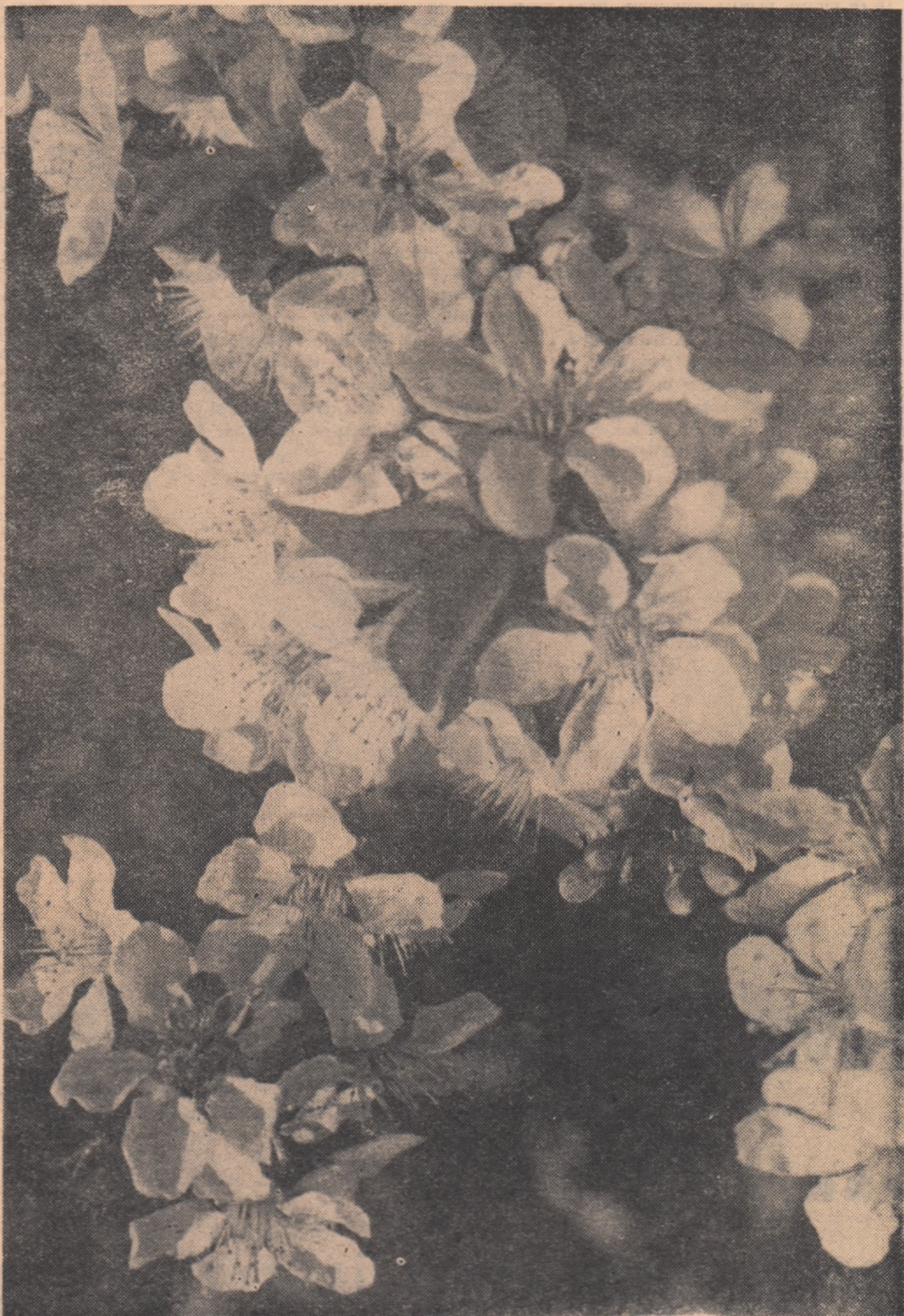
Flori de măr

Să ne grăbim s-o facem. Cu bogăția ogoarelor vom cinsti în acest an marea aniversare a Eliberării Patriei.