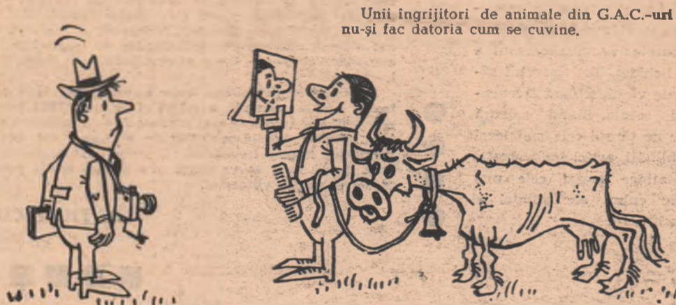
Unii îngrijitori de animale din G.A.C.-url nu-și fac datoria cum se cuvine.

— Cred că arăt bine și puteți să-mi faceți și mie o poză pentru ziar! —