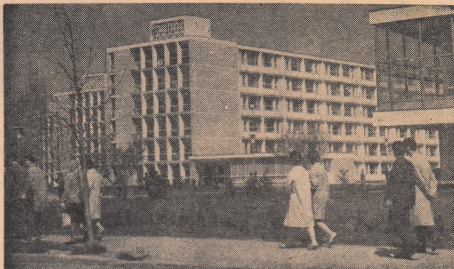
Noi cămine pentru studenți în cartierul Grozăvești — București

aceea se mai numește și Capitală , cuvînt care înseamnă cel mai mare și cel mai important oraș al țării.