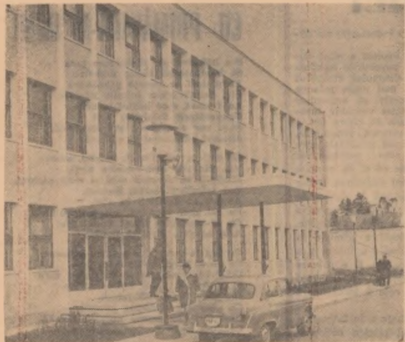
Clădirea noului policlinici din Buzău dată recent în folosință.