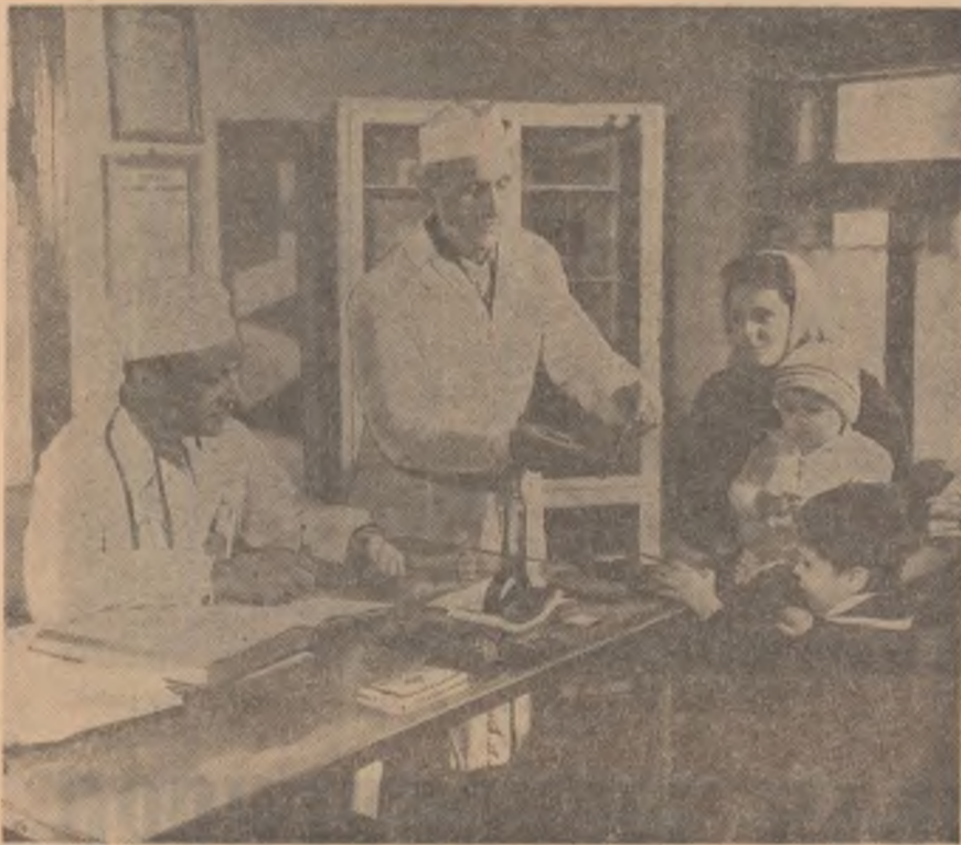
Un aspect de la circumscripția sanitară din comuna Florești, raionul Adjud — vaccinarea antipollomielitică a copiilor.