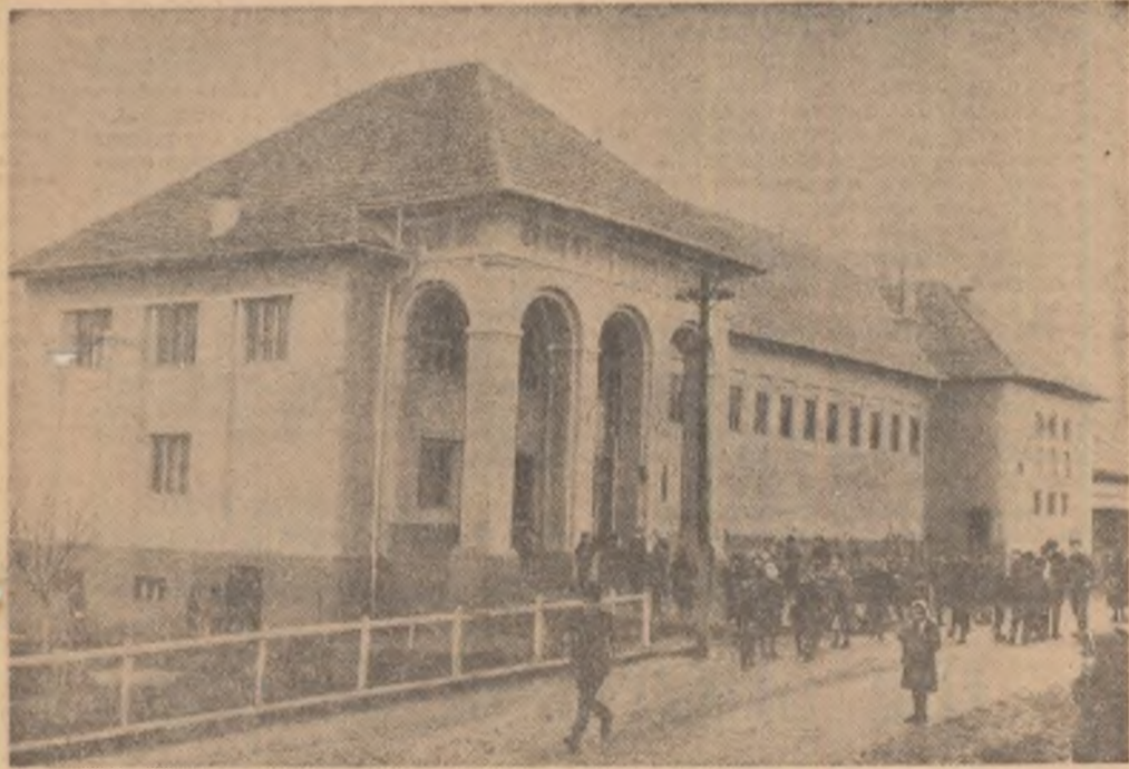
In fața căminului cultural din Dala Romina, regiunea Hunedoara.

Erou al Muncii Socialiste președinte al cooperativei agricole de producție „11 Iunie” din Pechea-Galați