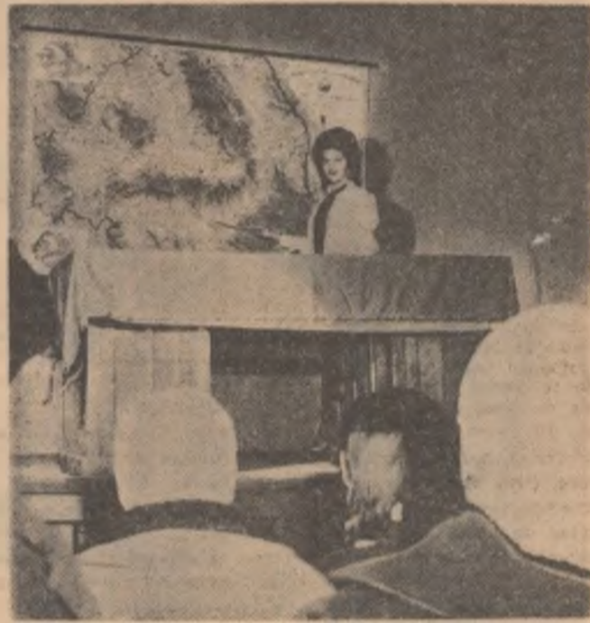
O călătorie imaginară pe hartă la căminul cultural din Căteasca, raionul Pitești