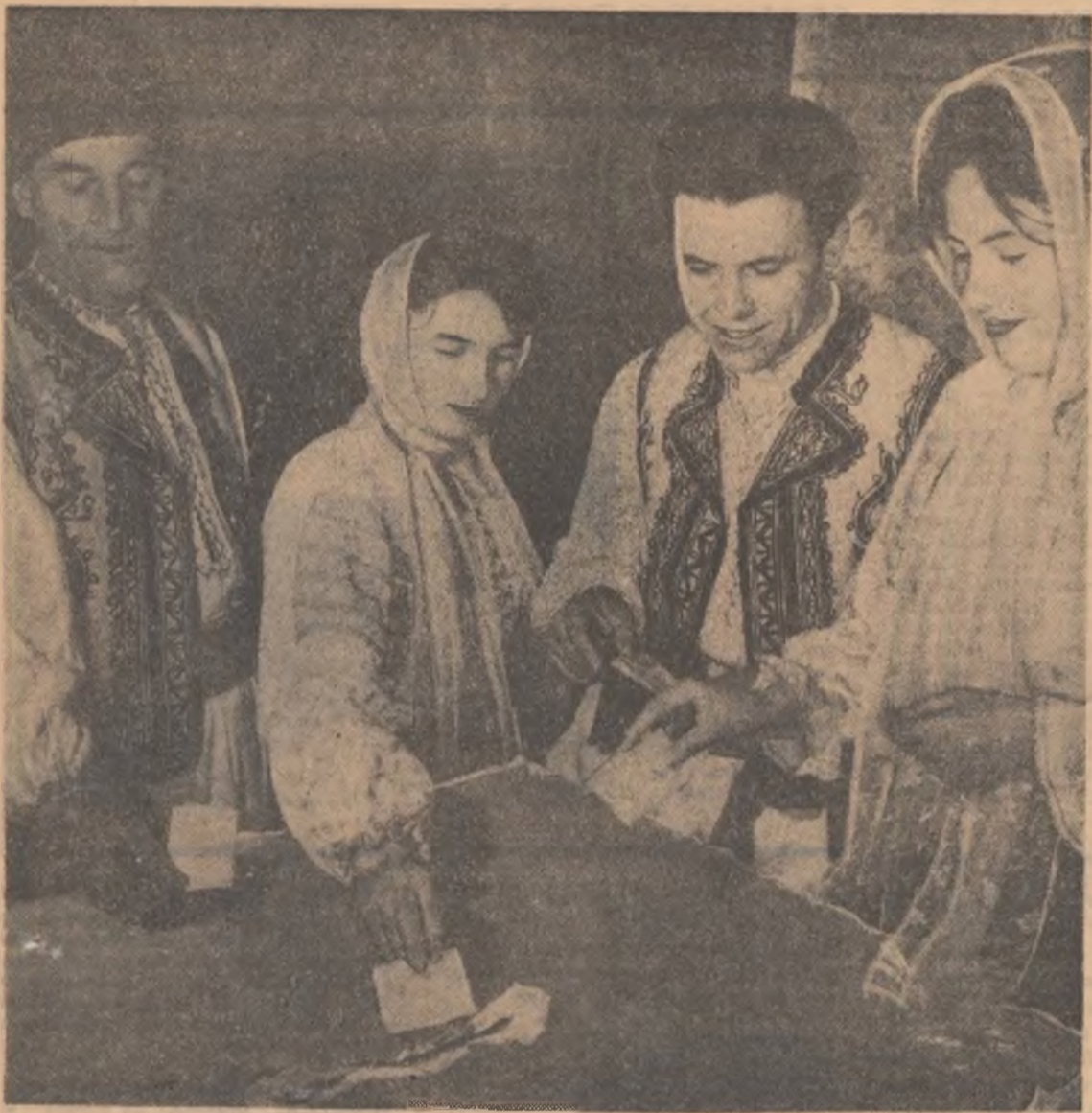
La secția de votare nr. 28 din comuna Grădiștea, raionul Ursiceni

Seria II • Anul 67 • Nr. 898 • Joi 11 martie 1965 • 8 pagini — 25 bani