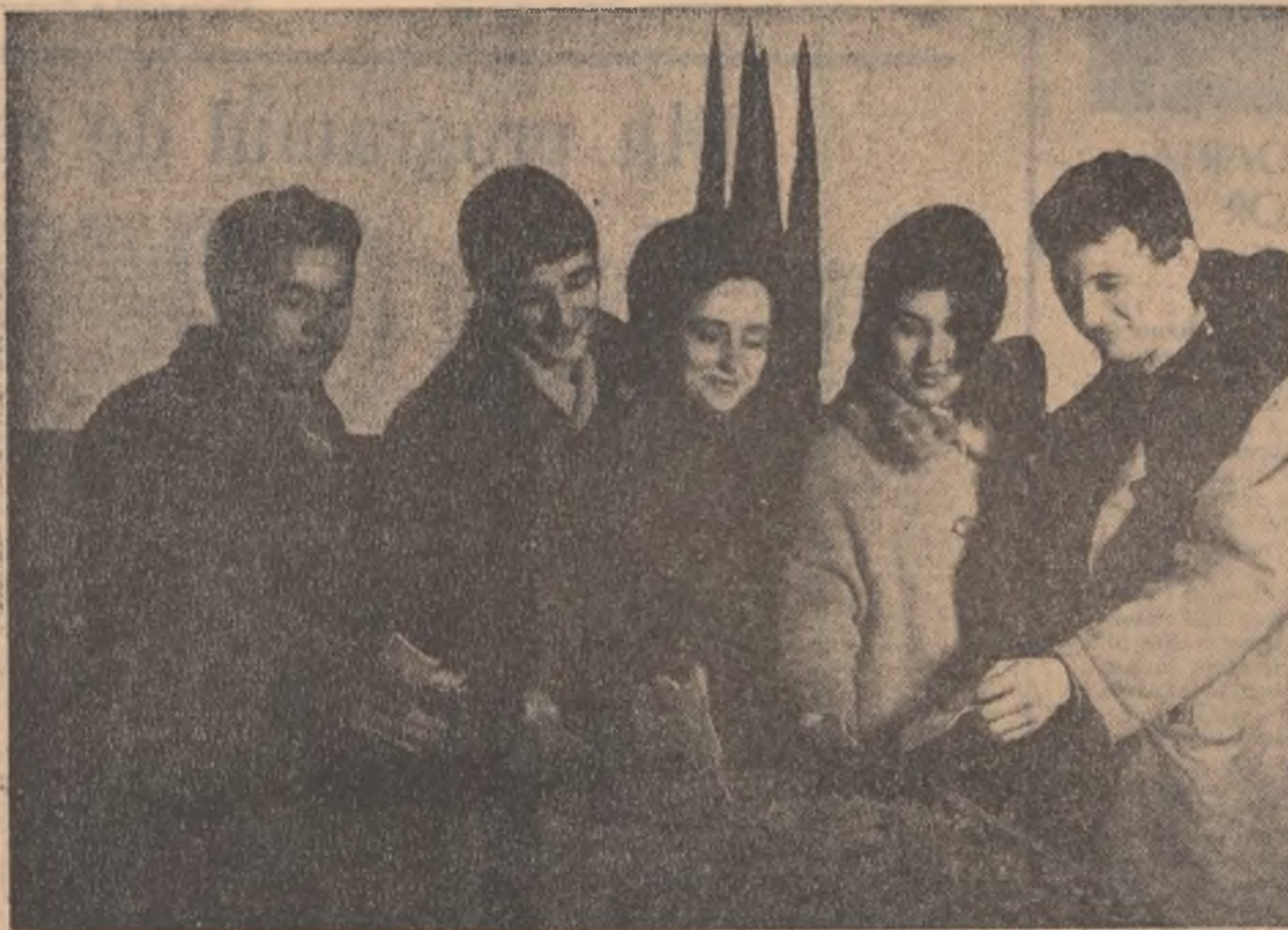
...a votat și muncitorii din Igalnița,