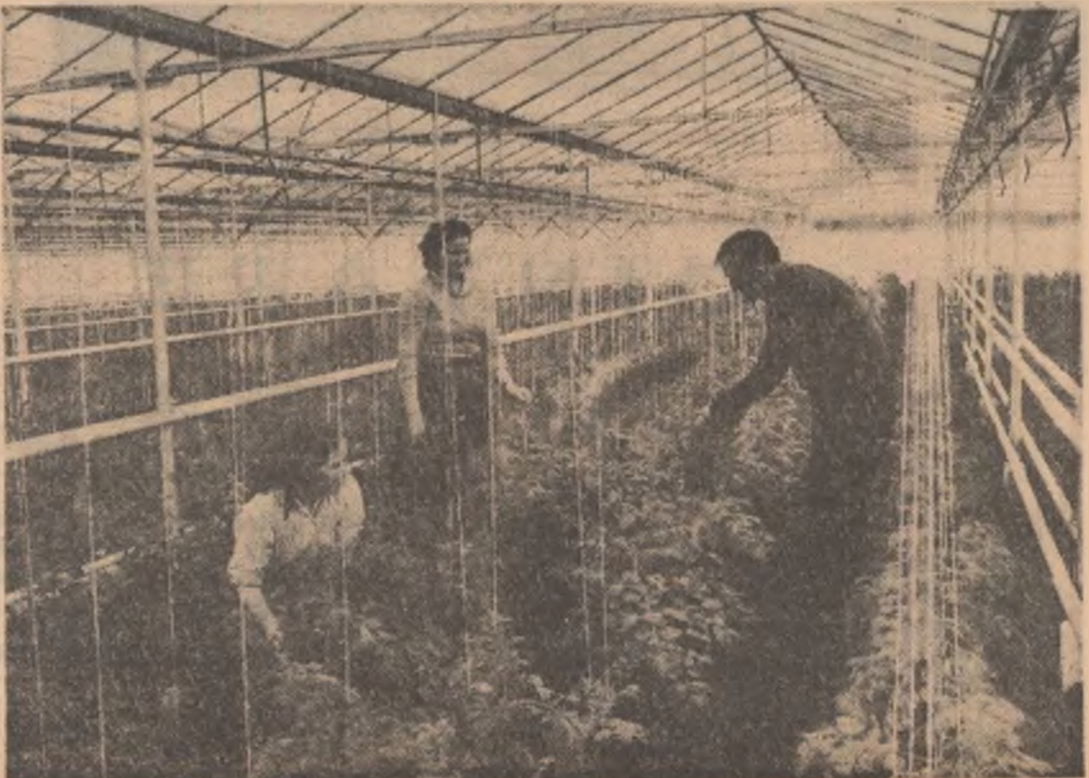
Aspect din noua seră

La prima vedere s-ar părea că este greu pentru un reporter să mai spună ceva nou despre vestita cooperativă agricolă de producție din Sîntana, regiunea Crișana. S-au scris, despre ea, pagini întregi în mai toate revistele și ziarele.