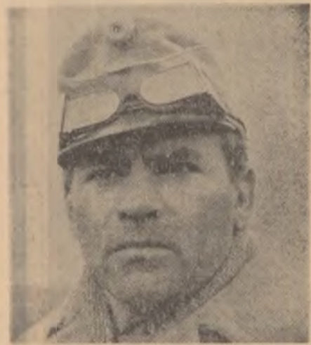
Liviu Ciulei în rolul lui Klapka

Spațiul acestui articol nu ne îngăduie să vorbim despre toată bogăția de idei, despre nenumăratele scene și figuri emotionante cuprinse în film și care ne însoțesc în gînd mult timp după ieșirea din sală. Să mai amintim, fie și pe scurt, acel