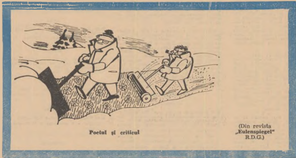
Poetul și criticul