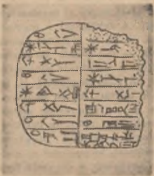
Tăbliță de lut din Ur cu scriere cuneiformă

ale bibliotecii — denumite pinakes — el a întocmit un indice al operelor poezilor și dramaturgilor greci ai epocii, care, păstrat în copii incomplete pînă astăzi, a constituit de-a lungul timpului o prețioasă sursă de informare asupra literaturii Greciei antice.