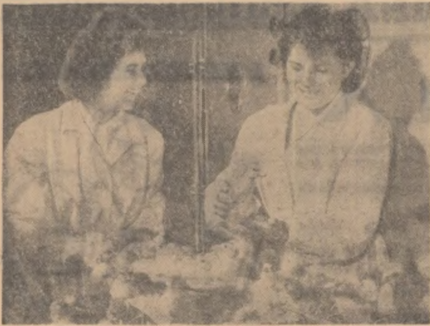
Stația de incubare din Szeged furnizează cooperativele agricole pui, boboci de rață