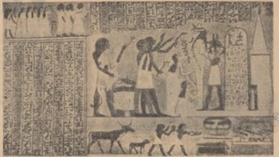
Unul din papirusurile egiptene

Cea mai mare și însemnată bibliotecă a antichității a fost, fără îndoială, cea din Alexandria (Egipt). Înființată în secolul al III-lea î.e.n. de către primii monarhi ai dinastiei Ptolomeilor și avînd menirea de a conserva în cele mai bune copii întreaga literatură greacă de pînă atunci, această bibliotecă s-a îmbogățit continuu prin activitatea organizată a unor caligrafi și prin numeroase achiziții de lucrări, reușind să-și completeze vastele-i colecții și cu traduceri ale operelor literare egiptene și babiloniene. După unele informații, se pare că în anul 47 î.e.n., cînd Cezar a cucerit Alexandria și biblioteca a fost parțial nimicită, ea număra aproximativ 700 000 volume, printre care se găseau 550 de tragedii și peste 1 500 de comedii. În jurul acestei biblioteci s-au grupat o seamă de savanți ai lumii antice grecești, dintre care mai cunoscut rămîne poetul și învățatul Calimah. Pornind de la cataloagele metodice