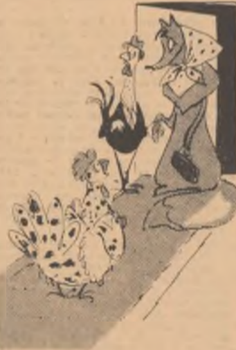
— Mamă, să vă fac cunoștință: ea este logodnica mea... (Din revista „Krokodil”)