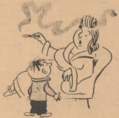
— Să nu-i spui nimic lui tătca!