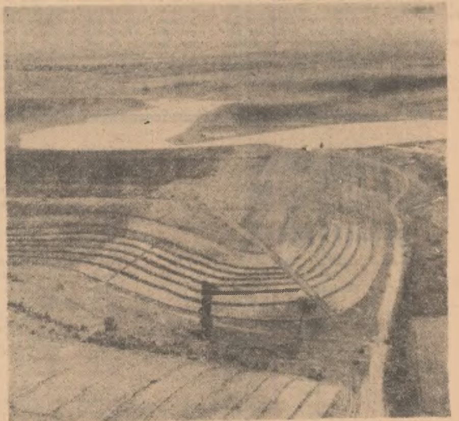
Vedere din avion a teraselor cu vii și a lacului de acumulare de la cooperativa agricolă din Scornicești.

Cules de GEORGE BREAZU, din comuna Leordeni, raionul Găești.