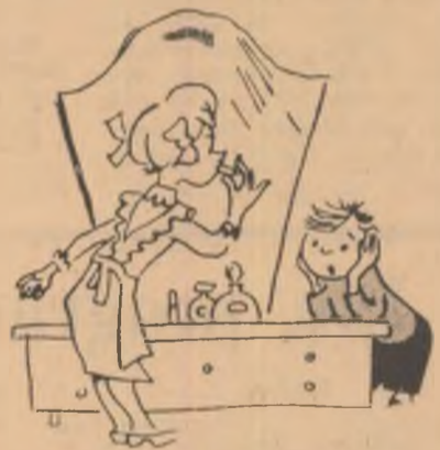
— Să nu-i spui nimic lui tătca și mămică!