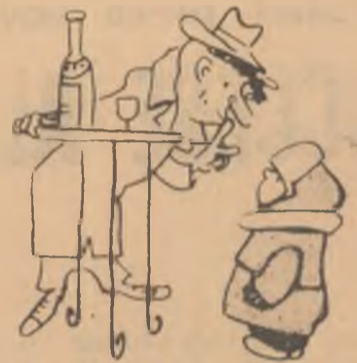
— Să nu-i spui nimic mamei!