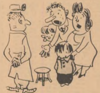
— Doctore, ce-o fi avînd băiatul de nu mai vorbește cu nimeni?... (Din revista „Krokodil”)