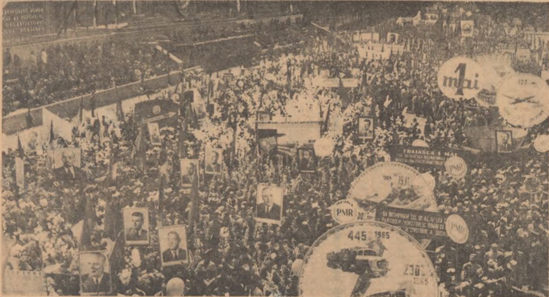
1 Mai 1965. Aspect de la marea demonstrație a oamenilor muncii