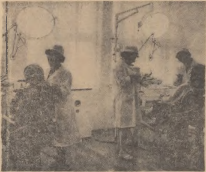
... Statul asigură asistența medicală prin instituțiile sale sanitare... (Din proiectul de Constituție a Republicii Socialiste România)

Constituția e aur, temelie grea, de piatră, lege, cînt și omenie, într-o românească vatră.