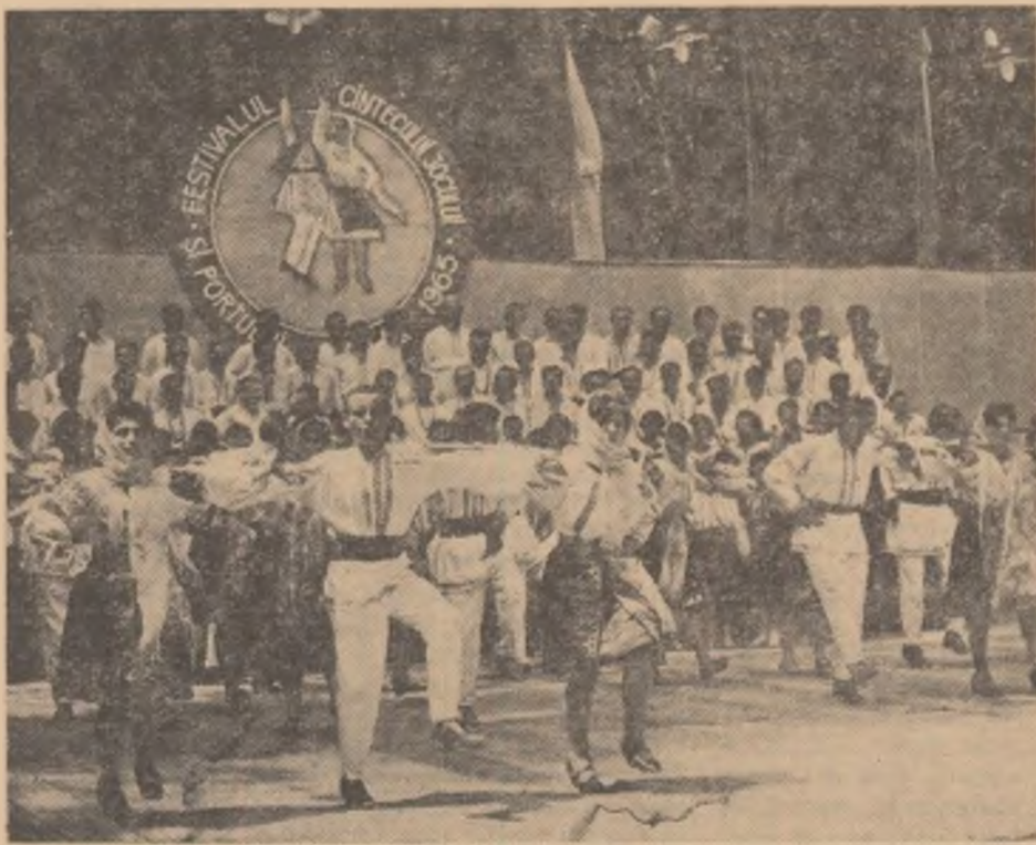
Aspect din spectacolul prezentat de echipa de dansuri a căminului cultural din Dormărunt