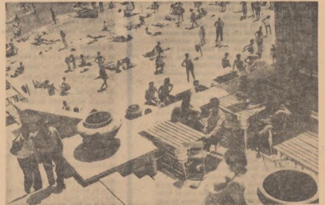
Cetățenii Republicii Socialiste România au dreptul la odihnă (din proiectul de Constituție a Republicii Socialiste România)