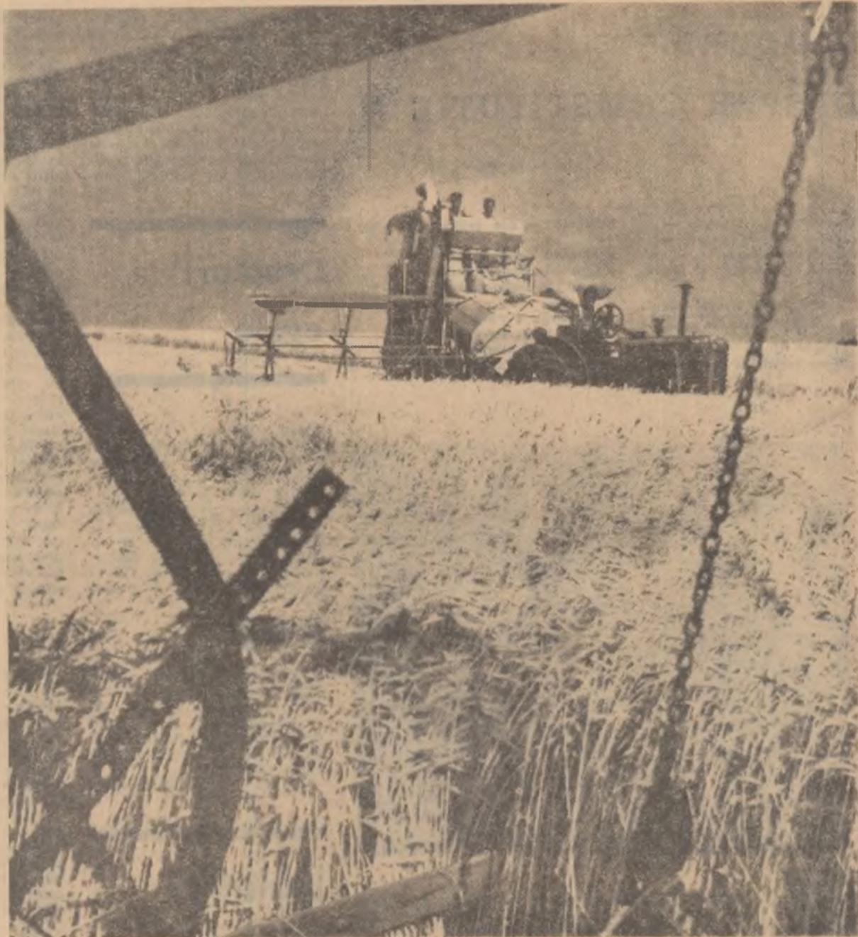
Secerișul grîului pe tarlalele cooperativei agricole de producție din Filipești, regiunea Galați