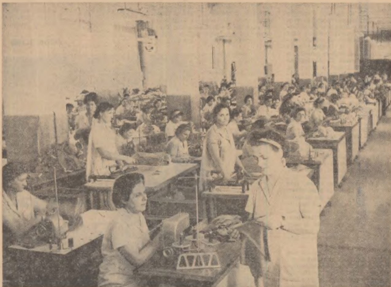
Vedere de ansamblu a secției de confecții din cadrul Fabricii de confecții și tricotaaje București

Există o industrie a îmbrăcăminții care își etalează puterea, belșugul și gustul frumosului în toate vitrinele țării: de la marile magazine la cooperativele sătești. Milioane de oameni, toate virstele, poartă lenjeria, hainele, rochiile, tricotaajele acestor fabrici. Numai într-una singură dintre ele — Fabrica de confecții și tricotaaje București — lucrează 14 500 de muncitori.