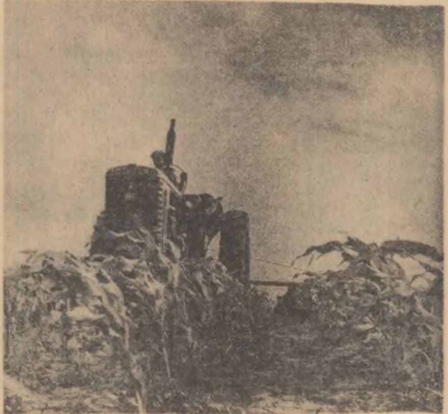
Paralel cu recoltatul griului, la cooperativa agricolă de producție din Lehtu, regiunea București, se desfășoară lucrările de îngrijire a culturilor. În fotografie: prașila a treia la porumb