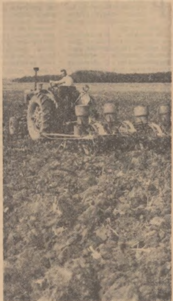
Pe terenurile eliberate după recoltarea grîului, cooperativii agricole din Buzescu, raionul Alexandria au semănat culturi duble. Iată un aspect din timpul lucrărilor