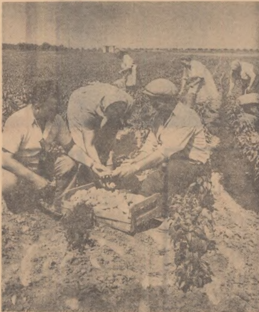
Recoltarea ardellor grași la cooperativa agricolă de producție Chișoda, regiunea Banat.

„Dar, propun cooperatorii agricoli din Mirăslău, ar fi necesar ca utilajele de irigat prin asperstune să fie perfecționate pentru a fi mai ușor de manevrat”.