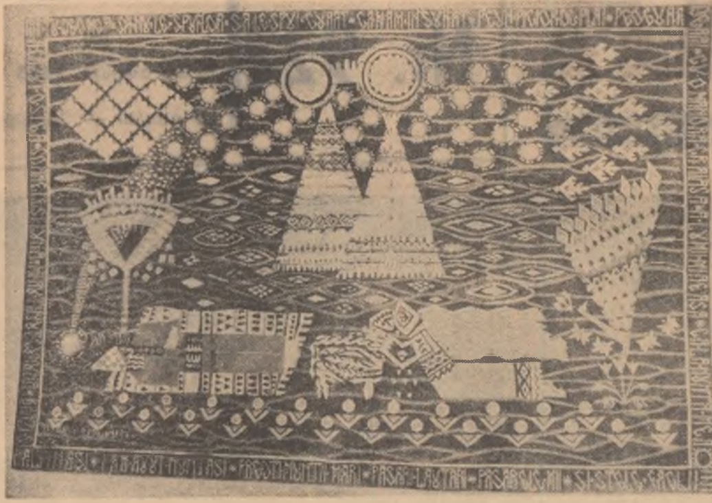
OLGA PORUMBARU: Balada Mioriței — tapiserie (de la Expoziția de artă decorativă)