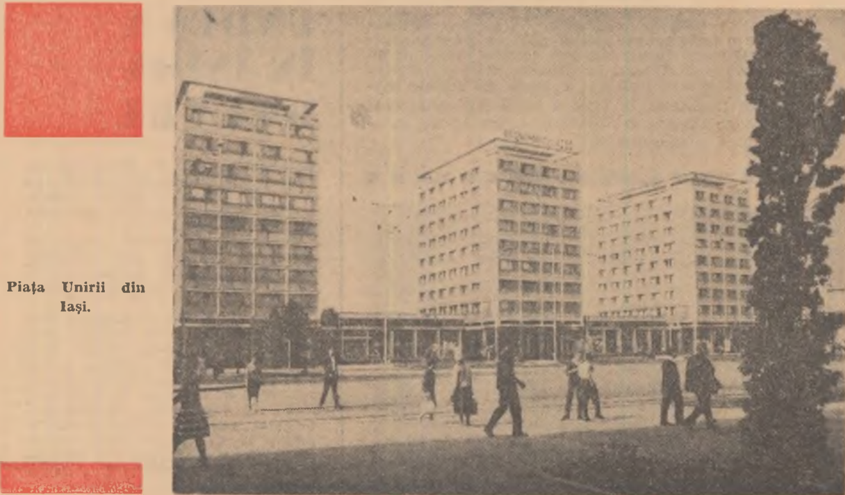
Piața Unirii din Iași.

Din tinerețe, Paul Constantinescu a dovedit un irezistibil temperament muzical și calități de creator. Lucrările de tinerețe sînt pline de fantezie și prospețime, iradiînd dintr-o imaginație efervescentă.