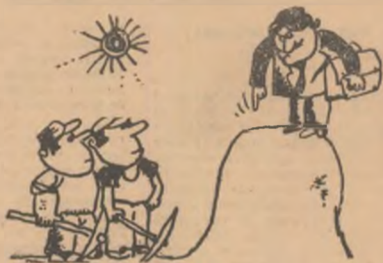
— Iar aici, vom săpa fîntina! (Din revista „Stirsel” — R.P.B.)