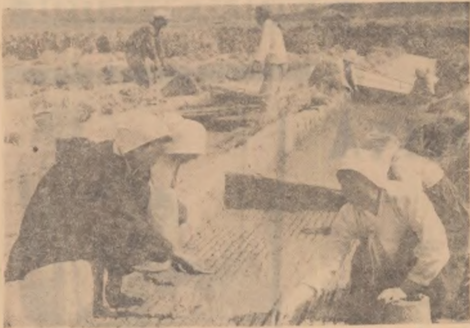
La ferma cooperativa din Ciungsan