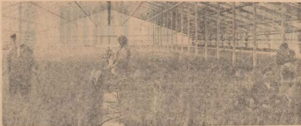
În sera de garoale a întreprinderii horticoale „1 Mai” — Grozăvești.