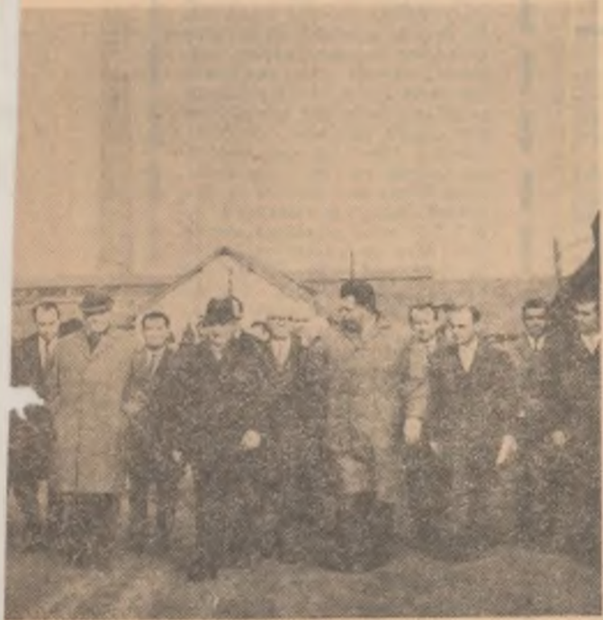
În incinta uzinelor „Unirea”, Cluj.

Au venit și vecinii. Ei le povestesc oaspeților fapte semnificative din viața lor, despre felul cum s-a ridicat Oașul în anii puterii populare, mulțumind partidului pentru copiii trimiși la învățătură, pentru școlile și dispensarele construite aici, pentru sprijinul pe care statul nostru îl dă permanent cooperativei de producție.