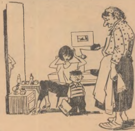
— Mamă, să te duci la școală, fiindcă nepotu-tău iar a făcut o poznă!! (Din revista „Krokodil” — U.R.S.S.)