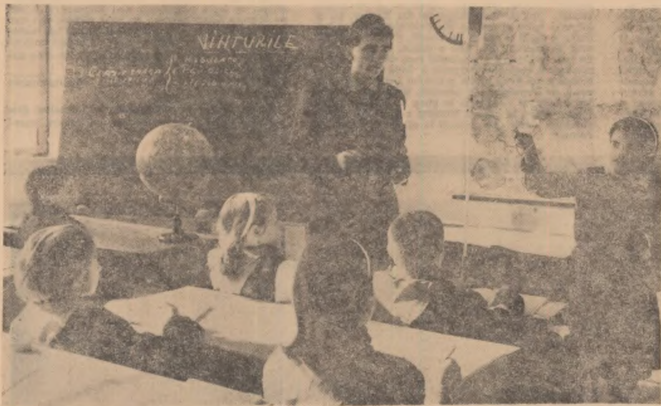
Școala generală de 8 ani din comuna Spulber-Vrancea, raionul Focșani — la ora de geografie.

ședintele statului popular comunal. L-am ales pe dînsul, nu numai pentru că în funcția pe care o deține cunoaște această problemă ci și pentru faptul că, fiind localnic, a învățat, cu mulți ani în urmă, la școala de aici.