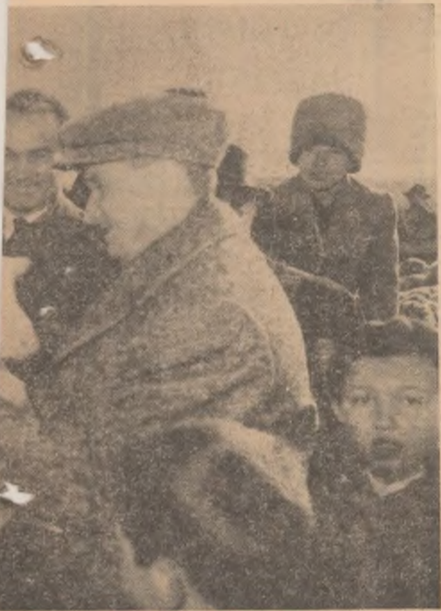
operativa agricolă de producție Botiz, regiunea Maramureș.

„Cîtu-i Maramureșu, ținc bucuria”. Am înfîlînit aceste cuvinte înscrise cu cretă pe oblonul unei case aflate undeva de-a lungul zecilor de kilometri ce au format itinerarul celei de-a doua zile a vizitei conducătorilor de partid și de stat în regiunea Maramureș.