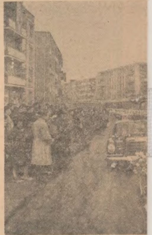
Pe străzile orașului

Despărțindu-se de țărâni din comuna Mihai Viteazu, secretarul general al C.C. al P.C.R. și-a exprimat convingerea că, muncind cu hărnicie, înfrățiți, membrii cooperativei „Arieșul” — români, maghiari și de alte naționalități — vor reuși să obțină noi succese în dezvoltarea producției și le-a urat fericire și belșug.