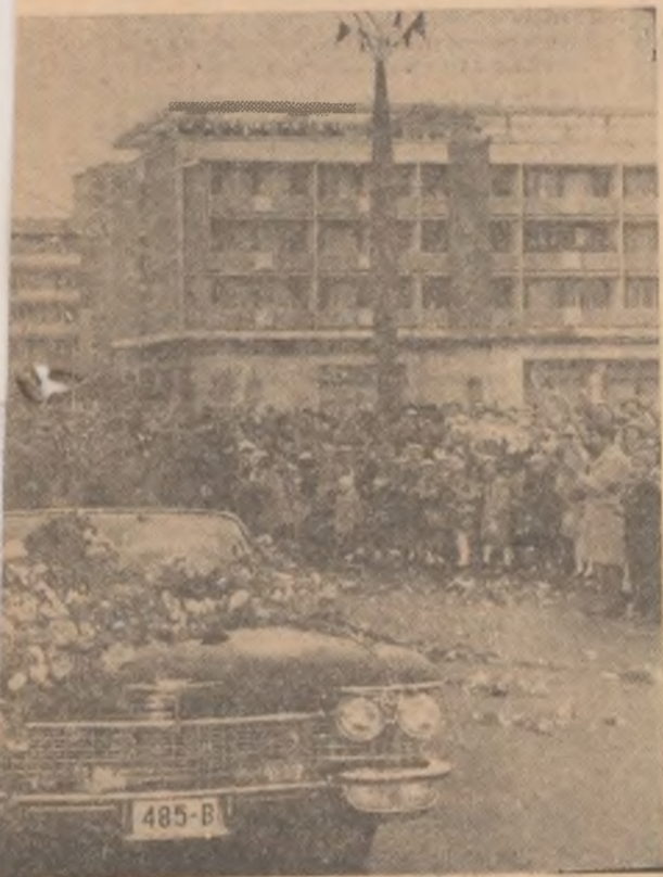
re, populația face o călduroasă primire conducătorilor de partid și de stat.