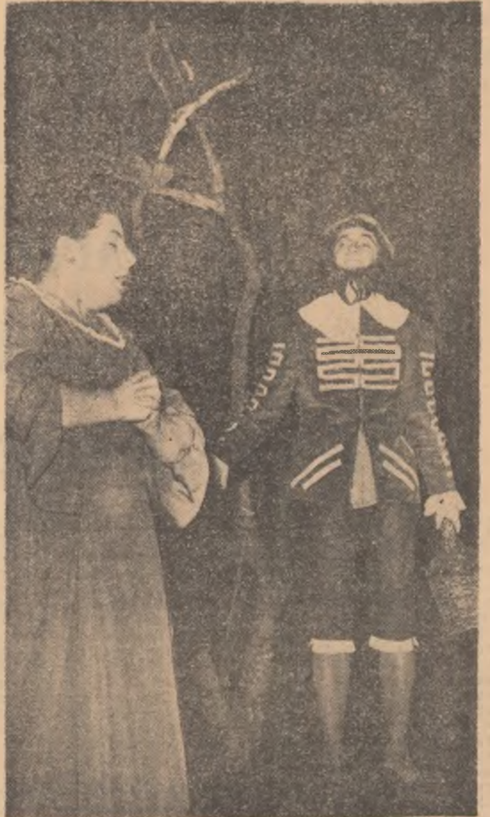
„Doctor fără voie“ — comedie în 3 acte — Casa de cultură Sîntic Moldova.