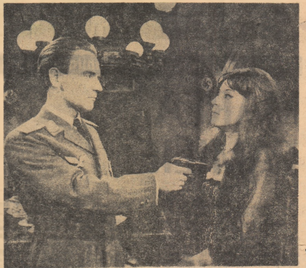
Moment de tensiune din Procesul alb