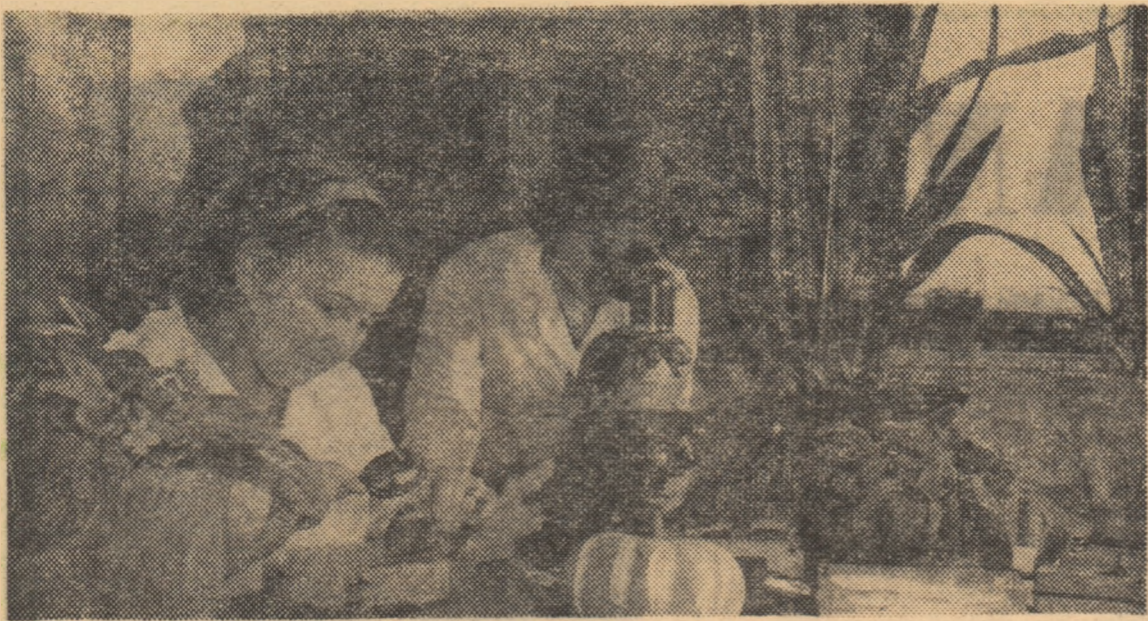
La Institutul de cercetări Fundulea se stabilesc metode raționale de combatere a celor mai păgubitori dăunători pentru cereale, plante tehnice și hortiviticele