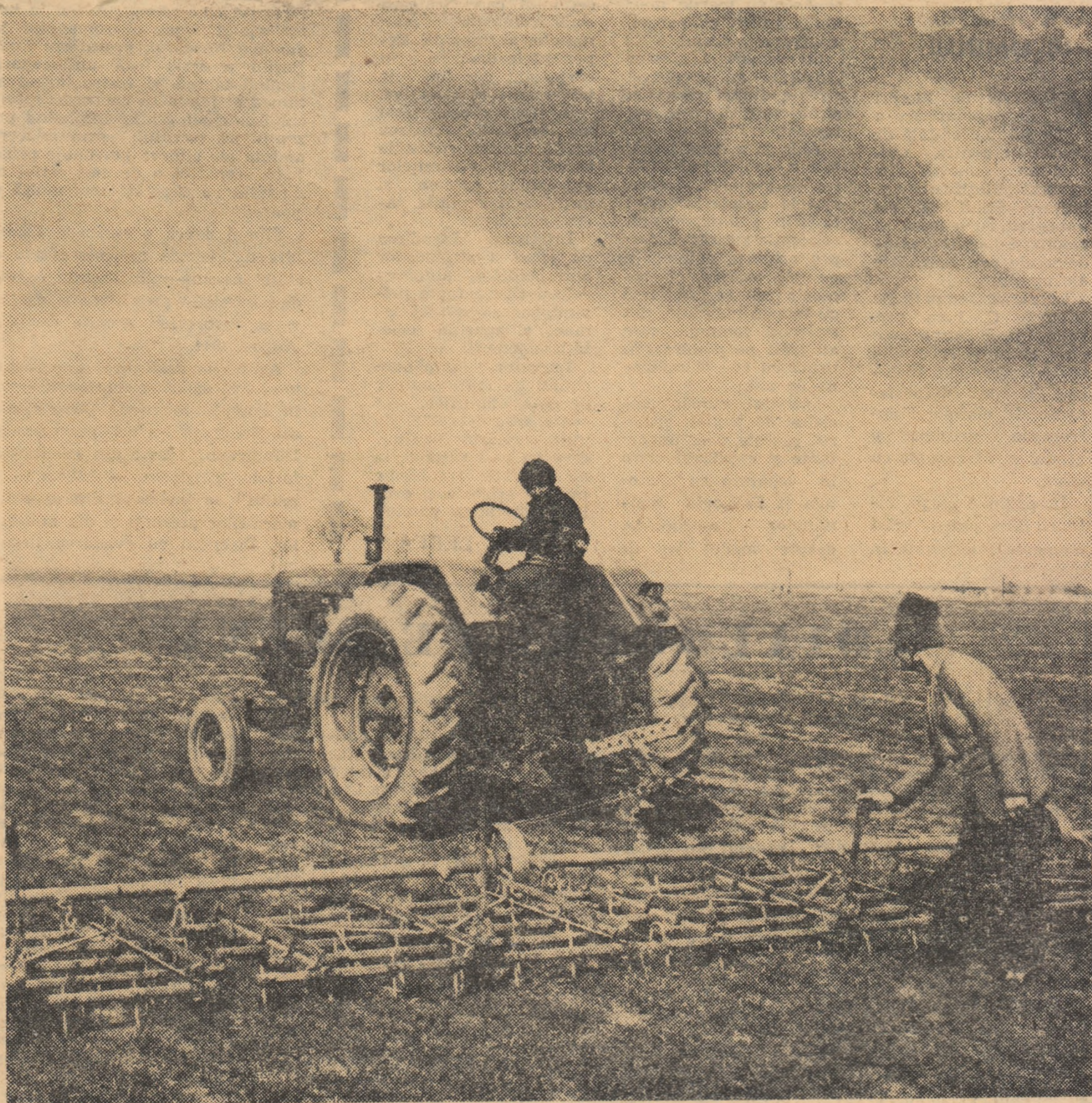
În aceste zile, la cooperativa agricolă din Găești, regiunea Argeș, se lucrează intens la îngrijirea semănturilor de toamnă

V. Durata Uniunii Naționale a Cooperativelor Agricole este nelimitată.