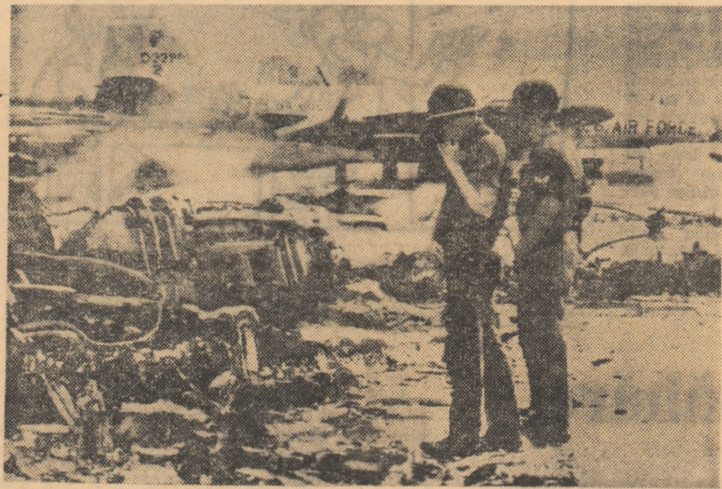
Unul din sutele de avioane doborîte de forțele patriotice din Vietnamul de sud