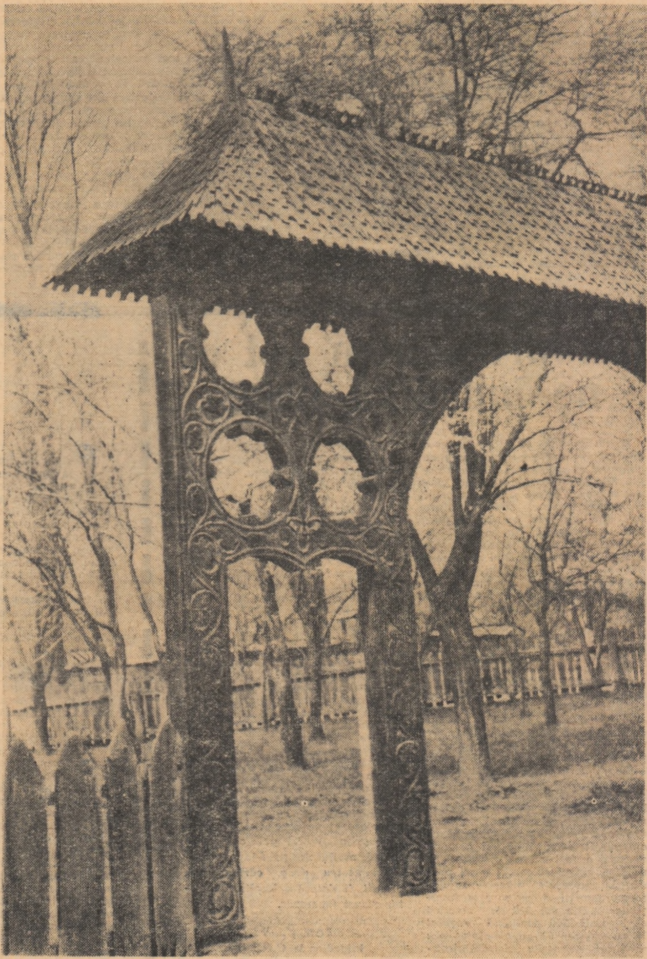
Detaliu de poartă din satul Chiojdul de Sus, raionul Cislău. Reconstituire de la începutul secolului al XVIII-lea. (Muzeul satului)

Pentru perioada cincinalului s-a prevăzut irigarea a 650 ha teren în cooperativele agricole din bazinul Someșului; executarea de lucrări de irigații și desecări cu aportul statului și mai ales prin mijloacele proprii ale unităților, pentru redarea în circuitul agricol a 2.380 ha teren, precum și executarea de lucrări de desecare prin canale lucrate manual. Cum eficiența acestor lucrări prezintă interes intercooperatist a fost necesar să se întreprindă măsuri de ordin organizatoric și tehnic. Drept rezultat, începînd cu această primăvară au fost deschise și sînt în perspectivă să înceapă mari lucrări menite să ducă la sustragerea de sub influența negativă a factorilor naturali a mari suprafețe de teren.