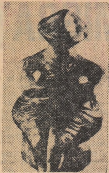
Din creația artistică a guaiășilor

Guaiășii nu au prea multe feluri de unelte, în afară de cele folosite pentru recoltarea și conservarea mierii. Ei deschid trunchiurile cu miere, și în general stupii de orice fel, cu o secure de piatră șlefuită (asemănătoare topoarelor utilizate de vechii europeni în neolitic), împletesc lungii funii din fibre de liane sau pal-