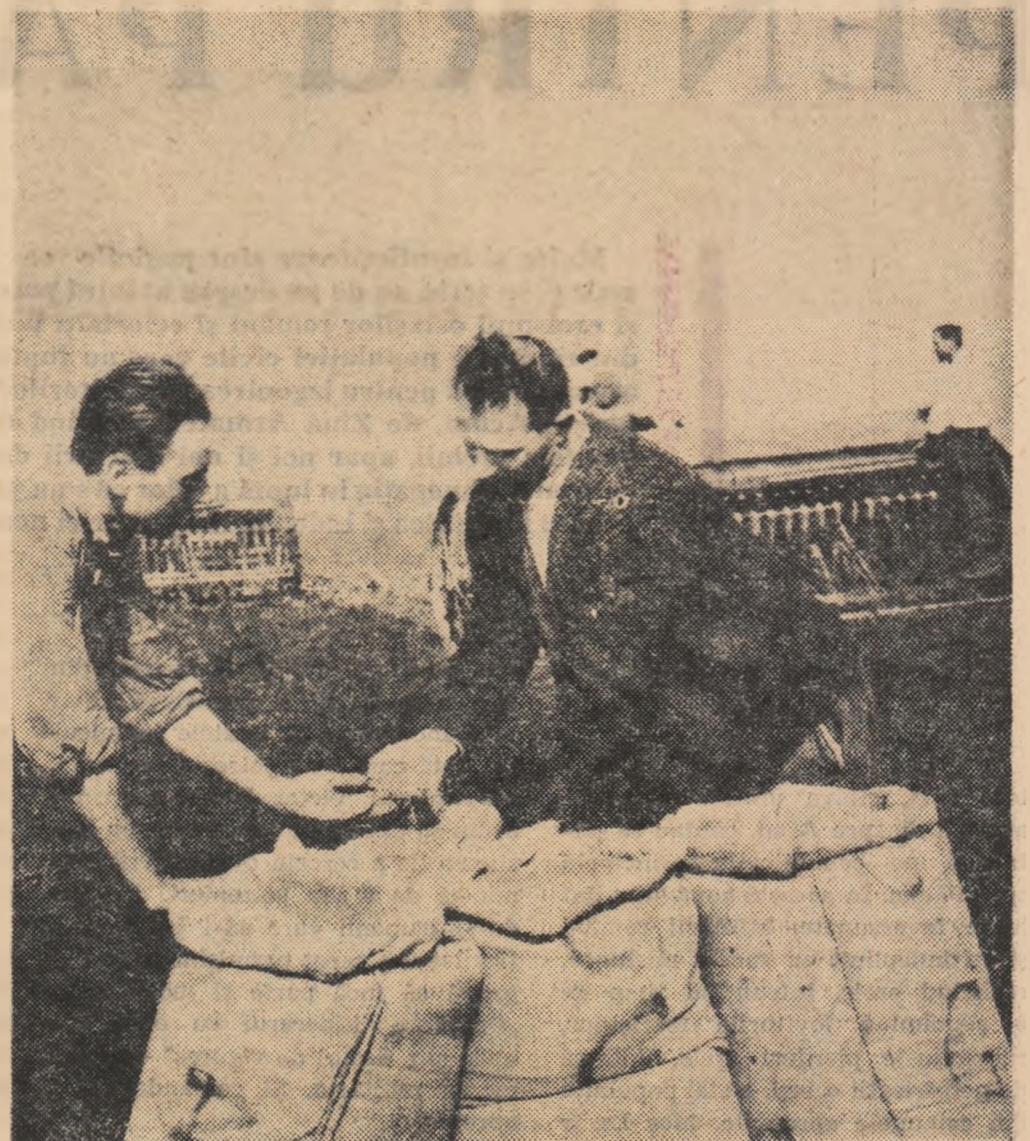
La semănatul grîului în cooperativa agricolă din Greaca, regiunea București

Țăranii cooperatori necuprinși la învățămîntul agrozootehnic de masă