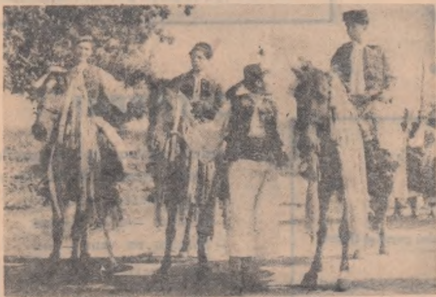
Chemători la nuntă din Budești-Sighet

O parte din documentele acestei călătorii pot fi văzute într-un album dăruit Muzeului de istorie al orașului Buzău.