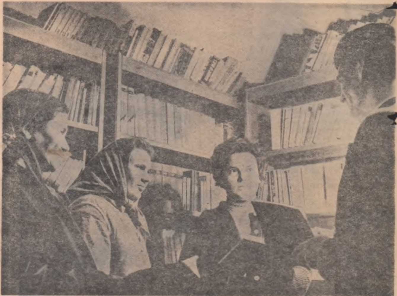
La biblioteca din Frunzaru-Argeș.