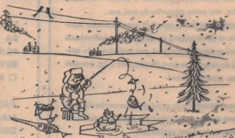
Desenul are cinci greșeli.