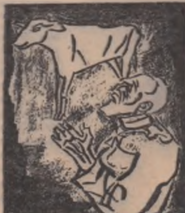
Vitețul de aur.