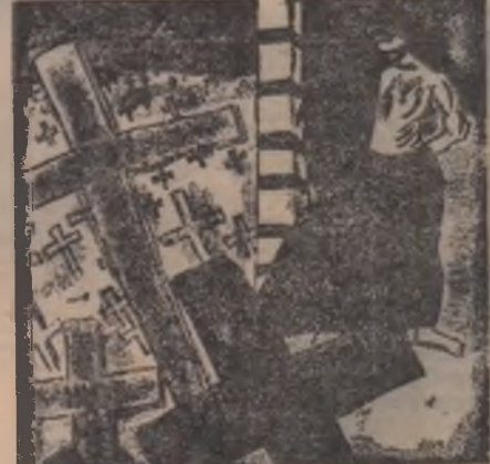
Holera: — Nu mai e nevoie de mine; mi-a luat-o Brătianu înainte.