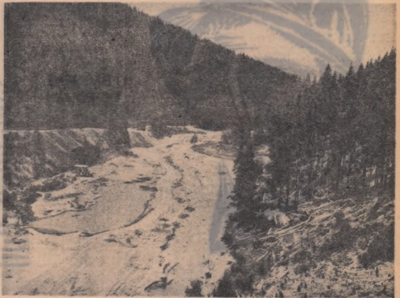
Lotrul, vechiul cărauș al buștenilor, viitor furnizor de energie electrică