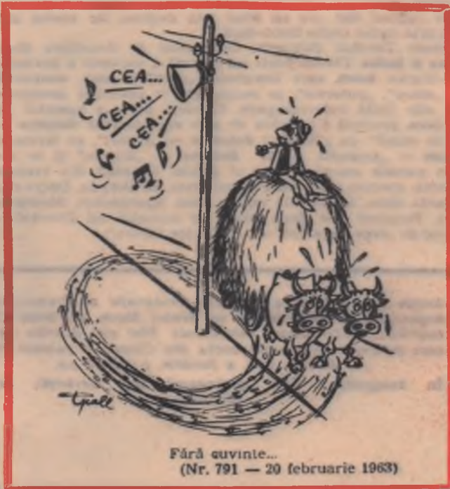
Fără cuvinte... (Nr. 791 — 20 februarie 1963)