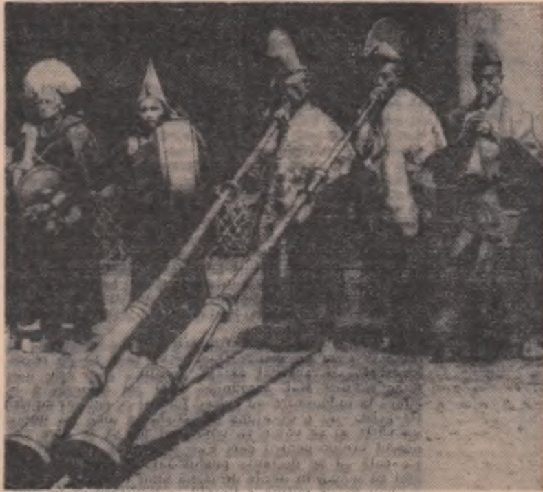
Muzicanți din Sikkim, în portul lor tradițional