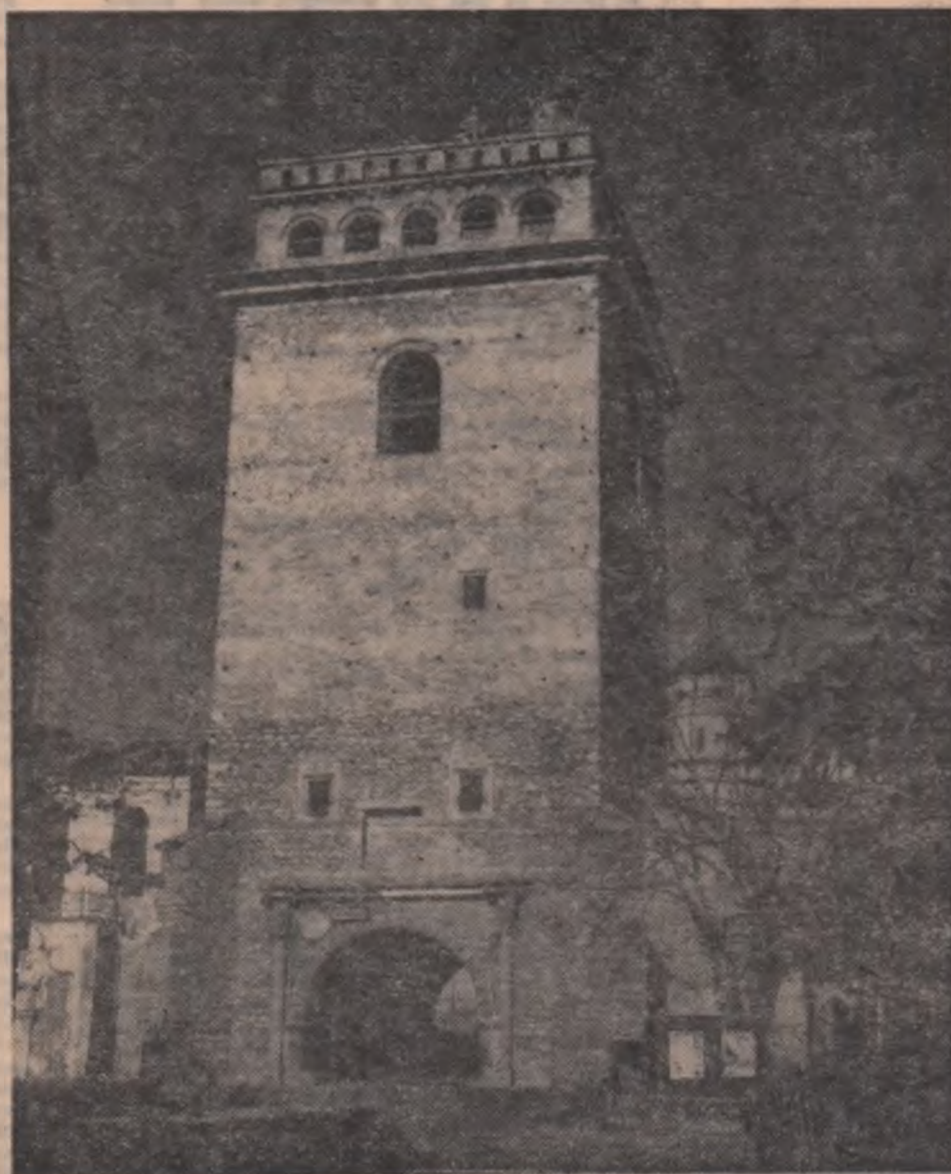
Turnul Golia — Iași