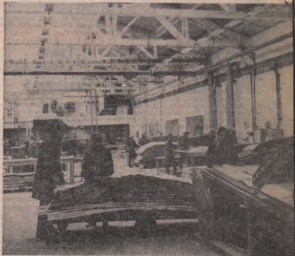
La Combinatul de industrializare a lemnului din Sighetul Marmației