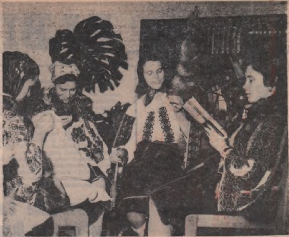
Sezătoare la căminul cultural (comuna Vama, raionul Cimpulung Moldovenesc, regiunea Suceava)