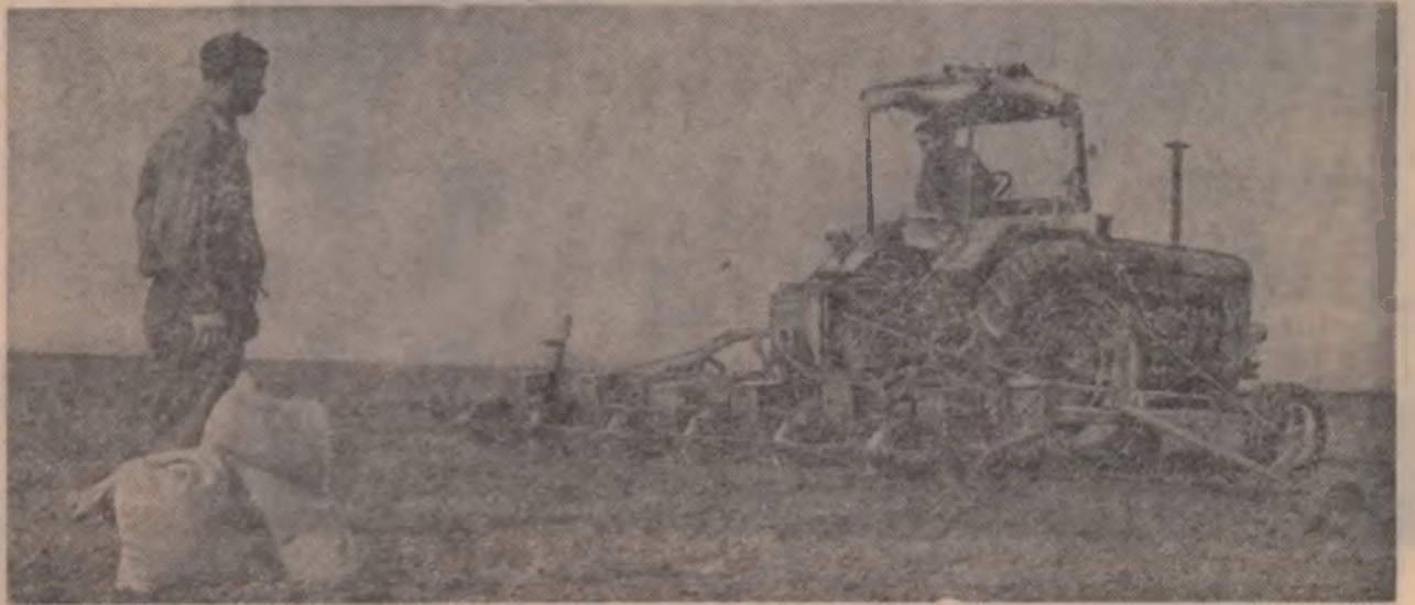
Semănatul porumbului la G.A.S. Hirșova

„Ceea ce uimește, ne semnalează unul din corespondenți, este faptul că, acum, în toată lucrările de primăvară, atelele cooperative agricole din Necopoi, raionul Satu-Mare, sint folosite la transportul lemnelor”. Oare să nu fi știut cei care răspund de buna organizare a lucrărilor agricole că în aceste zile, de obicei, se ară și se seamănă în toată țara? Că în timp ce cărutul lemnelor poate fi aminat, la semănat contează fiecare zi?