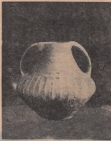
Vas de lut din epoca neolitică

Duminica pe ulița comunei Novaci-Oltenia