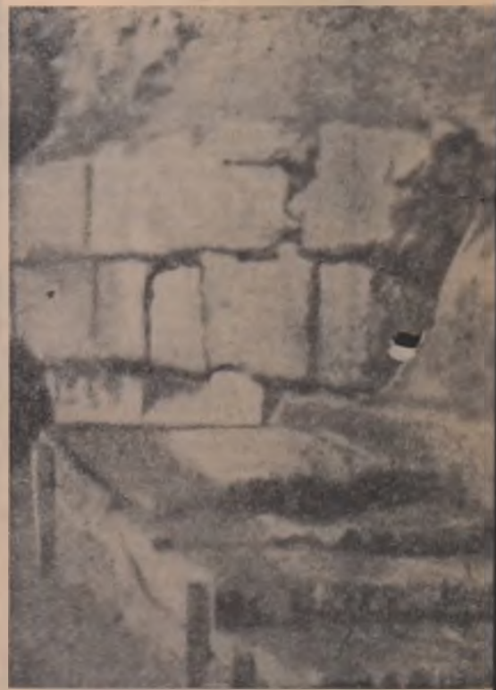
Sarmizegetusa — treptele de lângă zidul sudic al sanctuarului vechi