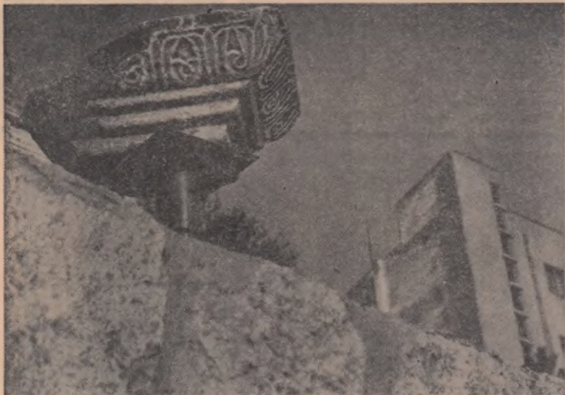
Constanța — trecul și prezent

L-am mai întîlnit pe Lenin după Revoluția din Octombrie, cînd era președintele Consiliului Comisariilor Poporului, conducătorul primului stat socialist din lume. Era împovărat de o mulțime de treburi și mari și mici. Dar el rămăsese același Ilici al nostru, prietenos și atent cu toată lumea, cum fusese și înainte.