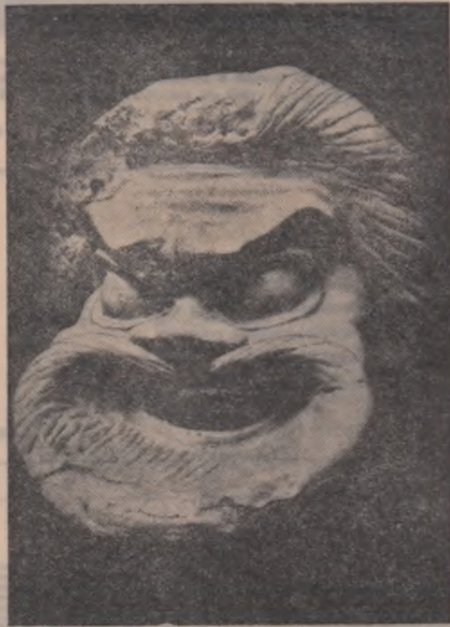
Mască comică (sec. IV—III î.e.n.)