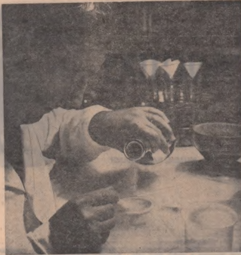
Aspect din laboratorul de metabolism animal de la Institutul de biochimie din București

Lemnul în stare de putrezire conține urme de fosfor. După cum se știe, această substanță are proprietatea de a emana lumină. În întuneric, în lemnele putrede din pădure, din lunci, din jurul casei pot să mijască într-un mod straniu și surprinzător tot felul de forme. Acestea stimulează închipuirea și omul declară că a văzut cu ochiul lui cine știe ce ființă miraculoasă, duh care făcea semne etc. Și într-adevăr ceva el a văzut și mai pot vedea și alții, dar totul depinde cum înțelegi lucrurile, cum le tălmăcești. Dacă te sperii de propria ta umbră și gindești necritic, superstiții te pîndește. În decursul timpurilor, iluziile, ca manifestări ale imperfecțiunii organelor noastre de simț, accentuate prin tălmăcirii și mai greșite, au contribuit mult la apariția și răspîndirea unor superstiții, a unor credințe greșite. Gîndirea viguroasă, realistă, științifică, ne ajută să înțelegem bine ce sînt iluziile și putem interpreta just fenomenele inconjurătoare.