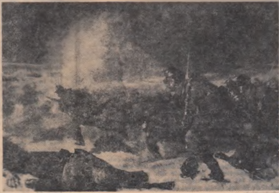
Nicolae Grigorescu : Atacul de la Smîrdan