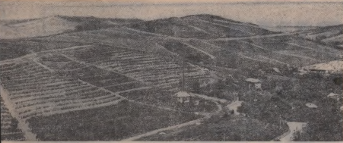
...să, vedere parțială