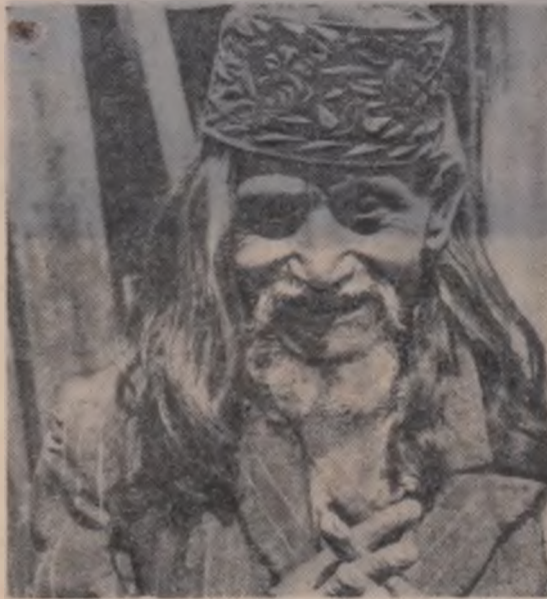
Cîntăreț ambulant din Bhak Tapur — Nepal

După cercetări de ani de zile, un zoolog englez a demonstrat că, coarnele animalelor au o funcție fiziologică specială. Ele reprezintă un adevărat radiator. Coarnele conțin o întregă rețea de vene și artere. Cînd animalul se încălzește, singele năvălește în coarne și transmite surplusuri de căldură mediului înconjurător. Invers, cînd temperatura exterioară este scăzută, vasele sanguine se contractă, radiatorul se închide și animalul își păstrează în corp prețioasele calorii.