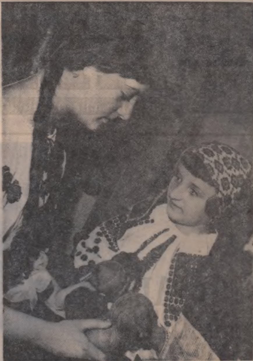
Am ales bine culorile ?