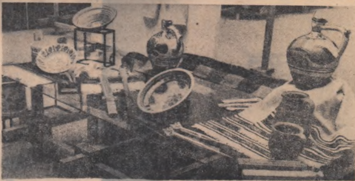
Ceramica de Vama — regiunea Maramureș

(De la Expoziția bienală de artă populară).