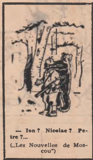
— Ion? Nicolae? Petre?... („Les Nouvelles de Moscou”)