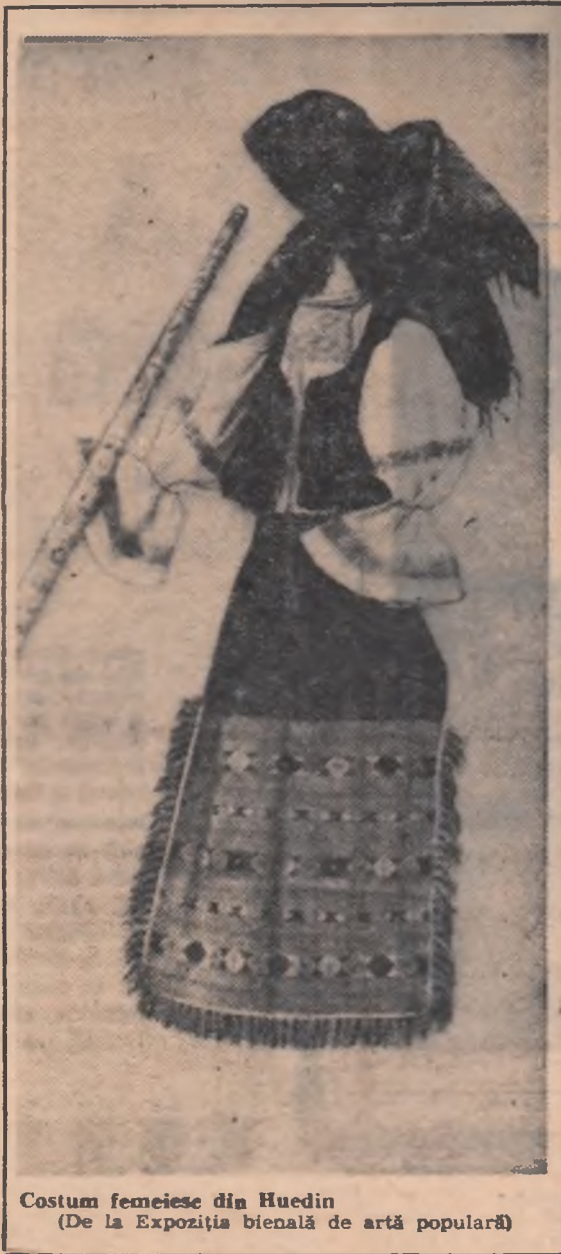
Costum femeiesc din Huedin (De la Expoziția bienală de artă populară)

Cunoașterea aptitudinilor la tinăr cere un studiu atent și responsabil. Există bunul obicei — de altfel foarte răspîndit — ca la terminarea școlii tinerilor să li se pună întrebarea: „Ce profesie îți alegi?” Maturii dau în acest caz, bazați pe îndelungata lor experiență, sugestii realiste, temperează, cînd e nevoie, exaltarea tinărului, îl pot corija în cazul unei hotăriri pripite.