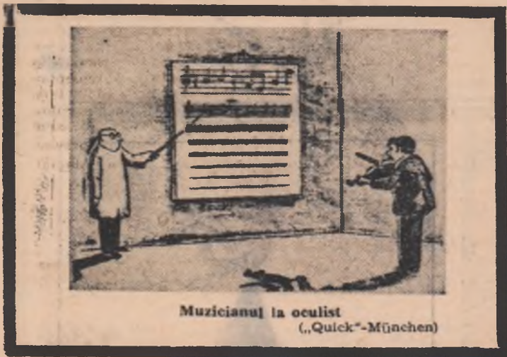
Muzicianul la oculist

La semnalul arbitrilor, luptătorii cu „armele” lor în mîini pătrund în centrul unui cerc cu diametrul de 3 m și încep să se gîdile cu penele. Se întîmplă rar ca un luptător să reziste mai mult de un sfert de oră fără să ridă. Este considerat învins cel care rîde primul.