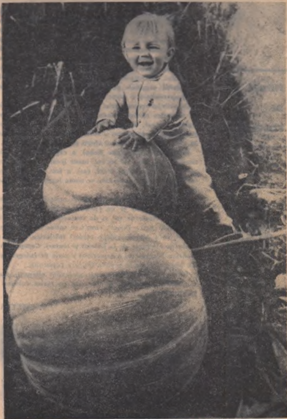
Întîlnire cu toamna