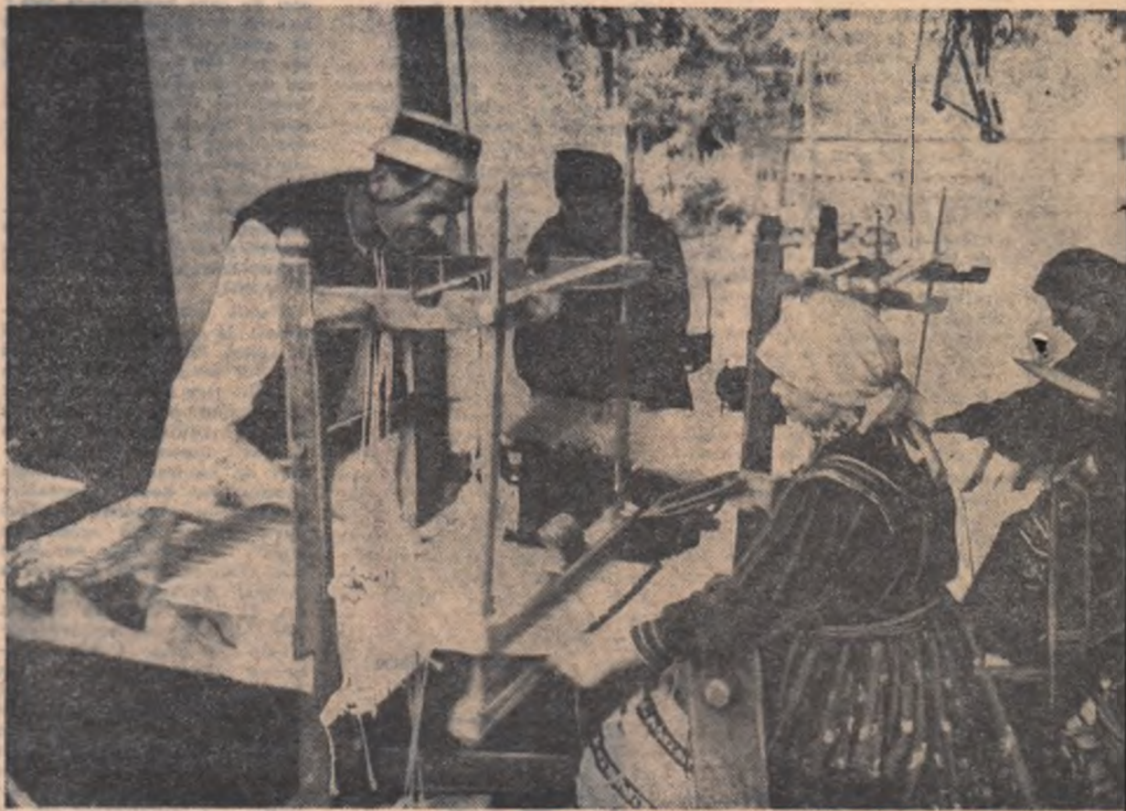
La Certeze, a luat ființă prima secție de țesături populare a U.R.C.C. — Oaș