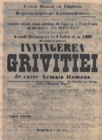
Afișul spectacolului „Invingerea Griviței de către Armata română” dat în ziua de 2 iulie 1882

În zilele de 23—24 septembrie, pe scena Teatrului din