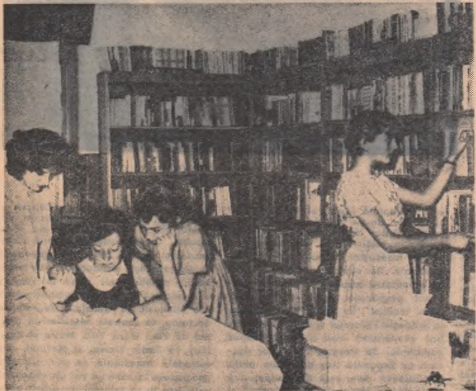
Biblioteca din comuna Rucăr, regiunea Argeș, oferă unui mare număr de cititori posibilitatea de a-și îmbogăți cunoștințele