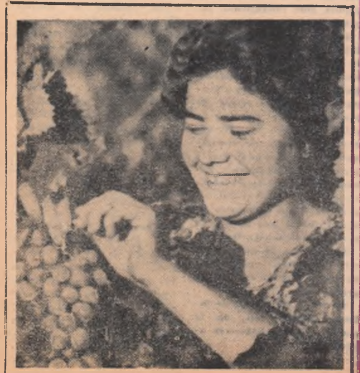
...Și-n vie e-atîta veselie