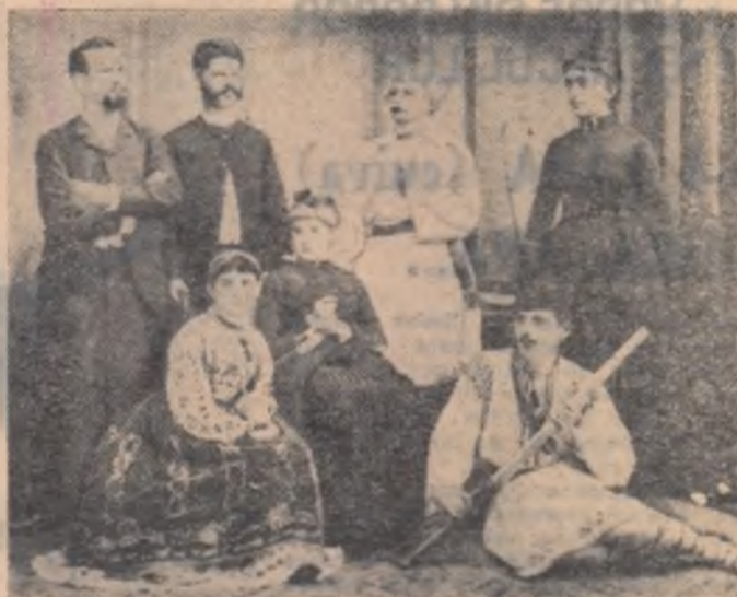
Interpreți lugojeni care au prezentat piesa „Un tutor” (1895)

Lugoj își vor da întâlnire simbolică actorii Teatrului Național din București cu „Apus de soare” de Delavrancea și actorii amatori din Lugoj, cu