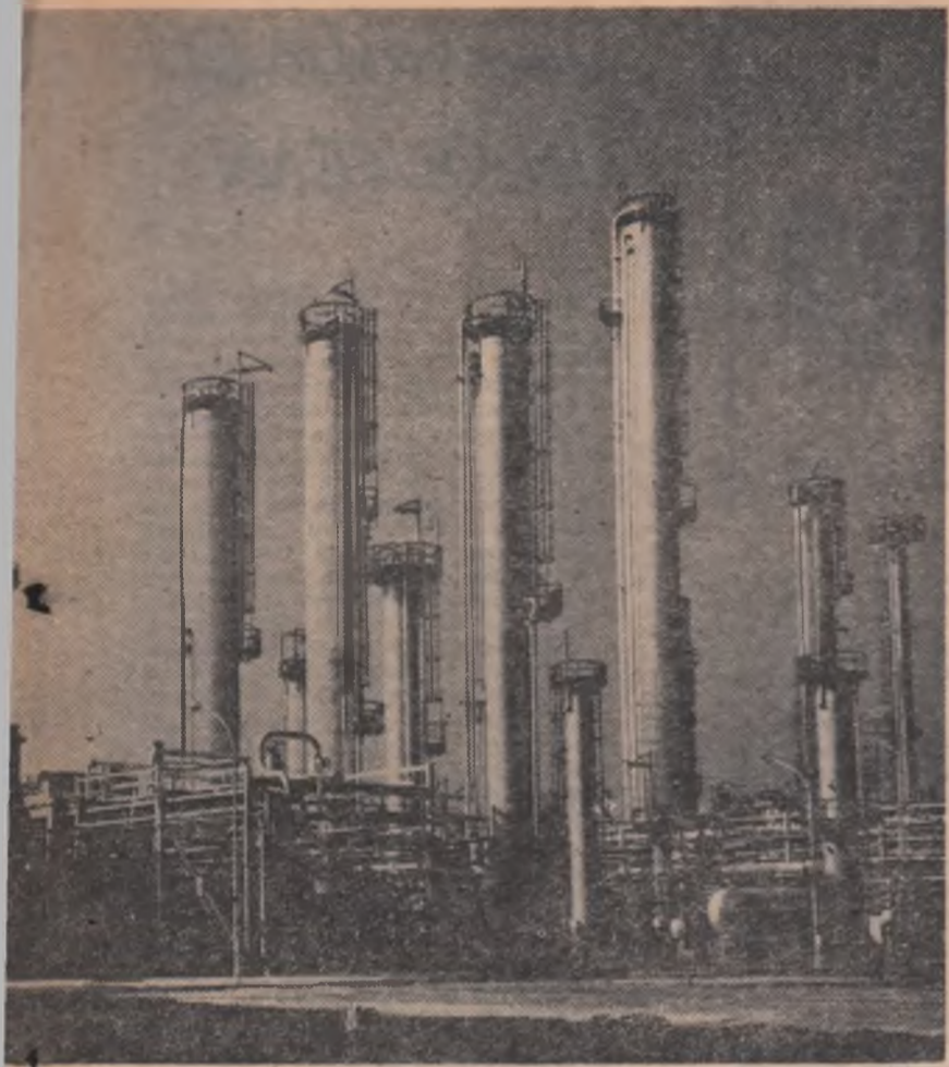
Fintinele — regiunea Mureș-Autonomă Maghiară