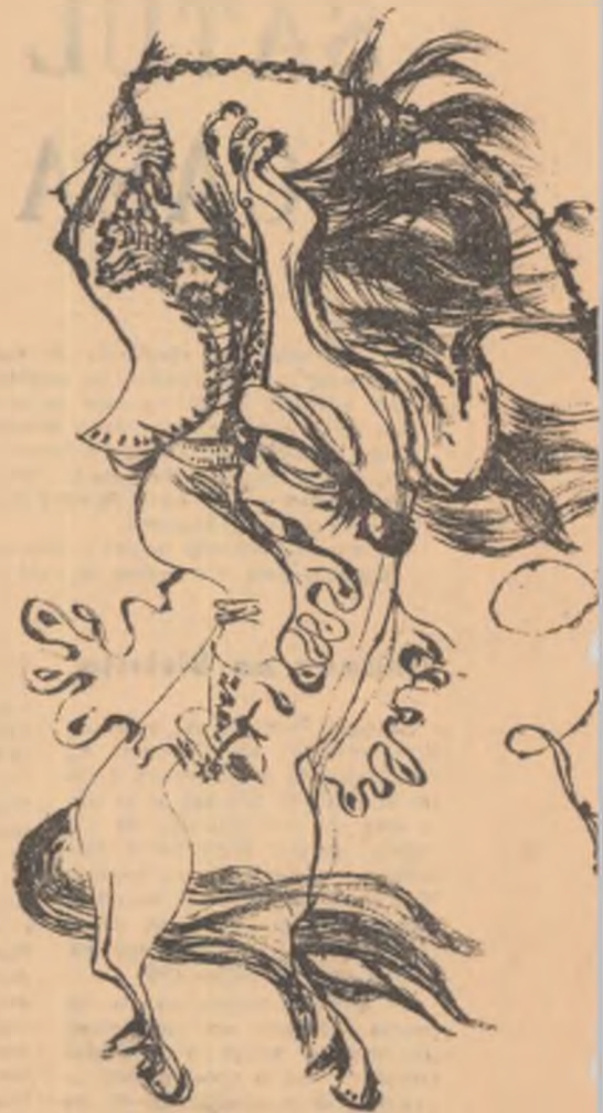
Desen de NICA PETRE

— Draga noastră Zoe, a vorbit Zulnia, cu glas tremurat de emoție, află