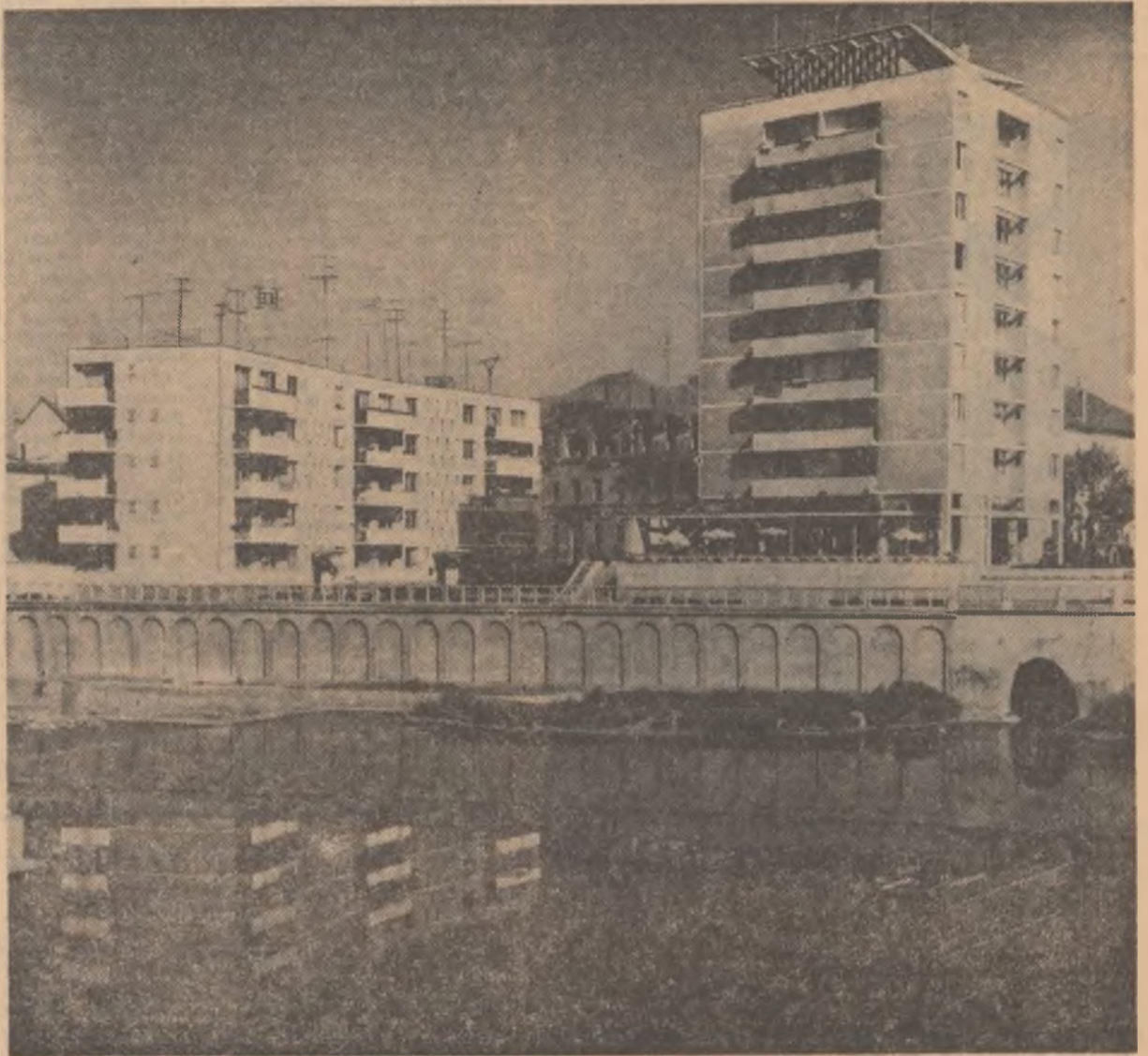
Vedere din Oradea. Blocuri noi de locuințe reflectîndu-se în Criș

Întă de ce ele se bucură de înțelegerea și sprijinul unanim al oamenilor muncii din întreaga țară.