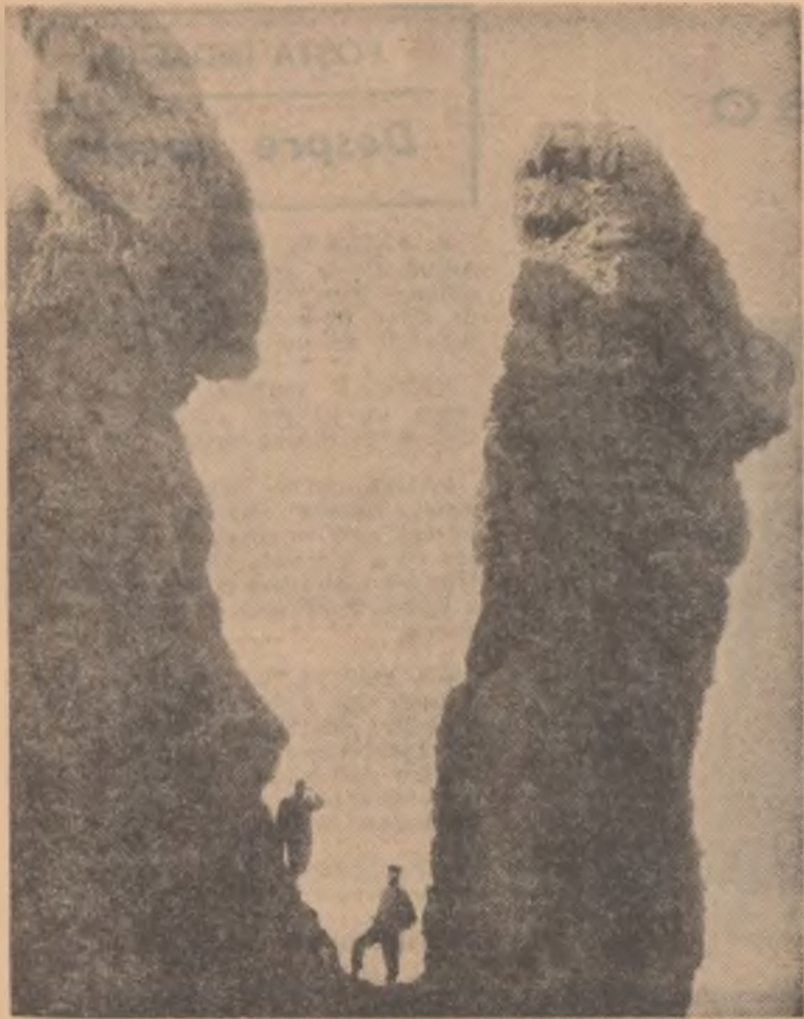
Cei doi „uriasi“ din munții Căliman — stlnci de origine vulcanică — fierestruite prin jocul îndelungat al timpului