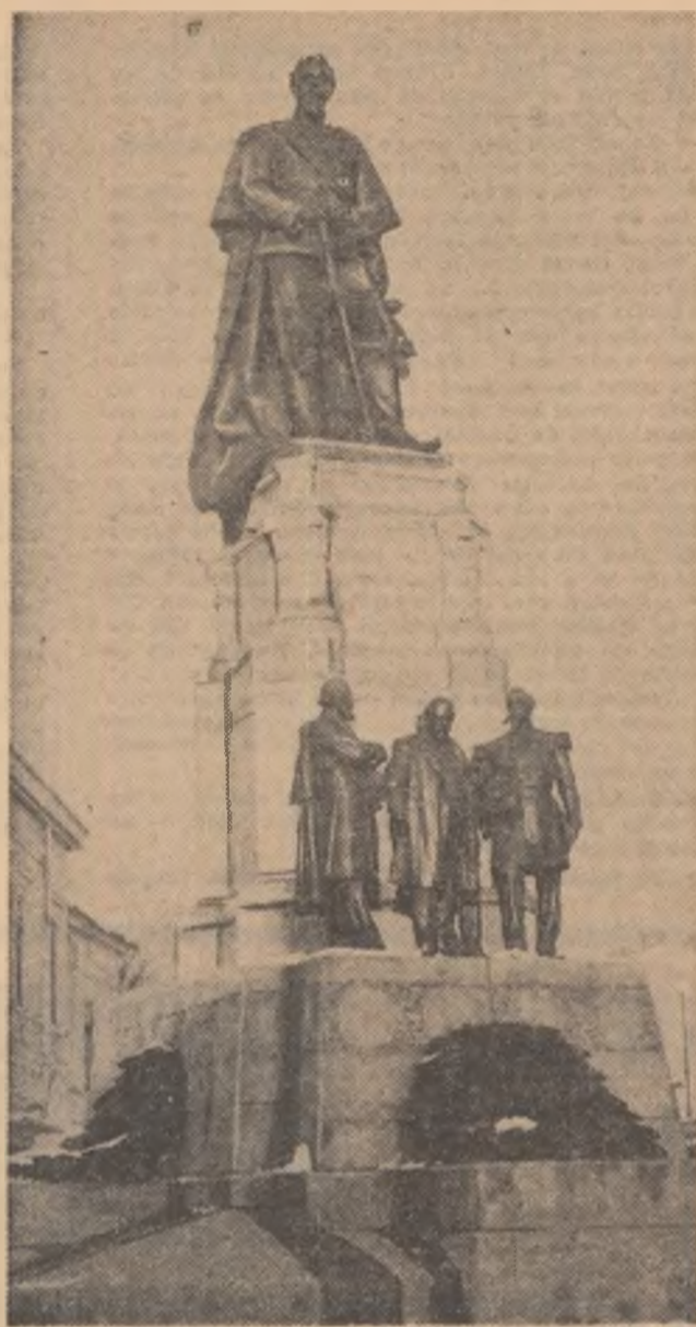
Statuia lui Al. I. Cuza la Iași