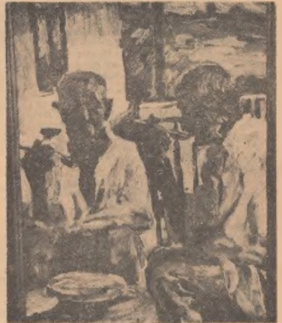
Tărani la masă (ulei) 1928.

A zugrăvit însă mai ales peisajele țării noastre