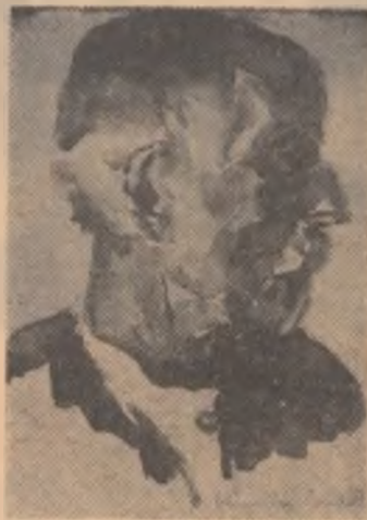
Cap de țaran (acuarelă) 1940.

Luna asfințea printre brazi, stîrnind umbre, zvonuri ciudate, mistere. Din cînd în cînd, în jurul Castelului, păsări de noapte foșneau din aripi moi. Treziți parcă din somn, greierii dădeau semne de neînțeleasă neliniște.