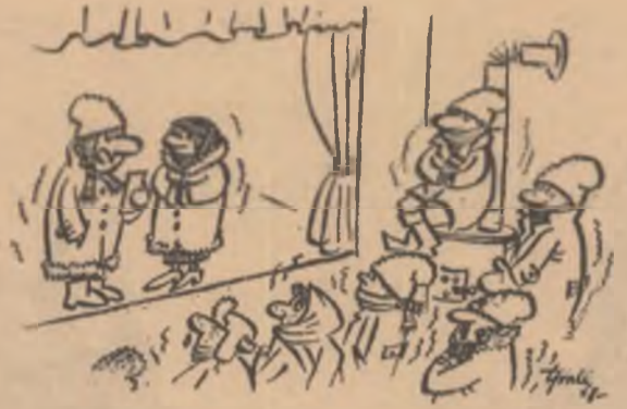
— La cererea unor spectatori, solista noastră va interpreta cîntecul „Vară-vară-primăvară“...