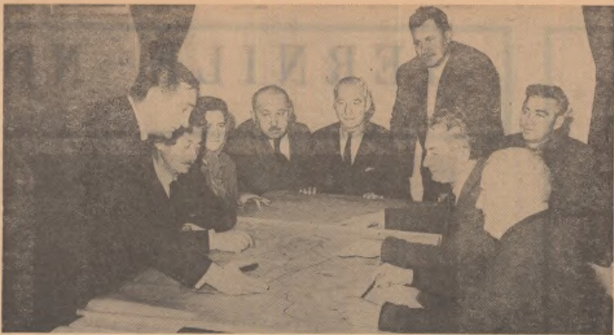
Consiliul de conducere al C.A.P. din Otopeni discutind despre amplasamentul noilor construcții de sere.