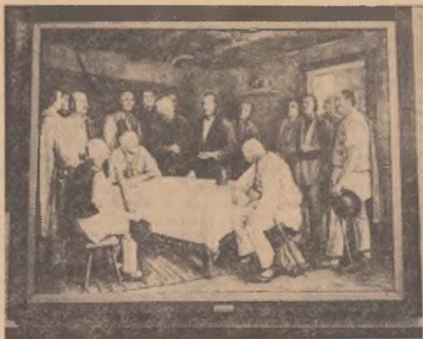
Nicolae Bălcescu în mijlocul ciocănarilor

„Pe voi vă nimiciră a pizmei răutate, Și oarba neunire la Milcov și Carpați !