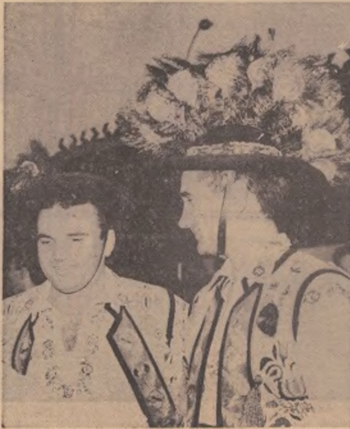
Cu peana la pălărie