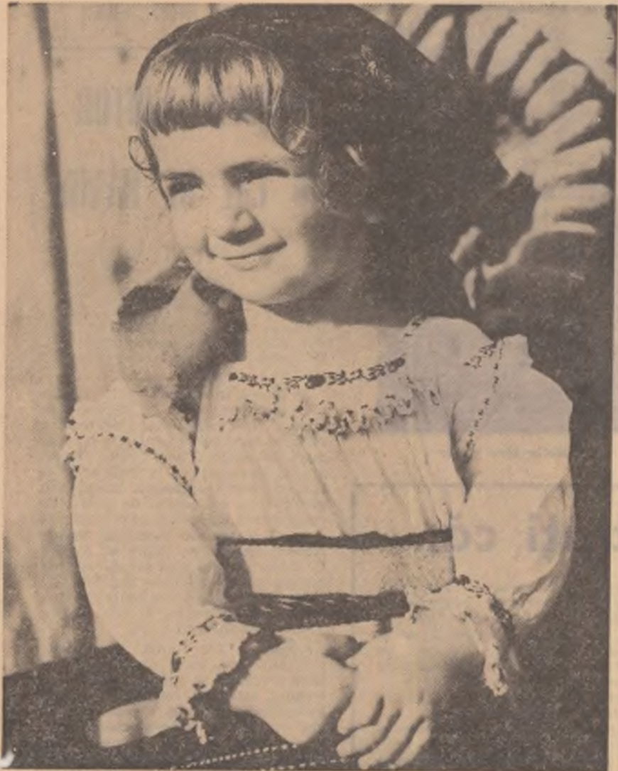
Voicîița din Rona de Jos-Maramureș