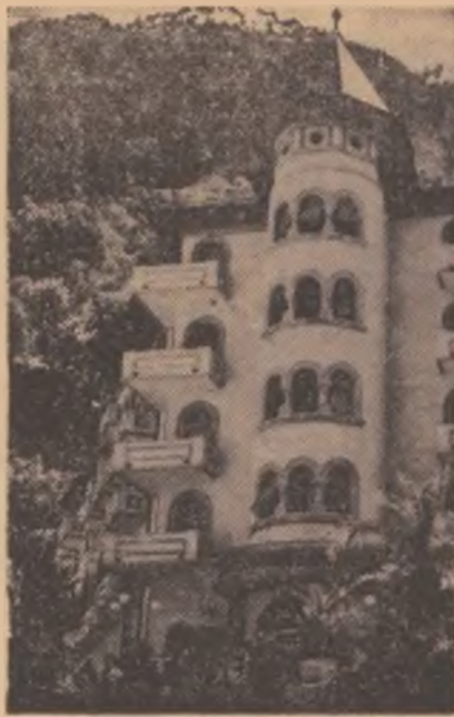
La Băile Herculane