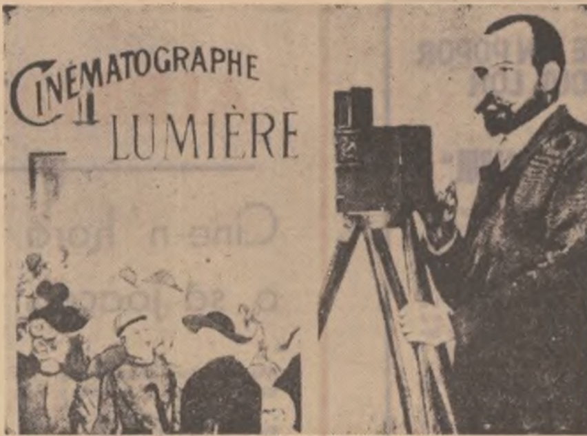
Primul afiș al cinematografului „Lumière”.