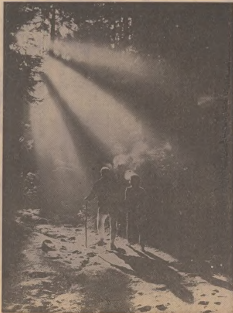
Spre lumina.