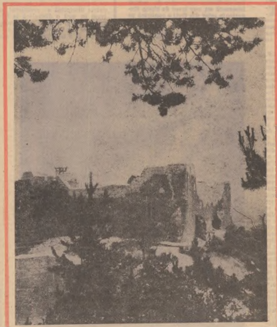
Ruinele cetății Neamțului — fortificație ridicată în secolul XIV de Petru Mușat, întărită de Ștefan cel Mare în secolul următor.