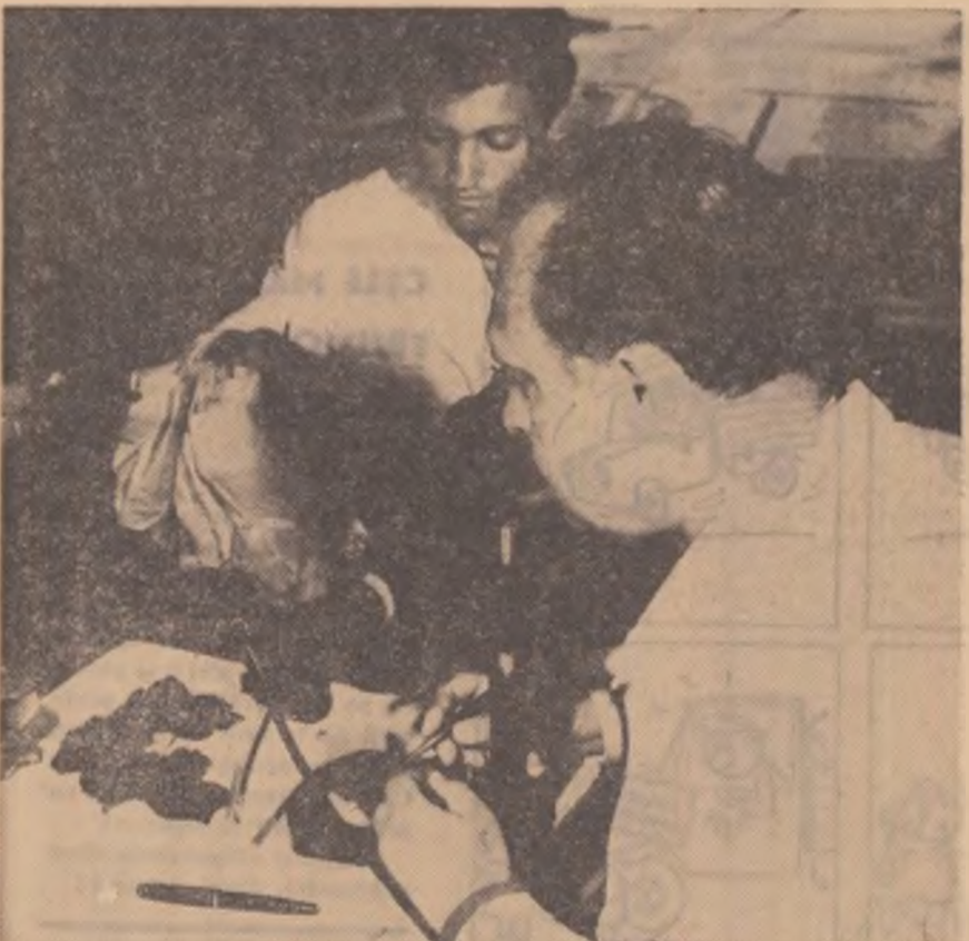
La Institutul Central de Cercetări Agricole din Capitală se fac analize asupra eficacității produselor chimice folosite în combaterea dăunătorilor la pomii fructiferi