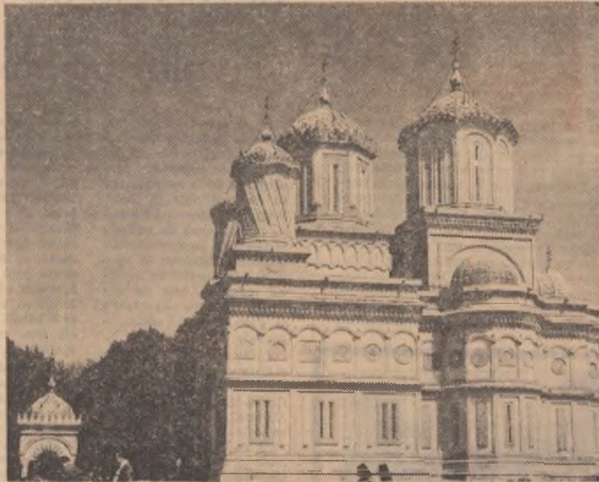
Manăstirea Curtea de Argeș