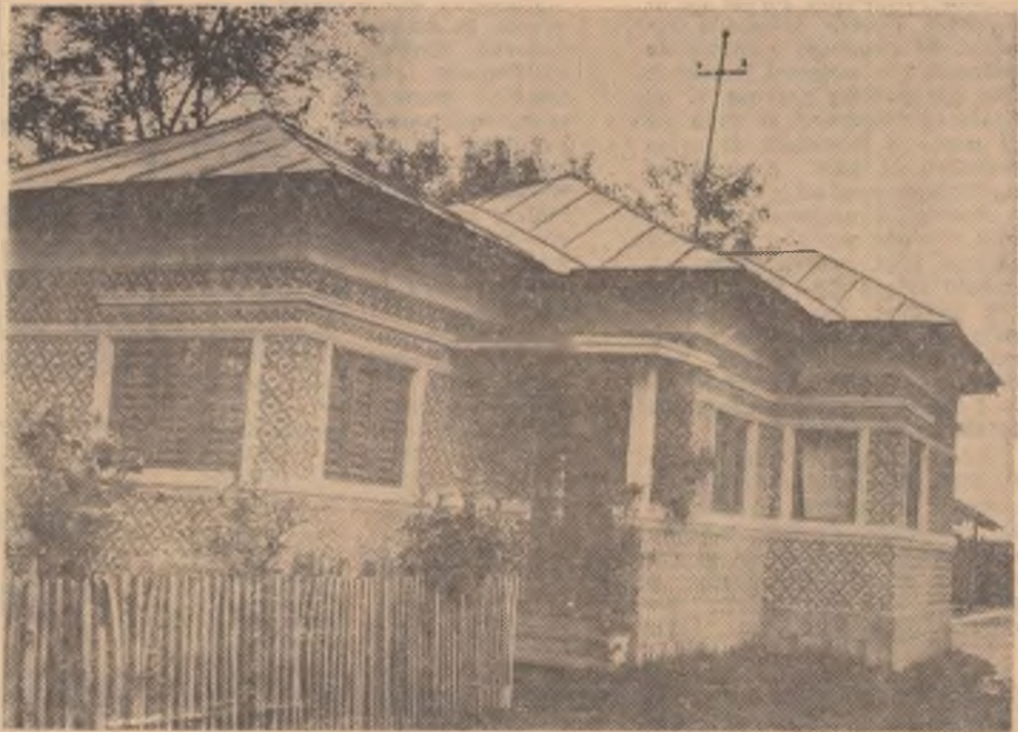
Casă din Cocorășți—Prahova

● Printre formele de asigurare practicate de ADAS există una care vă poate asigura o pensie pe timp de 5—10 ani. Aceasta este Asigurarea de economie și de invaliditate permanentă din accidente, la care suma asigurată — de 10 000 lei sau mai mare,