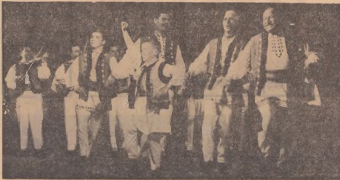
„Hora pe bătaie” interpretată de un grup de dansatori din comuna Făgărașul Nou, județul Constanța