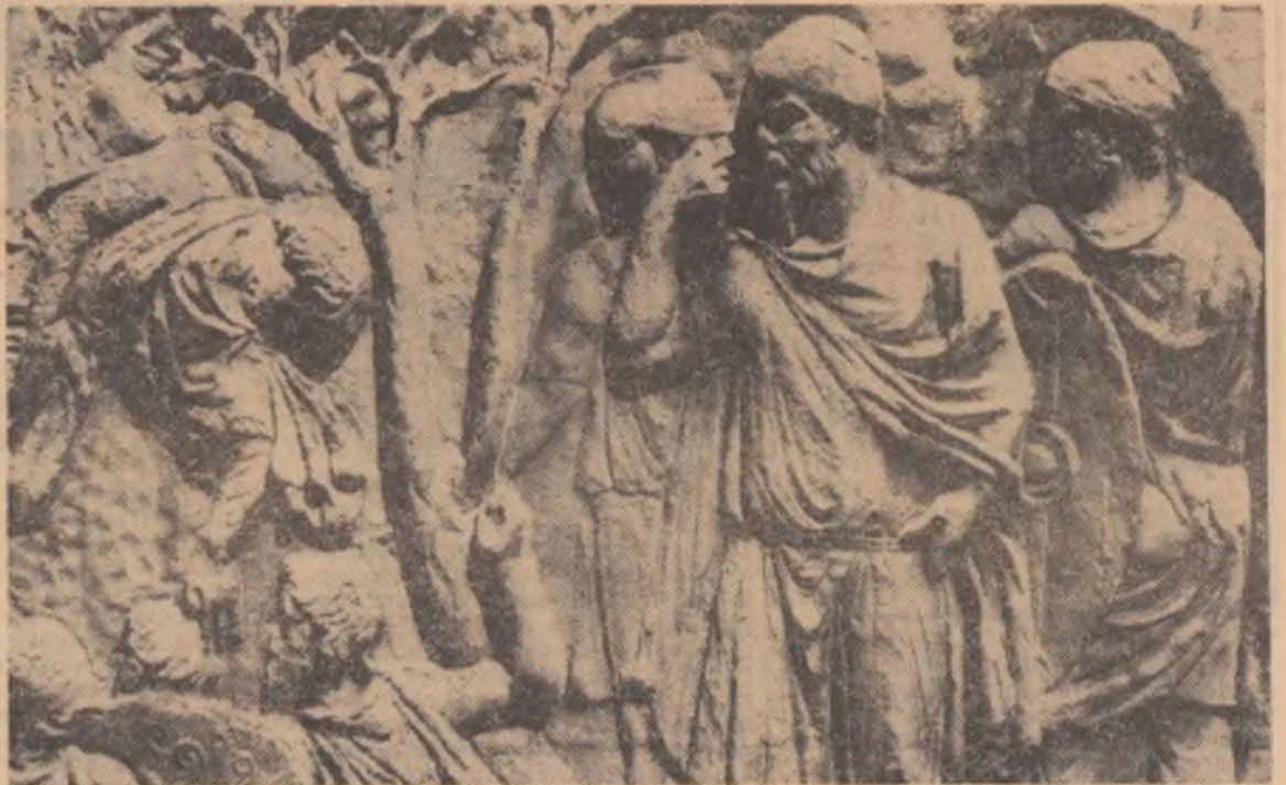
Atacarea unei poziții romane de către dacii conduși de Decebal