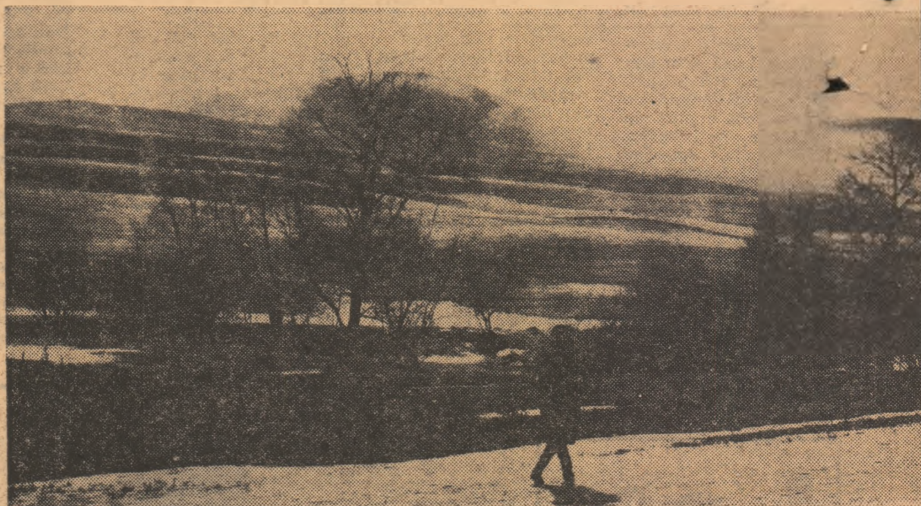
Peisaj sucevean