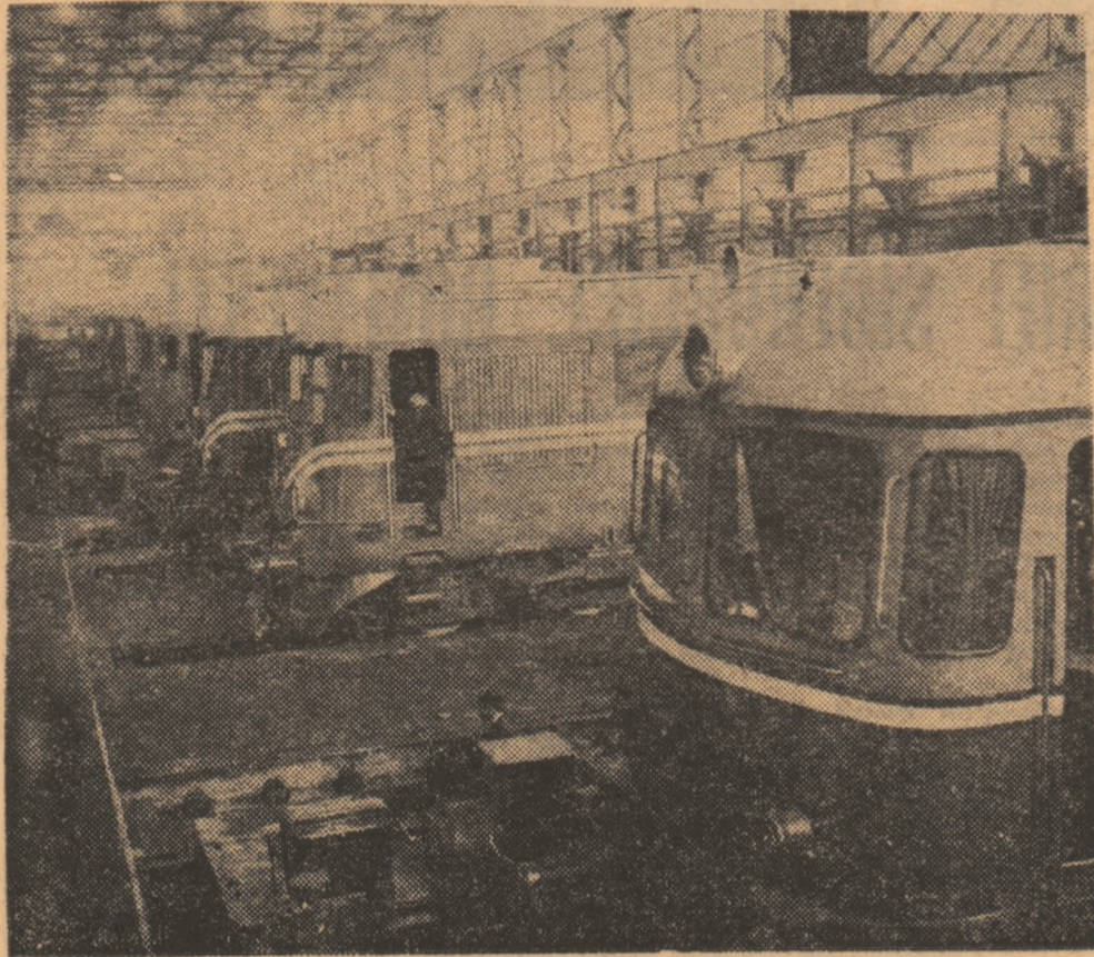
Hala de montaj a uzinelor „Electroputere”-Craiova