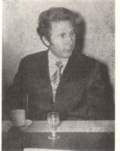
MARIN SORESCU : „Singur printre poezii“.

IOANID ROMANESCU : O problemă dificilă : „comerțul“ cu arta. Dacă în plan econo-