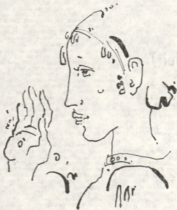
Desen de Ion Carp FLUIERICI