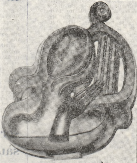
Ion Irimescu: „Muzica”