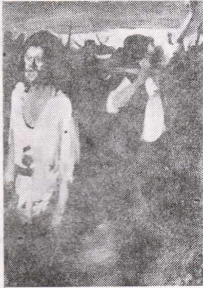
Corneliu BABA: „Mihail Sadoveanu” — „Răscoala”