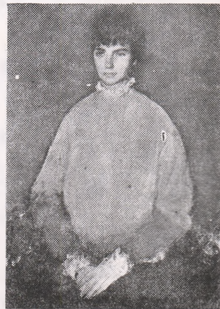
Corneliu BABA :