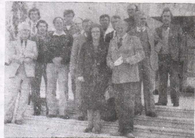
Membri ai cenaclului „Ștefan Luchian” (Botoșani, octombrie, 1986)