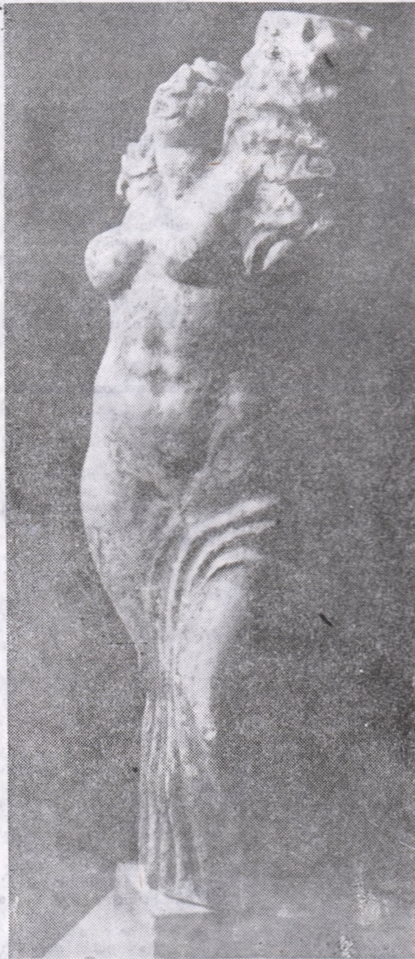
Mircea DĂNEASĂ: „Primăvara”