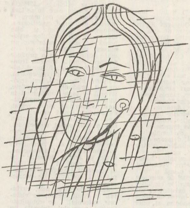
Desen de Costin NEAMȚU